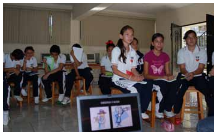
▲ Taller a estudiantes

Apropiación → Mantenimiento → Dinamización/desarrollo