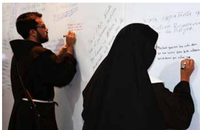
▲ Panel de recopilación de opiniones de los visitantes en la exposición de Santa Clara en Atlixco, Puebla