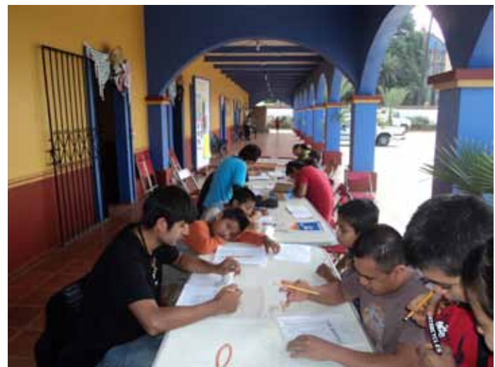
▲ Comunidad de Zagache, Oaxaca | © Fototeca CNCPC-INAH, 2012