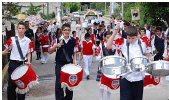
▲ Procesión en Buenavista de Cuéllar, Guerrero

A partir de ahora esperamos las aportaciones, críticas, matizaciones, añadidos o contrapropuestas que puedan surgir de la discusión sobre la metodología teórica que aquí se plantea.