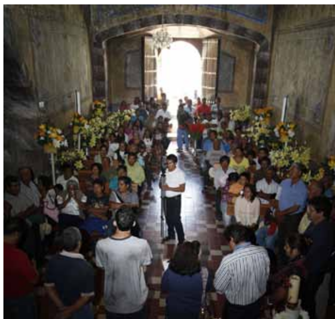
▲ Comunidad de Acambay, Hidalgo

Perfiles implicados y tiempo estimado máximo de la actividad: Sociólogo. De 1 a 5 días.