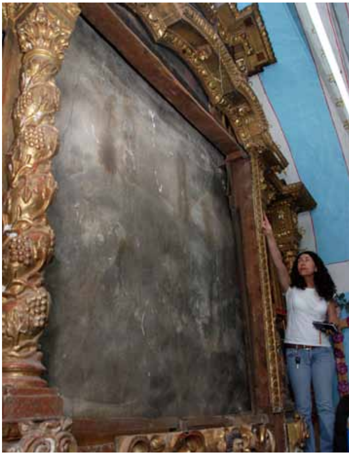
▲ Evaluación de obra en el templo de la Purísima Concepción en Izúcar Matamoros, Puebla