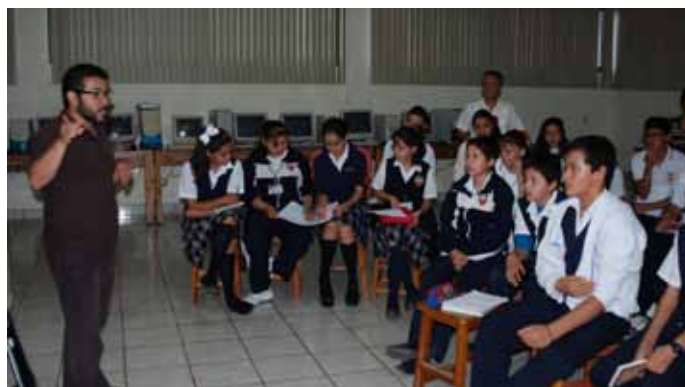
▲ Comunidad de Buenavista de Cuéllar, Guerrero