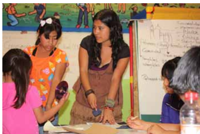
▲ Talleres de valoración en Ozumba de Alzate, Estado de México