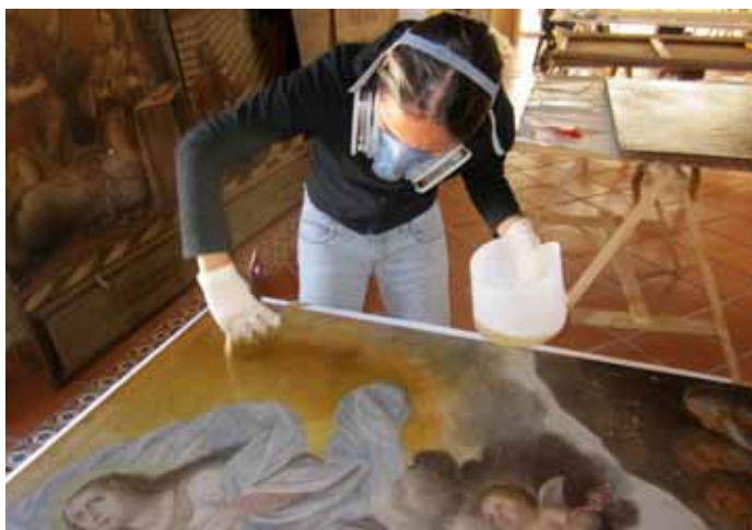
▼ Restauración de obra del templo de Santa Clara de Atlixco, Puebla