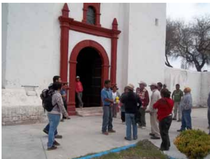
▼ Acambay, Hidalgo

De acuerdo con el tipo de proyecto y el lugar en el que se realiza la restauración existen varias situaciones posibles: