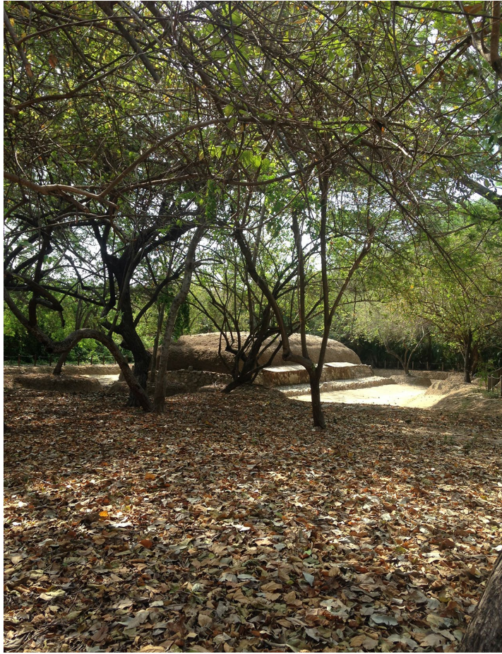
Figura 3. Pirámide de la serpiente. Vista desde el sendero.

El Parque Eco-arqueológico Copalita es un destino turístico donde se puede apreciar el cumplimiento de los parámetros de la UNESCO, misma que refiere: “el objetivo es evaluar los esfuerzos acometidos por las autoridades públicas y sus resultados, en relación con el establecimiento y la aplicación de normas, políticas, mecanismos concretos y medidas para la conservación, la salvaguardia, la gestión, la transmisión y la valorización del patrimonio a nivel nacional” (UNESCO, 2014: 132). Así, el parque para los visitantes locales y extranjeros es un paseo y un espacio recreativo, que favorece al resguardo patrimonial. Es un proyecto sustentable en el que se aprovecha un recurso ya existente y con el que se favorece a la economía local, al incentivar la creación de empleos temporales y permanentes. Huatulco tiene una oferta turística diversa, y el Parque Eco-arqueológico de Copalita ocupa el primer lugar respecto al turismo de cultural por sus características, su ordenamiento, planificación interna, la accesibilidad y la inserción en el mercado turístico (Sectur, 2015: 186).