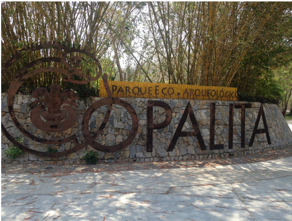
Figura 2. Entrada al Parque Eco-arqueológico Copalita.