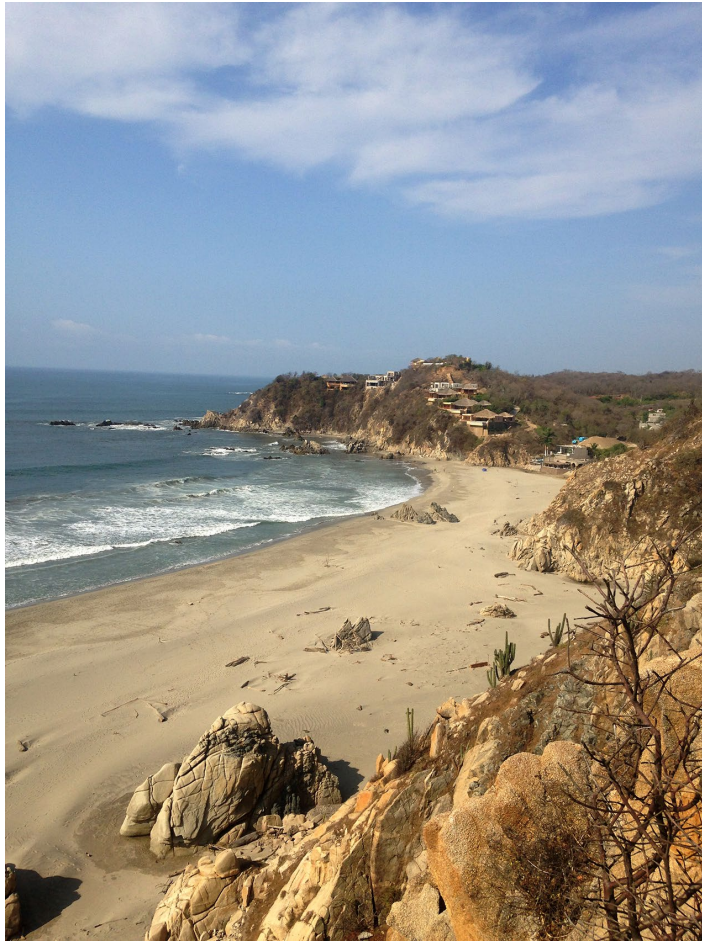
Figura 4. Playa Bocana del río Copalita. Vista desde el mirador dentro de Parque Eco-arqueológico Copalita. Imagen: ©Kharla García Vargas, 2018.

El Fondo Nacional del Fomento al Turismo (Fonatur) planificó la reconstrucción del sitio de Copalita dejando al final la restauración de los vestigios arqueológicos. Desde un inicio planearon preservar el ecosistema, de tal manera que cualquier intervención al lugar no afectara su flora y fauna, por eso contaron con la asesoría de biólogos y del INAH. Este proyecto nos recuerda las palabras de una restauradora: “el trabajo continuado logrará llenar el vacío que ha existido en cuanto a la difusión de la restauración, y permitirá reafirmar la presencia social de la especialidad e insistir en el carácter que tuvo el Instituto en su origen, originalmente creado con la premisa de tener como primera función la conservación el patrimonio cultural” (Noval: 1).