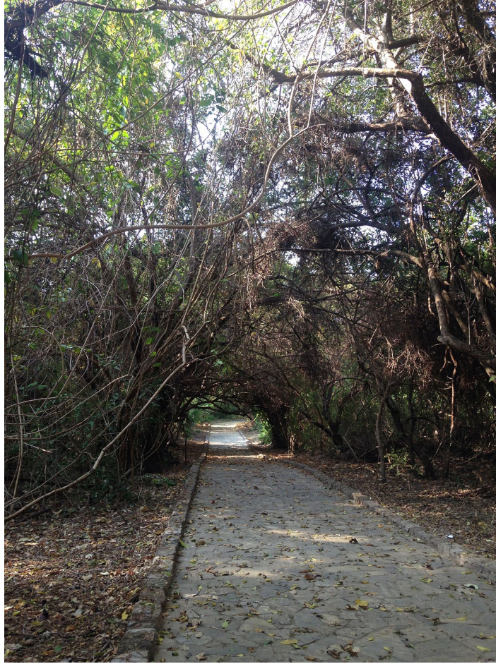
Figura 5. Uno de los Senderos del parque Eco-arqueológico Copalita. Imagen: ©Kharla García Vargas, 2018.

Además, la fusión entre lo ecológico y lo cultural, quizá, genera un puente atractivo para las nuevas generaciones, que buscan la cercanía a la cultura y esperan algo más aplicable a su vida cotidiana, por ejemplo experiencias sensoriales, caminatas y las facilidades para ingresar y mirar impactantes paisajes de la naturaleza (Figura 5).