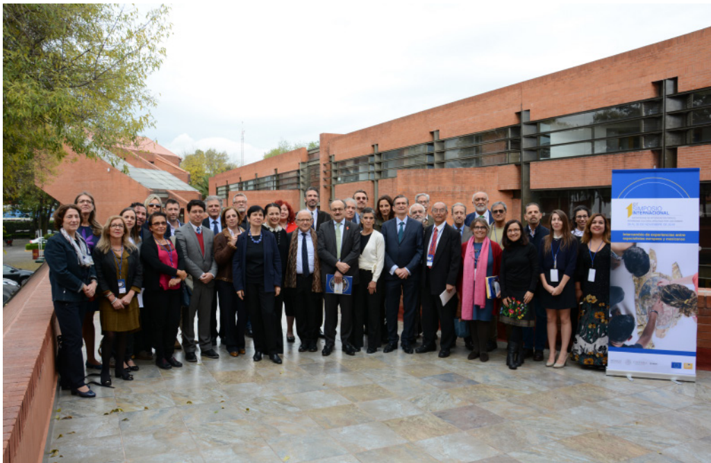
Grupo de participantes en el Simposio.