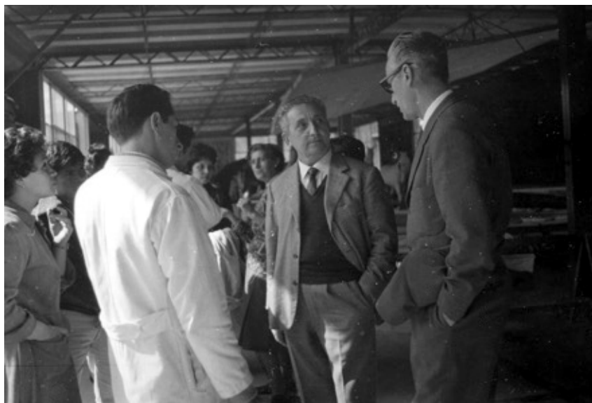
Figura 4. Convento de Churubusco. Taller de restauración.

Hablando específicamente del caso mexicano, si bien, ya existía un interés propio por este país expresado en políticas culturales enfocadas en la conservación del patrimonio, la vinculación de la UNESCO con México permitió encaminar y consolidar la profesionalización y la enseñanza de la conservación en el contexto mexicano y en América Latina. 16