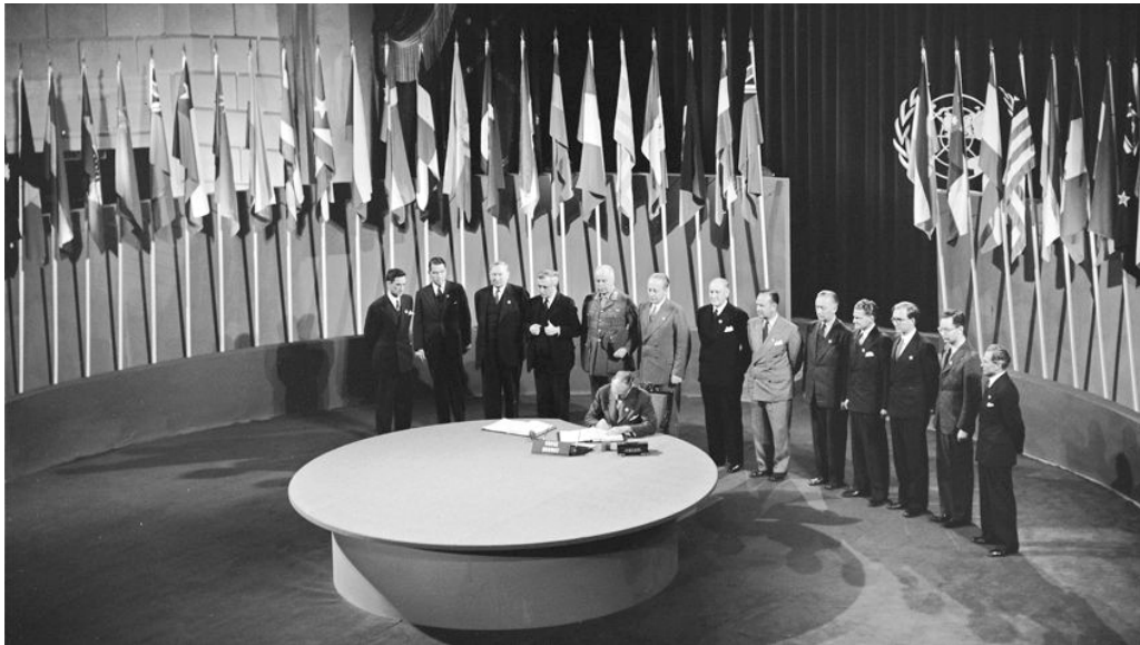
Figura 2. Fundación de la ONU. Conferencia de San Francisco.

Ciencia y la Cultura (UNESCO). 3 Tanto la ONU 4 como la UNESCO 5 en sus cartas y constituciones de origen expresan el compromiso directo con la búsqueda y mantenimiento de la paz entre naciones. Ése es el fin último y máximo de estas organizaciones. En un segundo lugar se buscó fortalecer los lazos entre países. En este punto destacan las labores de la UNESCO pues la manera para alcanzar el fin es mediante el desarrollo humano en las áreas de la educación, ciencia y cultura. Un tema interesante que sobresale en ambos textos es la cooperación internacional, 6 acción de fundamental importancia en las labores que posteriormente desarrollarían ambas instituciones.