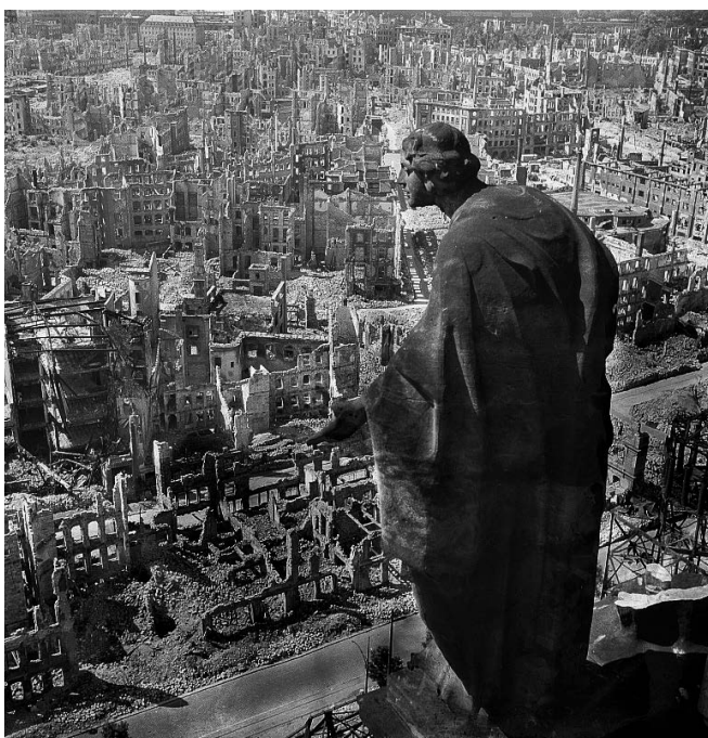
Figura 1. Ciudad de Dresden, Alemania, después de la Segunda Guerra Mundial. Imagen: ©Deutsche Fotothek, 1945.

Ambas guerras destruyeron ciudades enteras y con ellas, se dañó innumerable cantidad de patrimonio cultural.