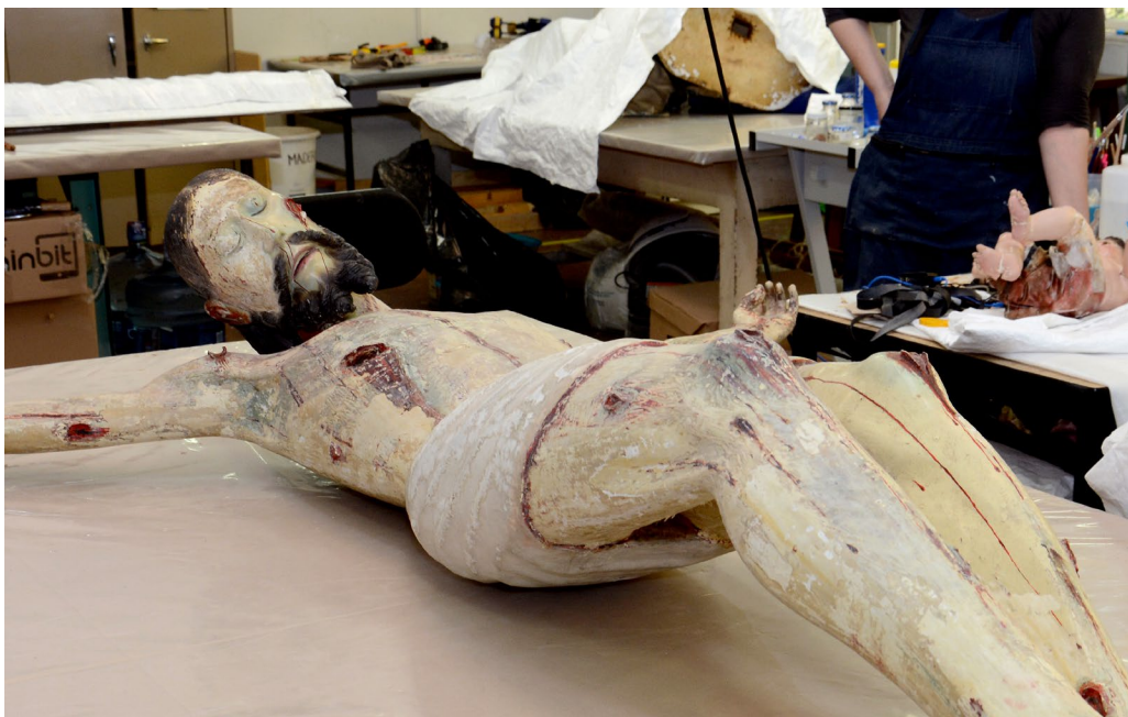
Cristo Divino Redentor.

La escultura y su cruz fueron sometidas a una limpieza con materiales, herramientas y técnicas inadecuados que fueron aplicados por personal no especializado, esto provocó daños graves e irreversibles en ambos bienes culturales.