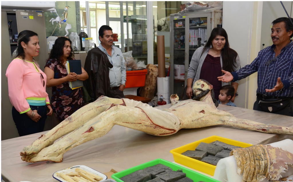
Cristo Divino Redentor en el taller de Escultura de la CNCPC.