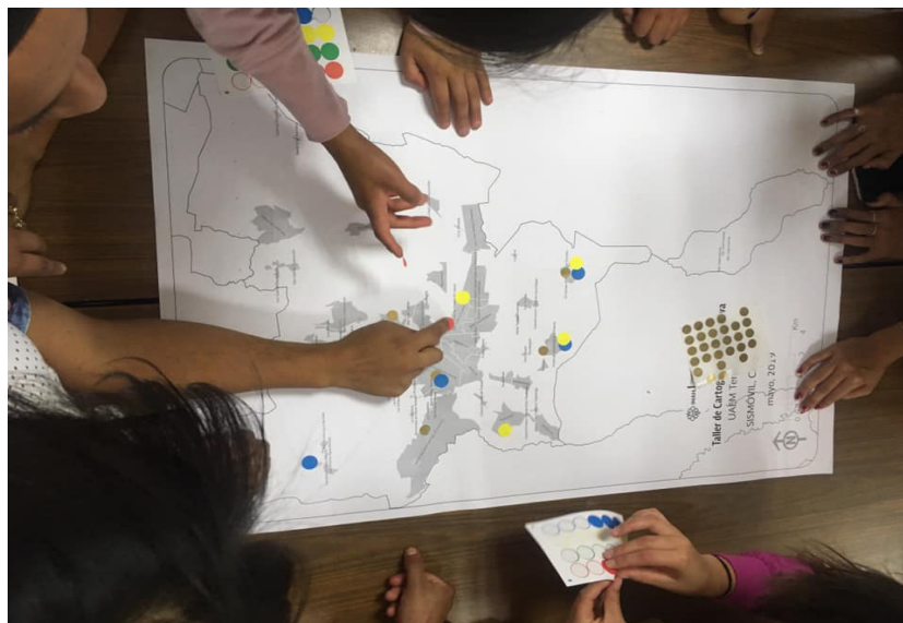
Figura 8. Cartografía social. Imagen: Galilea Trejo Cervantes ©CINAH Estado de México, 2019.

Asimismo, se imparte el taller de “Cartografía Participativa”, en el cual, mediante técnicas de mediación para la identificación de los “comunes” y con apoyo de un mapa, los ciudadanos en colectivo identifican los lugares de memoria que construyen su identidad local y que son susceptibles de ser valorados e identificados como patrimonio cultural.