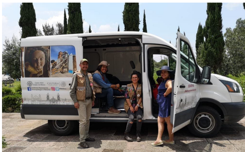
Figura 11. Sismóvil en Ecatepec.

La atención al patrimonio en las comunidades afectadas por el #S19, no sólo depende de profesionales especializados en la restauración, sino también de un trabajo interdisciplinario que dote de seguridad a las comunidades sobre la preservación de las costumbres.