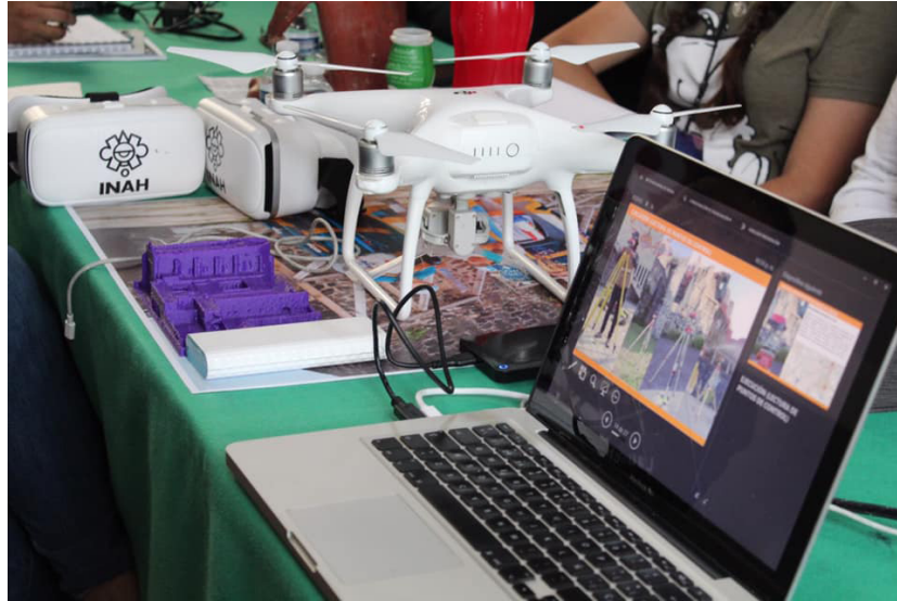
Figura 7. Nuevas tecnologías y patrimonio.

El “Pasado en tus Manos”, impartido por el arquitecto Lino Lozano Pérez: en el taller se explican, a través de impresiones 3D, las características constructivas de algunos monumentos históricos, desarrollando principalmente el sentido del tacto. Con esta actividad se abordan temas de inclusión, empatía, arquitectura y tecnología.