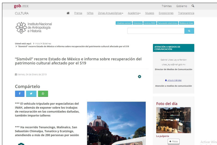
Figura 3. Boletín.

Con esta primera actividad, el INAH Estado de México, a través de gestores interculturales: antropólogos, arqueólogos, arquitectos, artistas digitales, restauradores y especialistas en tecnologías, se han dado a la tarea de recorrer en once meses, 24 de los 74 municipios afectados por los sismos de septiembre de 2017; ha impartido más de 80 talleres y compartido e intercambiado conocimientos con cerca de 2 000 personas, consolidado procesos participativos e interculturales en torno a los usos del patrimonio cultural.