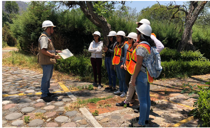
Figura 9. Sismovil Tenancingo.