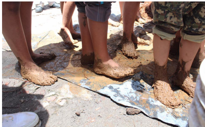
Figura 10. Taller de adobes, Malinalco.

A la par, se han emprendido talleres acerca del uso de la cal y la fabricación de adobes; mediante éstos se resalta entre las comunidades la importancia del rescate y reconocimiento de la arquitectura vernácula y el uso de materiales de fábrica en la historia de su comunidad. Además, con el apoyo de la Secretaría de Cultural del Estado, se fomenta la lectura a través de su programa de cuentacuentos.