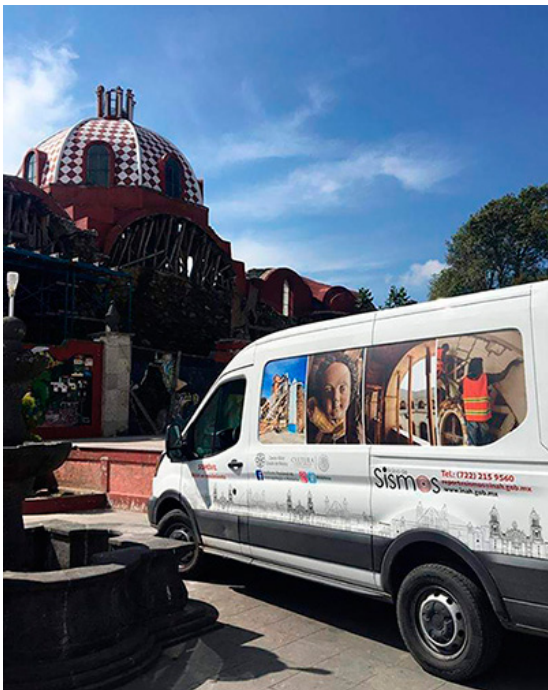
Figura 2. Sismóvil en Ecatzingo, Estado de México.

De tal forma que INAH en Movimiento se lleva a cabo a través de su “sismóvil”, que es una camioneta rotulada con la imagen de la Oficina de Sismos creada por el Instituto, a través de la cual también se traslada al personal con el mobiliario y los materiales necesarios para emprender actividades itinerantes de educación patrimonial, para la difusión y divulgación de la protección del patrimonio cultural.