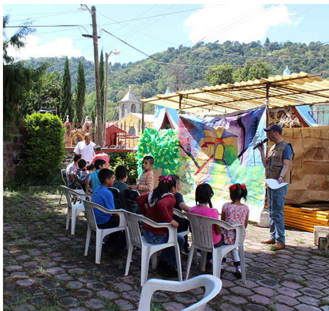
Figuras 5 y 6. Sismóvil en San Simonito.