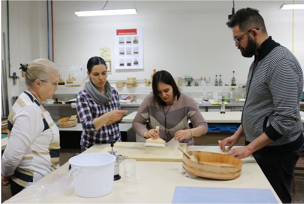
Figura 2. Participantes en el curso del 2015.

Con el fin de generar un contenido adecuado a las necesidades de los asistentes, se desarrolló una encuesta cuyas respuestas posibilitarán hacer un sondeo de sus intereses. Se utilizó una herramienta digital que hace posible generar un formato y enviarlo a cada destinatario vía correo electrónico, además de que facilita la organización de los resultados a partir de las respuestas. Una vez que termine el periodo de recolección de datos, se analizará la información para seleccionar los temas y organizar las mesas de trabajo del seminario.