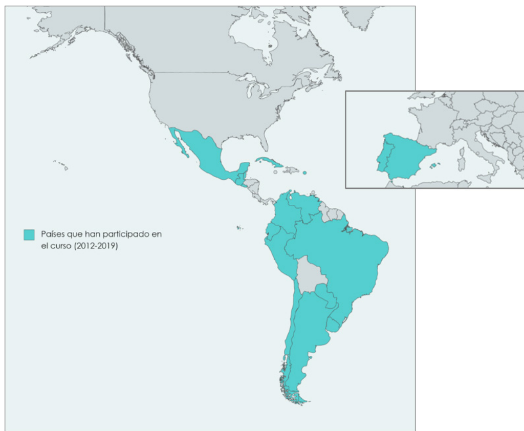
Figura 1. Mapa de los países que han participado en el curso.

Hasta ahora, se han llevado a cabo siete emisiones del curso, a las que han asistido 70 alumnos de 17 países. En el 2020 estaba planeado continuar con la octava emisión y se iniciaron las gestiones para su organización; sin embargo, a finales de marzo, la pandemia de COVID-19 y las medidas de sanidad impuestas por la Secretaría de Salud obligaron a modificar las actividades laborales.