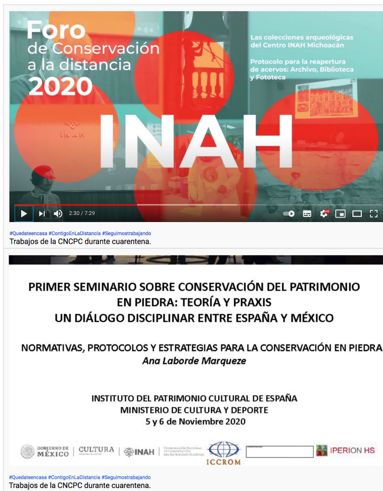
Figura 3. Trabajos de la CNCPC durante la cuarentena. Canal Youtube CNCPC Conservación México.

También existen encuentros con pares internacionales, que en otros momentos han colaborado con la CNCPC, para organizar congresos especializados en conservación, ya sea porque han venido a México o porque algunos de los restauradores nacionales han acudido a dar ponencias a Europa. Tal es el caso de un evento programado para noviembre de este año con el Instituto del Patrimonio Cultural de España, a través del programa para Latinoamérica (LATAM) del ICCROM, será un simposio con video reuniones, detalló Castro Barrera, en el que se presentarán diferentes ponentes.