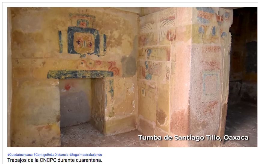
Figura 4. Trabajos de la CNCPC durante la cuarentena. Canal Youtube CNCPC Conservación México.

“Como ven nuestro trabajo sigue siendo arduo, estamos contentos de poderlo hacer dadas las circunstancias actuales. En un futuro las plataformas de las cuales hemos echado mano para hacer video reuniones, nos seguirán siendo de utilidad para estar en contacto con los estados y los equipos de trabajo a nivel internacional, [esto] le permitirá al INAH tener ciertos ahorros y potenciar estas plataformas”, concluyó Castro Barrera.