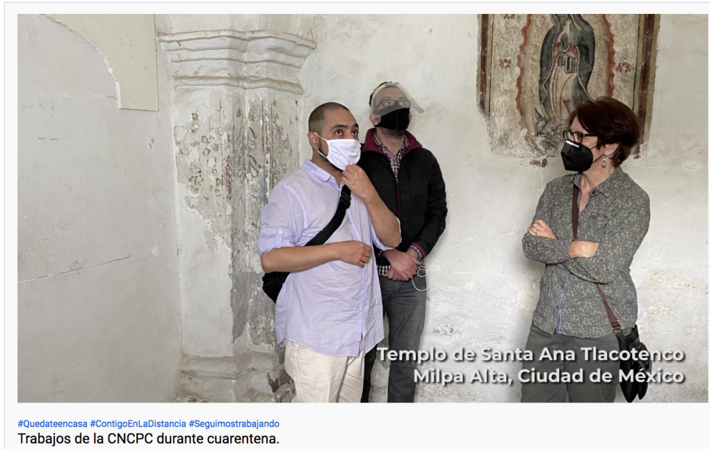
Figura 1. Trabajos de la CNCPC durante la cuarentena. Canal YouTube CNCPC Conservación México.