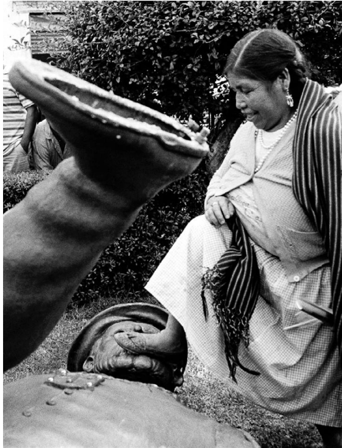
Figura 5. Estatua derribada del virrey Mendoza, autor desconocido, Michoacán, 12 de octubre de 1992.

Más allá de los dilemas materiales y su solución técnica, el caso de las intervenciones en la columna la Independencia —y cualquier otro caso que involucre al patrimonio como medio de expresión social y de construcción de memoria— nos obliga también a preguntarnos el papel de las personas profesionales de la conservación-restauración acerca de las decisiones sobre su intervención o no intervención. Al respecto, Durant (2020) afirma que más allá de un cuestionamiento sobre cómo construimos decisiones o hacemos nuestro trabajo, se trata de preguntarnos si las decisiones reflejan a la totalidad de nuestra sociedad, bajo la consideración de las contribuciones de los diversos grupos a las herencias compartidas, o si nuestro trabajo, colecciones e instituciones toman decisiones que fortalecen jerarquías sociales de clase, raza y género.