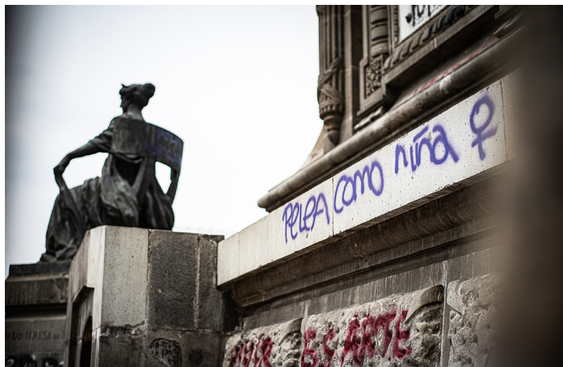
Figura 6. Una de las intervenciones realizada por mujeres el 16 de agosto de 2019, en la cara poniente del Monumento a la Independencia.

Está chingón que ustedes hayan salido a decir eso... porque normalmente en México, ser profesional es estar institucionalizado... por eso siempre criminalizan. Y que ustedes salgan a decir: a ver weyes, dejen de armarla de pedo por algo que sabemos que se soluciona y pongan atención al verdadero problema, es algo muy bueno.