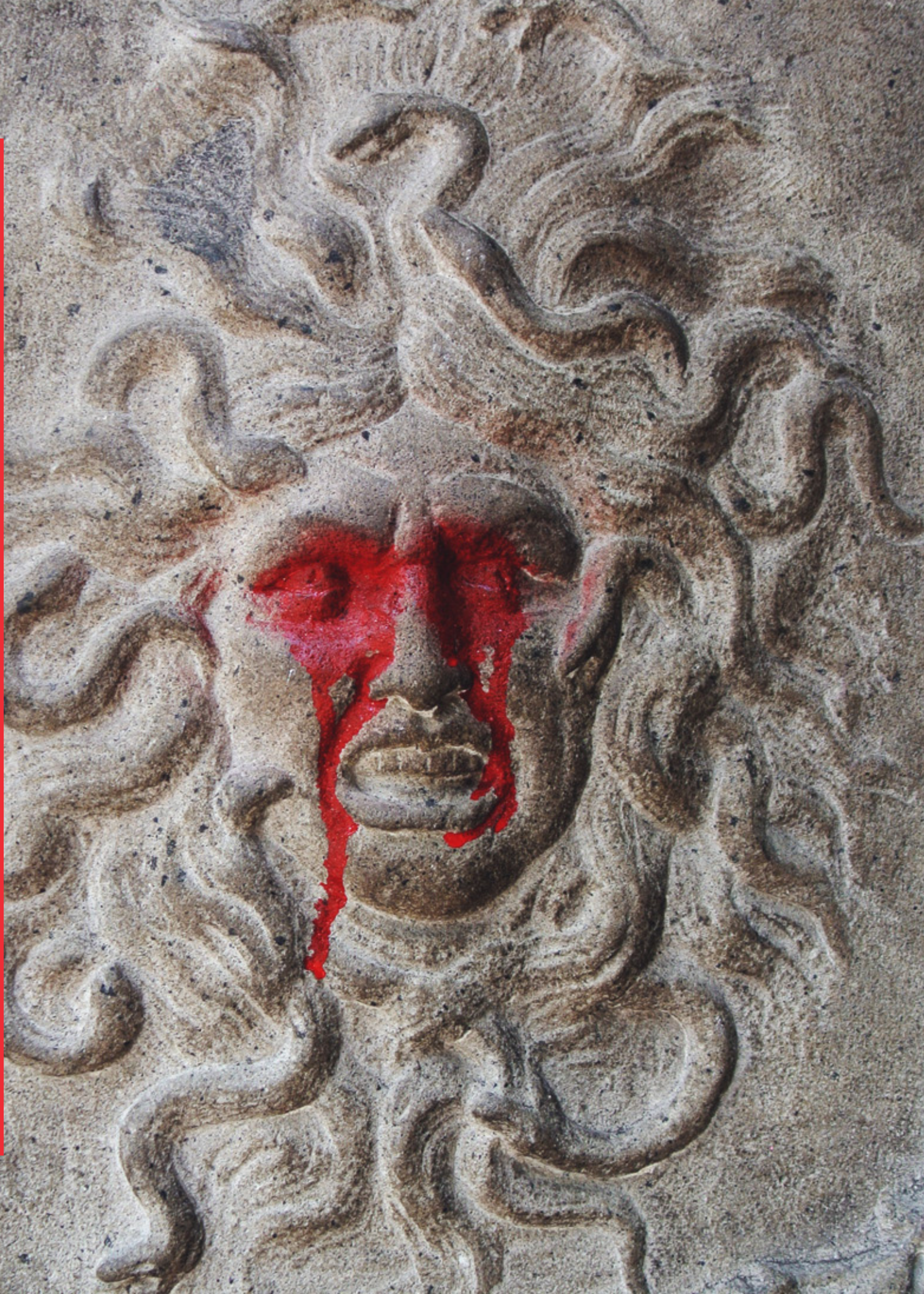
Imagen: Restauración con glitter, 2019.