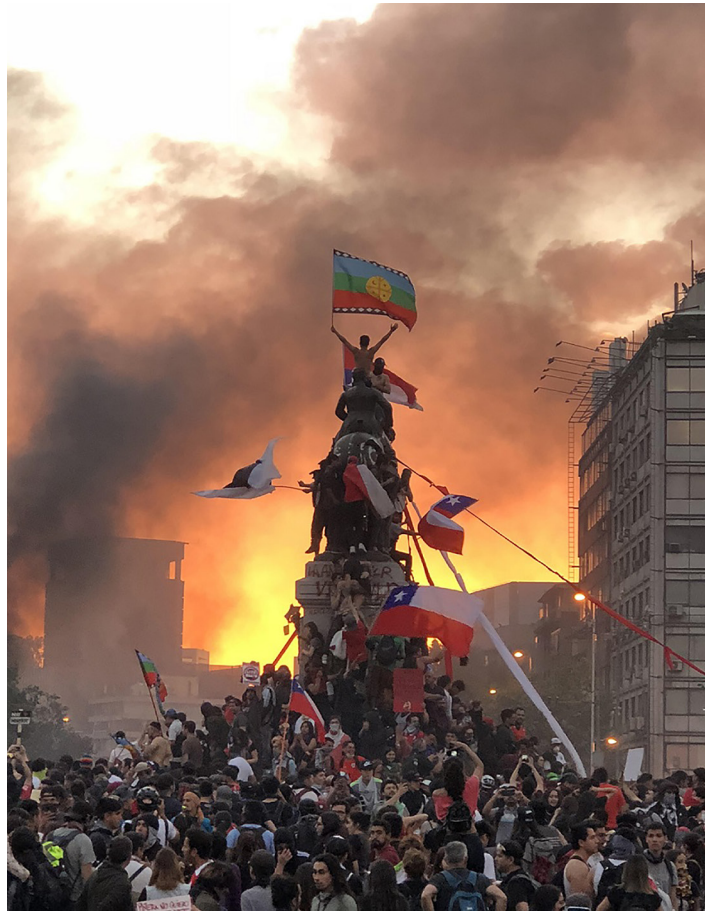
Figura 3. Plaza de la Dignidad, Santiago de Chile, 25 de octubre.