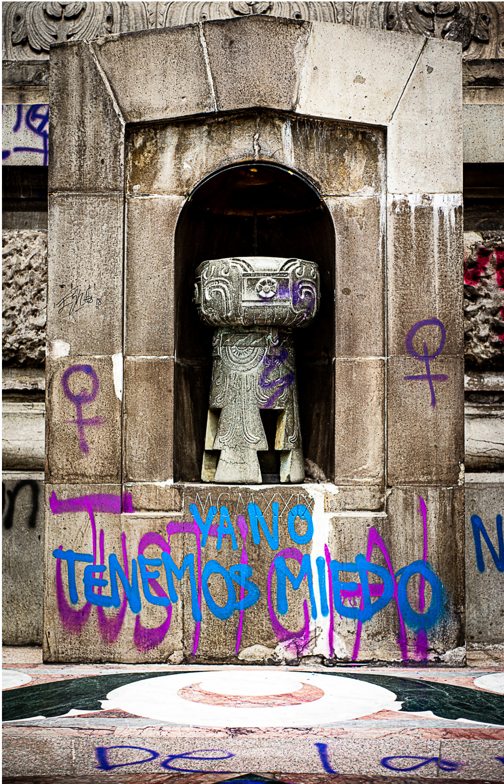
Figura 7. Una de las intervenciones realizada por mujeres el 16 de agosto de 2019, en la cara norte del Monumento a la Independencia.