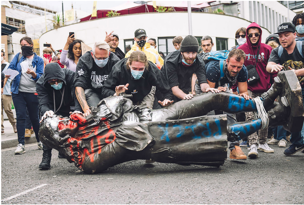
Figura 4. Manifestantes ruedan la estatua derribada del esclavista Colston hacia el puerto de Bristol.

Sin embargo, hay que ser cuidadosos cuando analizamos esas acciones ya que pueden representar la apropiación del movimiento por parte del Estado, volviéndolo un mero acto simbólico que no atiende a los problemas de fondo. Ejemplo de ello es la reciente remoción de las estatuas de Colón y los frailes de La Rábida de la avenida Paseo de la Reforma en la Ciudad de México. Bajo el argumento de su mantenimiento o restauración, se retiraron dos días antes de la fecha que durante siglos se ha considerado como el “descubrimiento de América”. Desde hace muchos años, cada 12 de octubre, la estatua de Colón ha sido “rayada” sin mayor repercusión en cuanto a la opinión pública o su conservación. Sin embargo, ese año existía una convocatoria en redes sociales para derribarla, razón por la que –presumimos– el Gobierno de la Ciudad de México decidió retirarla. Posteriormente, la jefa de Gobierno, Claudia Sheinbaum, declaró la necesidad de evaluar si la estatua regresa a su sitio. Ello resulta inútil en un contexto en el que los convocantes al derribo pertenecen a la clase hegemónica, y en el que, como el que nos recuerda Gaspar Rivera, indígena Ta Savi: