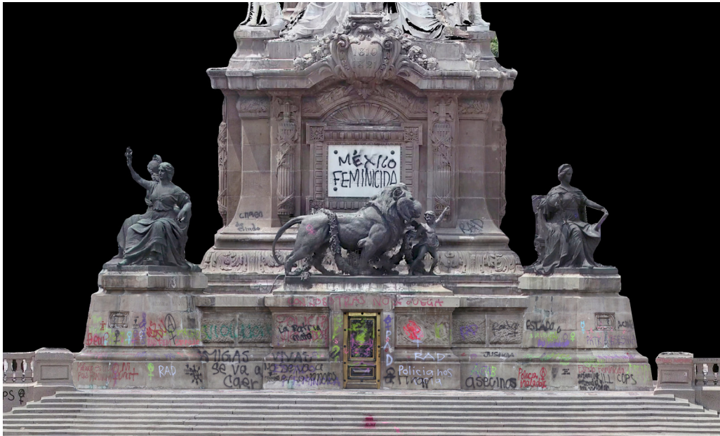
Figura 1. Vista frontal, cara oriente, del Monumento a la Independencia, intervenido por mujeres el 16 de agosto de 2019.

Dejar de enseñar a los hijos el idioma propio para evitarles discriminación otorga la posibilidad de que al usar la lengua de la mayoría se pueda acceder a ella, manifestar la diferencia, exigir reconocimiento; señalar discriminaciones y maltratos causa insultos, como el que se leía entre los comentarios de una publicación dentro de la red social Facebook sobre la intervención social de la estatua de Isabel la Católica, en Bolivia, y que fue borrada unos días después de publicada: “subhumanos y acémilas, basuras y lacras por las que América Latina no va a progresar. Estancados en su pinche ‘descolonización’, no hay visión de futuro”. Un futuro y un progreso que, desde quien emite opiniones como esa, sólo se pueden dar en la desaparición de las diferencias tras quienes ya ostentan el poder.