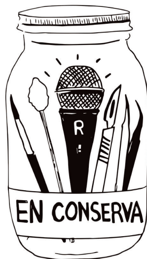
Figura 5. En Conserva Podcast .

En general, la estructura de nuestros episodios es bastante flexible y las secciones dependerán del tema, de lo que queremos decir, y de cómo lo queremos expresar. Con todo, hay algunas cosas que no cambian: siempre encontrarás las cortinillas de entrada y salida, donde se escucha el nombre del podcast, junto con un sonido de frasco abriéndose o cerrándose; ello hace alusión a un juego de palabras que también se denota en nuestro logo, un frasco de conservas que adentro tiene herramientas indispensables de las/los restauradoras/es y un micrófono, herramienta fundamental para grabar (figura 5). También, siempre podrás escuchar una introducción explicándote de qué va lo que escucharás en los próximos minutos; por lo general, esa parte tiene una gran carga sonora (con la intención de llamar tu atención y de que te quedes acompañándonos).