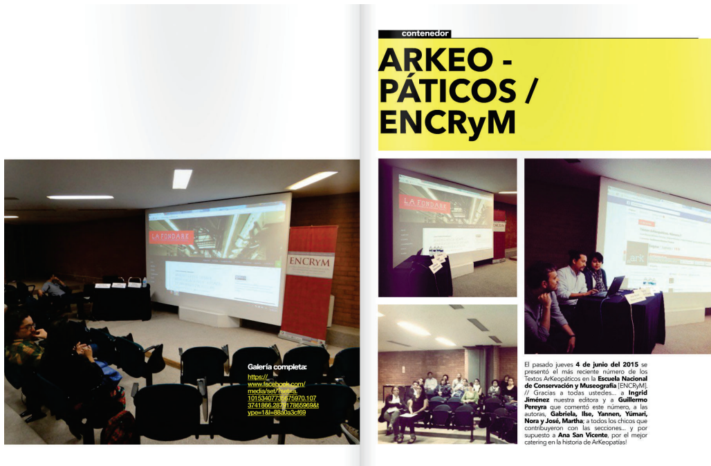
Figura 5. Páginas (spread) de la sección Contenedor para el número 8 de la revista ARK_MAGAZINE. Presentación de la revista en la ENCRyM. Fotografía y diseño editorial: ©Juan Tonchez, 2022.