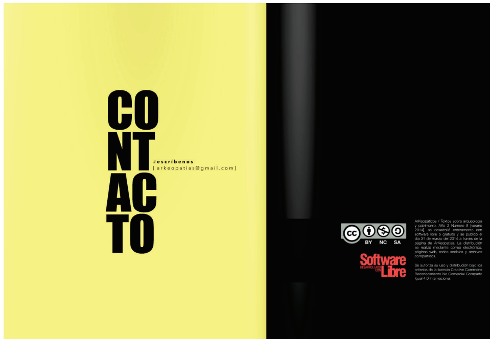
Figura 9. Páginas ( spread ) de la sección Contacto para el número 8 de la revista ARK_MAGAZINE . Diseño editorial: ©Juan Tonchez, 2022.

Encuentro Internacional de Estudios Críticos sobre Patrimonio \ SIN GAFETES \ México 2020 y 2021, respectivamente, donde participaron vía remota y con motivo del décimo aniversario de ARK_, en el contexto de la pandemia global, más de 100 ponentes nacionales e internacionales con 70 trabajos presentados.