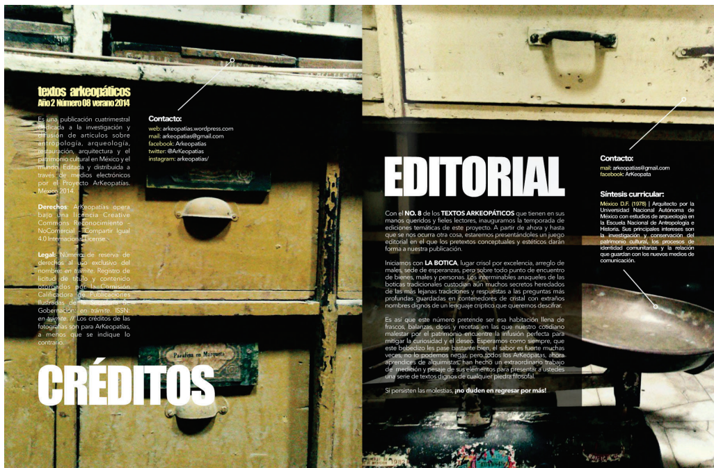
Figura 2. Páginas (spread) de créditos y editorial del número 8 de la revista ARK_MAGAZINE.

constante nuevas formas de comunicación, siempre con un alto contenido de material gráfico y un cuidado diseño editorial, que incluye, por ejemplo, secciones interactivas, donde los lectores pueden ampliar su experiencia con videos, fotografías, sitios web, etcétera, a través hipervínculos hacia las demás plataformas y redes sociales de ARK_.