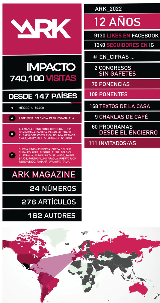
Figura 10. Numeralia del proyecto ARK _ al momento de su décimo aniversario (2020).

ARK_MAGAZINE se planteó desde el principio el objetivo de demostrar que los proyectos independientes son viables y posibles; que no es necesario tener el respaldo institucional, académico o empresarial para concretar un proyecto exitoso; que no es necesario tampoco obtener una beca o algún otro financiamiento o patrocinio para arrancar un sueño; que las posibilidades de comunicación que vislumbré hace más de 10 años abrieron por primera vez la oportunidad de deconstruir las relaciones de poder inherentes al patrimonio, la conservación y los estudios sobre ello, asumiendo la responsabilidad de cambiar el status quo a través del pensamiento crítico y la acción dirigida. ARK _ se ha mantenido todos estos años fiel a sus principios y el tiempo nos ha dado la razón; las voces que hablan sobre el debate patrimonial, al interior pero, sobre todo, por fuera del gremio y las instituciones, son ahora incontenibles. Me gusta pensar que sembré una semilla para eso.