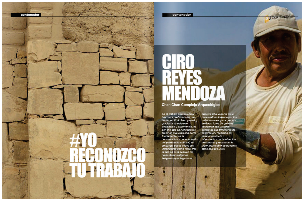
Figura 6. Páginas (spread) de la sección #YoReconozcoTuTrabajo para el número 8 de la revista ARK_MAGAZINE. Diseño editorial: ©Juan Tonchez, 2022.

Por fortuna, en más de una ocasión, quienes en un inicio vieron como un obstáculo para publicar la falta de certificaciones, hoy en día están conscientes y convencidos de las potencialidades de las redes y el alcance que la revista tiene a nivel internacional. Estoy convencido que el éxito del proyecto editorial radica precisamente en ese espíritu de apertura, que anima y une a quienes tienen algo que expresar y aquellos dispuestos a leerlo. Por el mismo motivo, los lineamientos editoriales que se piden para la entrega de las contribuciones son sólo cinco puntos, que tienen el único objetivo de facilitar la edición y maquetación del número, así como identificar de manera correcta la identidad e intención reflexiva del autor. Se trata de que no se conviertan en una serie interminable de requisitos burocráticos que desincentiven la participación o sean un límite para la inclusión de posturas diversas o disidentes. El proceso es casi tan simple como enviar un correo electrónico con el asunto correspondiente y los archivos de texto e imágenes adjuntos.