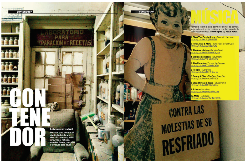
Figura 4. Páginas (spread) de la sección "Música" para el número 8 de la revista ARK_MAGAZINE. Fotografía y diseño editorial: ©Juan Tonchez, 2022.