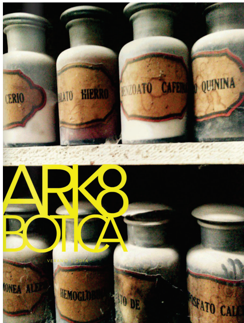
Figura 1. Portada del número 8 de la revista ARK_MAGAZINE.