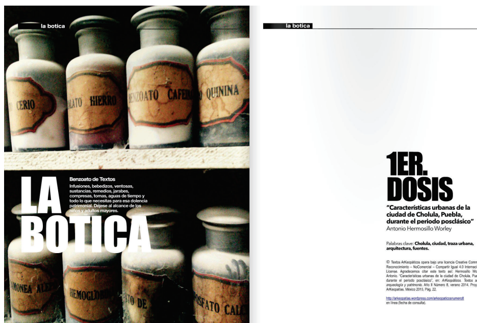
Figura 7. Páginas (spread) de la sección La Botica (Dossier) para el número 8 de la revista ARK_MAGAZINE . Fotografía y diseño editorial: ©Juan Tonchez, 2022.

como a veces se dice de un modo despectivo, una revista de divulgación o estudiantil. Por el contrario, el planteamiento central de la publicación es la generación de nuevos paradigmas patrimoniales, a partir del debate y la discusión, por lo que son comunes y no resultan incómodas las posturas contradictorias entre sí o con la misma línea editorial. De hecho, las posturas “institucionales”, celebrativas del aparato burocrático encargado de la conservación e investigación patrimonial, aunque nunca son censuradas o rechazadas, no son el tipo de publicaciones a las que más me interesa dar cabida, sin embargo, son importantes para la confrontación de visiones sobre el patrimonio. Confío siempre en que los números que se editan con los valiosos aportes de todos los interesados en las temáticas planteadas, tienen una excelente acogida en la ya muy bien consolidada red y comunidad de lectores críticos, quienes hacen el análisis final de los textos, y que regresan sus reflexiones por medio de nuevos artículos que, a su vez, se someten también a debate en un proceso que no termina con la publicación.