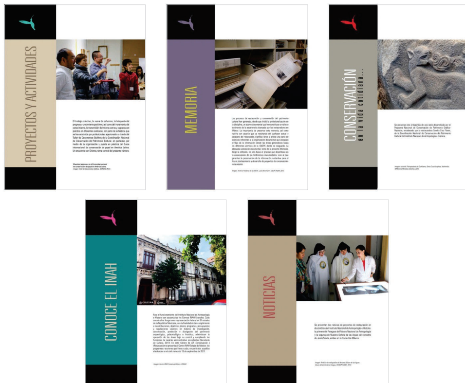
Figura 2. Presentación de secciones en diferentes números de CR. Conservación y Restauración .