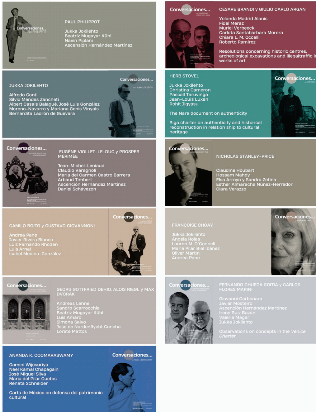
Figura 5. Conversaciones... , números del 1 al 11. Imagen: Magdalena Rojas Vences, ©CNCPC-INAH, 2022.