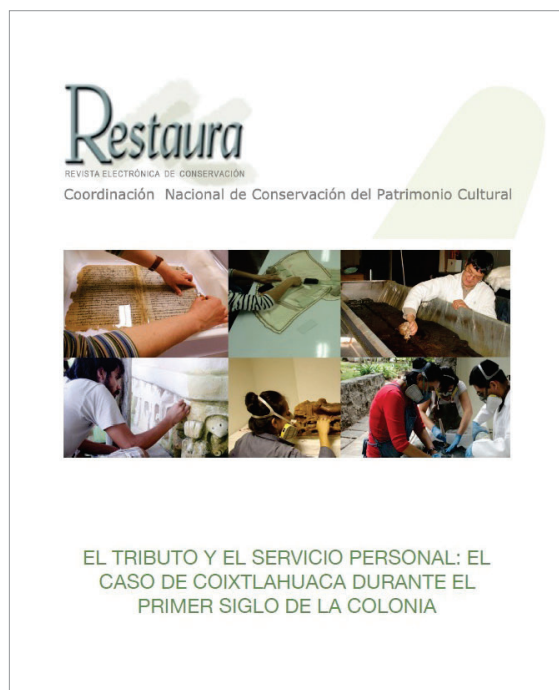
Figura 9. Restaura. Revista Electrónica de Conservación .

En el año 2006, cuando fungía como coordinadora nacional Luz de Lourdes Herbert y el centro de trabajo ya era conocido como la Coordinación Nacional de Conservación del Patrimonio Cultural, se publicó por primera vez la revista Restaura. Revista Electrónica de Conservación . Esa publicación, del mismo modo que el Correo del Restaurador , se concibió como digital para que la sustituyera al momento de dejar de publicarse. De esa revista, sólo se publicaron cinco números y cada uno de ellos era mucho menor en extensión, en comparación con su antecesora, debido a que se publicaba un artículo por número.