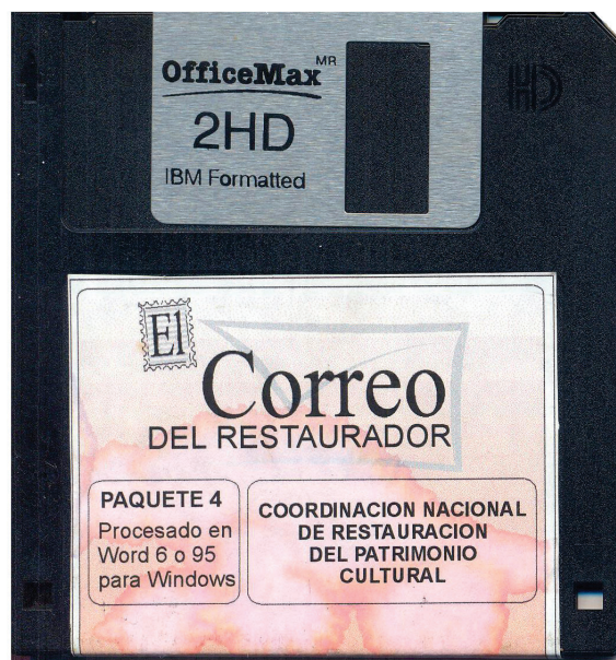
Figura 4. Disquete de El Correo del Restaurador . Imagen: Noé Moreno, ©CNCPC-INAH.

De periodicidad irregular y con número de páginas variable en su extensión, se publicaron en total 11 fascículos, de los cuales, cada uno de ellos trataba sobre un eje temático en particular; de esa forma fue que se habló sobre conservación de patrimonio religioso, material arqueológico, conservación patrimonial en diferentes contextos, patrimonio prehispánico y material cerámico. También se publicaron números especiales sobre educación social para la conservación, conservación en comunidades, siniestros (robo, sismos e incendios), conservación de retablos, patrimonio arqueológico y conservación integral de patrimonio. El hecho de ser una publicación digital y las características del formato en su extensión posibilitó que fueran muchas las colaboraciones recibidas. Por sólo mencionar a algunos autores, publicaron en ella: José Antonio López Palacios, Bertha Peña, Katia Perdigón, Françoise Hatchondo, Isabel Medina-González, Blanca Noval, Sandra Cruz, Elvira Pruneda, Alejandra Alonso, Juan Manuel Rocha, Berenice Valencia, Pablo Torres, Renata Schneider y muchos otros.