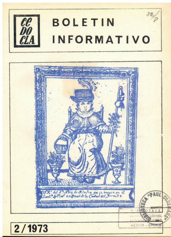
Figura 1. Boletín Informativo Cedocla, número 2, 1973.