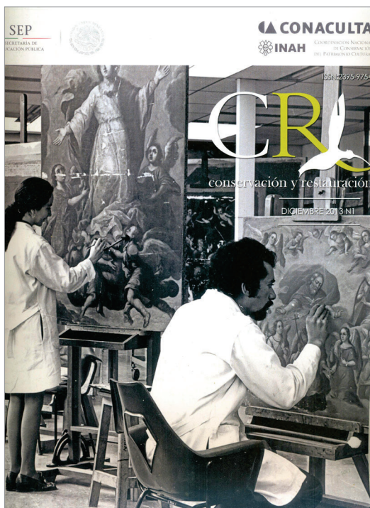
Figura 10. Boletín CR. Conservación y Restauración , número 1.

Desde el número doble 11 y 12, el diseño editorial ha sido efectuado de forma exclusiva por Marcela Mendoza. Con respecto a su formato, ha cambiado de manera radical tanto en su imagen como en la extensión de número de páginas, además de que se agregaron dos nuevas secciones Conservación en la vida cotidiana y Conoce al INAH. De todas las revistas que se han publicado en la CNCPC, la revista CR. Conservación y Restauración ha sido la que mayor estabilidad y continuidad ha tenido en comparación con sus antecesoras. Ha servido como escaparate para que diferentes especialistas e investigadores, internos y externos, den a conocer las labores desarrolladas en talleres y en campo. Desde 2013 se ha publicado de manera constante; una parte de las entregas están disponibles para consulta de manera física en la biblioteca y en su totalidad como recursos de acceso abierto en la página de las Revistas del INAH, en la Mediateca del INAH, así como en la sección de publicaciones del sitio web de la CNCPC: https://conservacion.inah.gob.mx/index.php/publicacionescncpc/ .