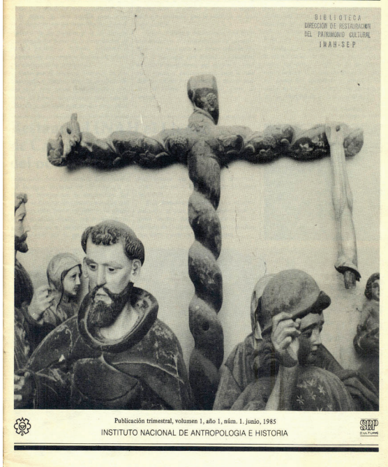
Figura 3. Restauración . Boletín de información y divulgación de la Dirección de Restauración del Patrimonio Cultural.

Boletín de información y divulgación de la Dirección de Restauración del Patrimonio Cultural