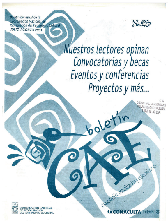
Figura 6. Boletín CAE. Capacitación, actualización y especialización.