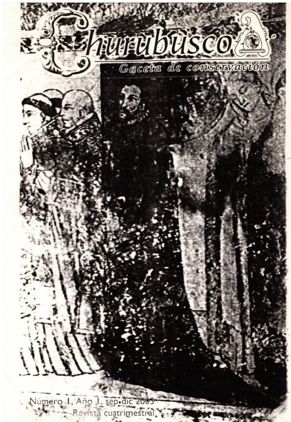
Figura 8. Churubusco. Gaceta de conservación .