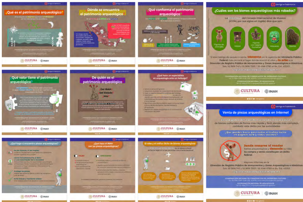
Figura 2. Postales relativas al patrimonio arqueológico y su tráfico ilícito.