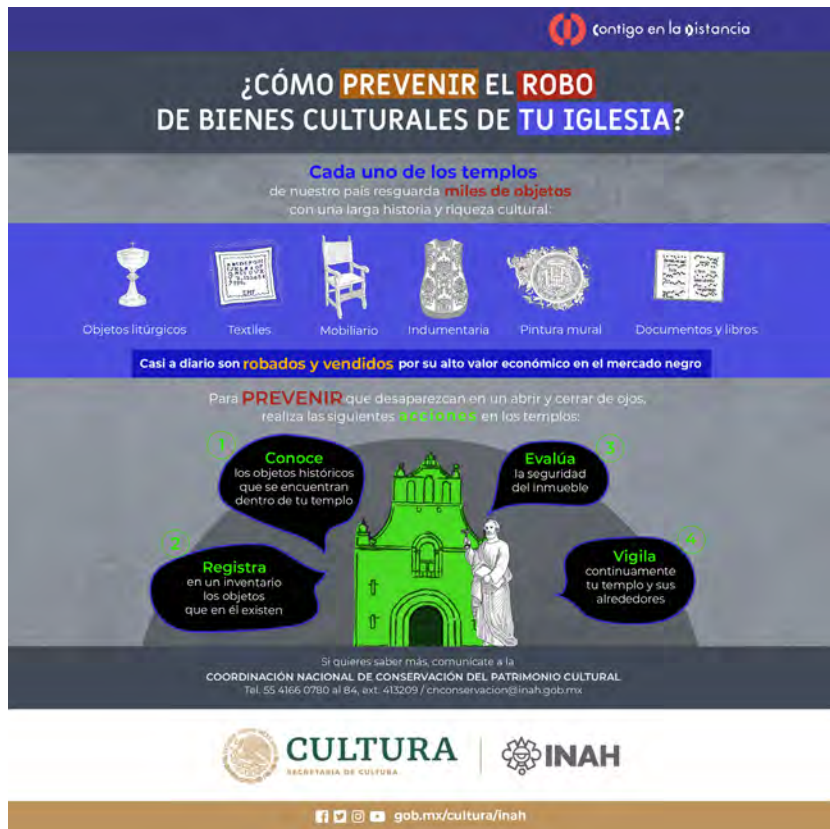
Figura 3. Póster para la prevención de robos en iglesia.