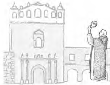
Figura 4. Índice del Manual de prevención de robo en recintos religiosos .