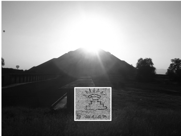
Figura 3. Fotografía histórica de la Pirámide del Sol en Teotihuacán, tomada desde el montículo central (altar sagrado al dios tutelar de Teotihuacán o Lararium ) de la plaza del sol el día 21 de febrero de 2018, a las 7:09 am. Donde se aprecia el orto solar con un alineamiento a la cúspide del monumento (sin ningún tipo de retoque). Existe una similitud con el glifo del códice Xólotl en la lámina 6 cuadrante 1c.

ser reconsiderada y recuperada, enfatizando el contacto y cercanía histórica que estos personajes tuvieron con las propias ruinas y su comprensión tanto de la lengua como de los conceptos nahuas. Ambos podrían estar dando una clave de lo que aquellas viejas ruinas representaban para el mundo indígena: la materialización de lo divino, el lugar en que historia y mito se fusionaban, en el instante en que el sol emergía detrás y al centro del edificio más prominente 27 (figura 3).