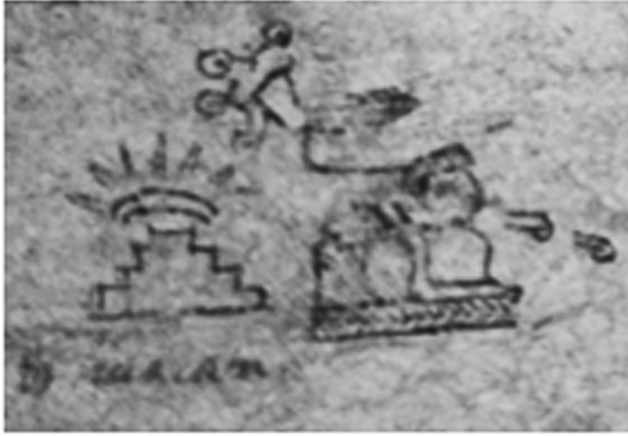
Figura 2. Elementos de la lámina 6, cuadrante 1c del Códice Xólotl , se observa un glifo glosado con la palabra en caracteres latinos Teo huacan .

Este glifo y el nombre actual de Teotihuacan no han variado a lo largo de los últimos cinco siglos, pues los elementos fundamentales de su composición permanecen: el (los) basamento (s) y la figura solar, como puede observarse en los códices Xólotl , Huamantla , Mazapa y en el estudio de Antonio Peñafiel [1900], este último, por cierto, es el glifo que identifica al municipio de Teotihuacan [Bando Municipal 2013; INAFED 1987].