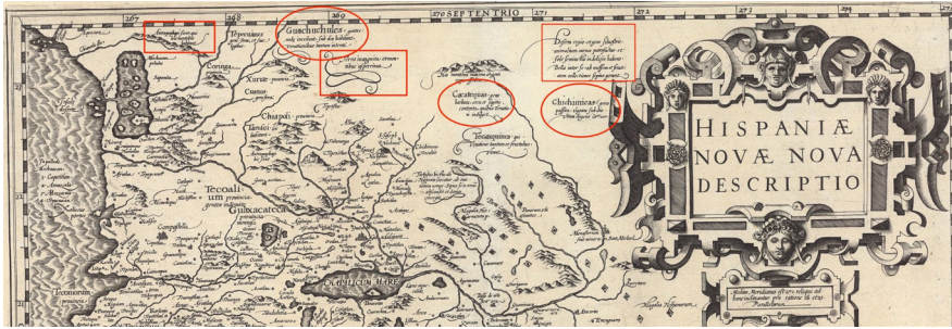
Figura 2. Sección del mapa de Hondius y Mercator donde se aprecian las referencias a los grupos chichimecas y su contexto ambiental.

Fuente: David Ramsey Map Collection. https://www.davidrumsey.com/luna/servlet/detail/RUMSEY~8~1~324437~90093644:Hispaniae-Novae-Nova-Descriptio-?sort=Pub_List_No_InitialSort%2CPub_Date%2CPub_List_No%2CSeries_No&qvq=q:Hispaniae%20Novae%20Nova%20Descriptio.;sort:Pub_List_No_InitialSort%2CPub_ . Consultado el 7 de junio de 2020.