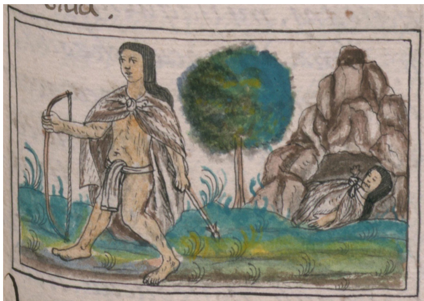
Figura. 5 Los chichimecas. Fuente: Library of Congress Bernardino de Sahagún, Códice Florentino , libro x: 123v. < https://www.wdl.org/es/item/10621/view/1/244/ >. Consultado el 12 de noviembre de 2020.

En el Atlas Maior de Blaeu de 1665 resalta la utilización del mapa de Ortelius Hispaniae Novae Nova Descriptio , elaborado algo más de 50 años antes, con mínimas modificaciones pero que mantiene las mismas referencias a los grupos nómadas del norte, a pesar de que ya para esas fechas se encontraban altamente mermadas, pero con núcleos que aún se resistían a la dominación al mostrar eventuales rebeliones (figura 6).