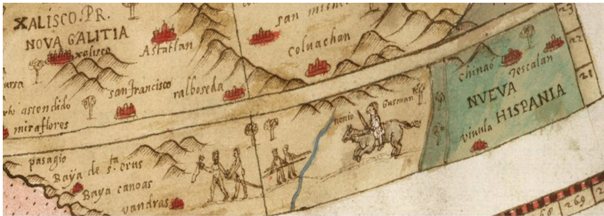
Figura 4. Detalle de la Tavola anterior, donde se representa a Nonio de Guzmán (Nuño de Guzmán) iniciando su expedición de Pánuco al occidente mexicano. Fuente: David Rumsey Map Collection. Consultado el 12 de junio de 2022.

Fuente: David Rumsey Map Collection. < https://www.davidrumsey.com/luna/servlet/detail/RUMSEY~8~1~303567~90074180:Tavola-X-Che-Ha-Sua-Superiore-La-Ta?qvq=q%3Apub_list_no%3D%2210130.000%22%3Bsort%3Apub_list_no%2Cseries_no%3Blc%3ARUMSEY%7E8%7E1&sort=pub_list_no%2Cseries_no&mi=11&trs=94 >. Consultado el 12 de junio de 2022.