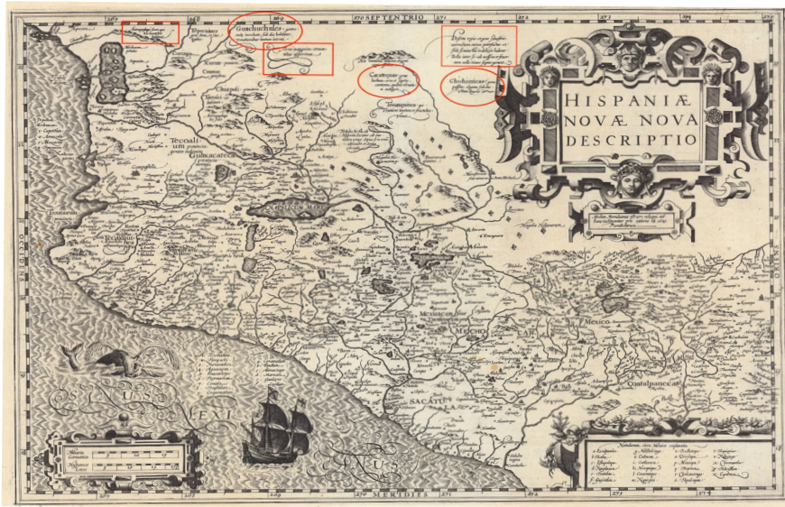
Figura 1. Abraham Ortelius (Hondius y Mercator 1607), Hispaniae Novae Sivae Magnae, Recens Et Vera Descriptio , Anueres.

En el bien conocido Orbis Terrarum de Abraham Ortelius, de la edición de 1579 en la lámina que corresponde al territorio del centro y norte de México, Hispanae Novae Sivae Magnae, Recens Et Vera Descriptio , publicado por Hondius y Mercator en 1607 (figuras 1 y 2), puede leerse cómo es el ambiente de aquellas tierras: hacia el noreste de México, esa “región desierta y pueblo silvestre, que se deleita con carnes putrefactas y semicocidas al sol. A menudo se hacen la guerra unos a otros por la cosecha y la recolección de frutos” ( deserta regio, et gens silvestris, animalium carnes putrefactas et sole semicocidas in delicijs habens. Bella inter se, ob messem et fructuum collectiones, sepius gerunt ), 4 la situación hacia el noroeste añade un elemento más a la descripción: “son antropófagos quienes habitan en estos montes” ( antrophagi sunt qui his montibus habitant ).