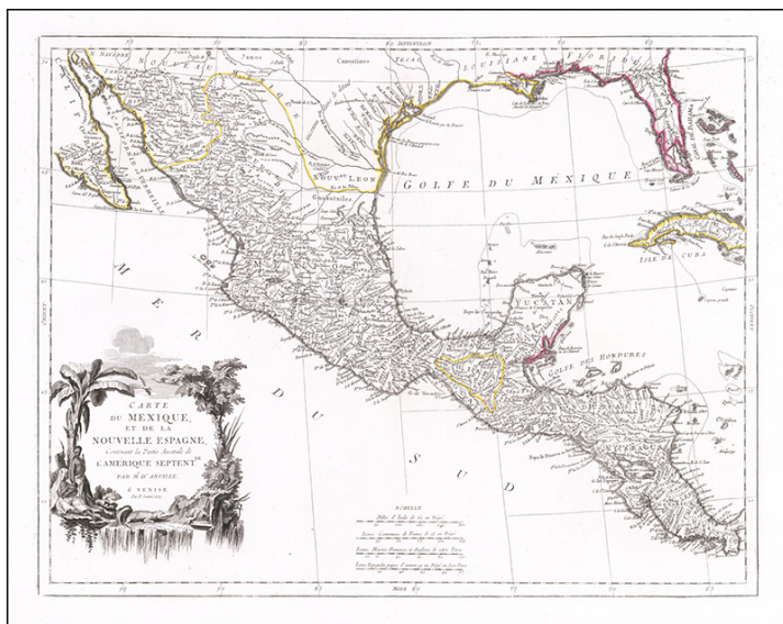
Figura 7. Carte du Mexique et de la Nouvelle Espagne , 1779, Paolo Santini, colección de Barry Lawrence Ruderman. < https://www.raremaps.com/gallery/detail/61020/carte-du-mexique-et-de-la-nouvelle-espagne-contenant-le-part-santini >. Consultado el 16 de marzo de 2020.

Con estos casos expuestos se quiere hacer énfasis en la permanencia de un núcleo amplio de rebelión y resistencia por parte de los habitantes nómadas y seminómadas del Norte de México, también extendidos hacia el suroeste de los Estados Unidos, además fueron perseguidos no sólo físicamente sino, de igual manera, en el discurso gráfico y escrito, el cual sigue manteniendo una permanencia tan arraigada que en la mayor parte de la historiografía del norte mexicano y de las investigaciones arqueológicas de la misma región es casi automático el empleo de los referentes a la posición de asentamientos españoles como: “constituía una excelente defensa natural contra las incursiones de los indios bárbaros que atacaban” [Güerica 2018: 73], por supuesto, siempre desde la mirada del colonizador como el agente agredido, quien deja así, de una forma inconsciente, a los pueblos originarios como los antagonistas y no al contrario (figura 8).