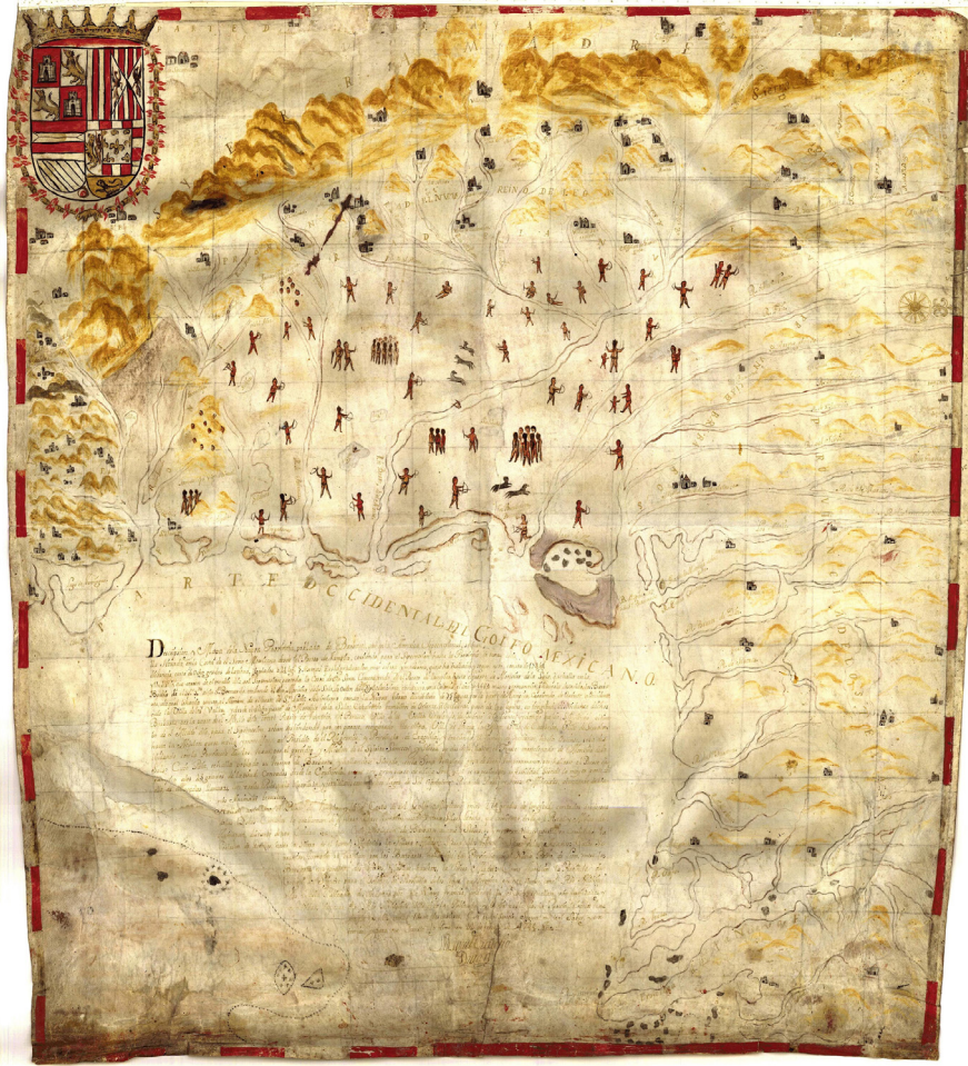
Figura 8. Descripción y mapa de la nueva provincia poblada de bárbaros, situada en la Costa del Seno Mexicano, desde el Puerto de Tampico hasta la provincia de Texas, 1744. Autor: Miguel Custodio Durán.