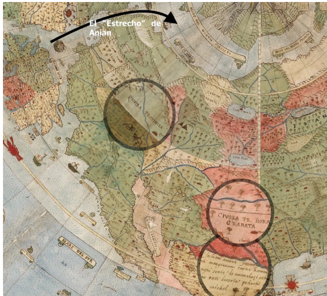
Figura 3. Fragmento del mapamundi de Urbano Monte de 1587, correspondiente a la Tavola X Che Ha Sua Superiore La Tavola Terza. Libro Terzo , al Norte de México, California y gran parte de Norteamérica. Se resaltan en los círculos Quivira y Cíbola, las míticas ciudades de oro, también la anotación referente al consumo de carne humana por los indios no subyugados y la referencia al estrecho o provincia de Anian o paso

gura 4) y parte del este de México con dirección al occidente; esta representación puede ser la referencia a su incursión de 1529 y más adelante se convertiría en la provincia de la Nueva Galicia [García Icazbalceta 1999]. La representación de un gran río puede deberse al de Pánuco en Veracruz, provincia donde fue gobernador. Es de extrañar la ausencia de la Laguna de Chapala, a pesar que en los planos de Ortelius sí se identifica; ésa fue la primera de muchas expediciones que otros seguirían al territorio nómada y donde iniciaría el proceso de conquista y colonización a “sangre y fuego”. Es necesario recordar cuando Beltrán Nuño de Guzmán comisionó a Gonzalo López en 1530 para cruzar la Sierra Madre Occidental desde Culiacán. Si bien no es posible determinar con certeza hasta dónde llegó su empresa, sus comentarios son muy interesantes. López describió dichas llanuras como desiertos despoblados, donde no había sino indios “salvajes” sin caminos ni poblados; la expedición fue tan cruenta que refirió, de no haber sido por un poco de maíz que había dejado enterrado, todos hubieran muerto [García Icazbalceta 2004].