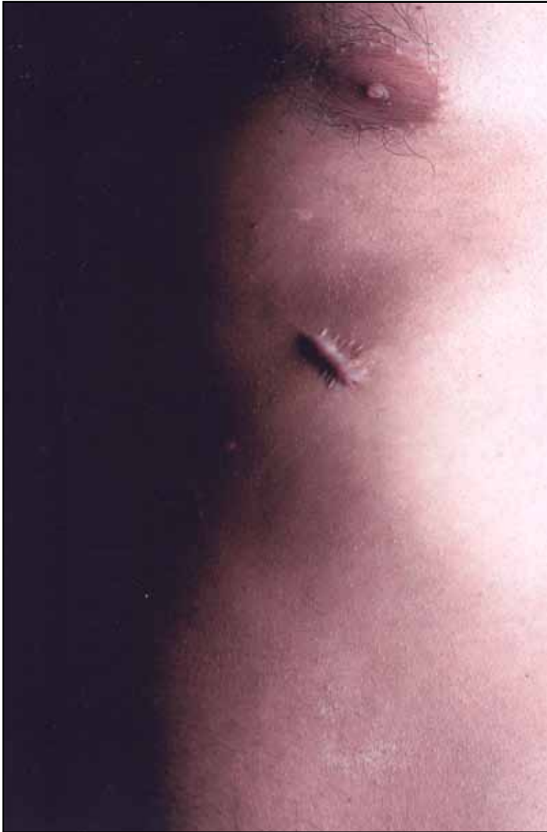
6. Cicatriz I