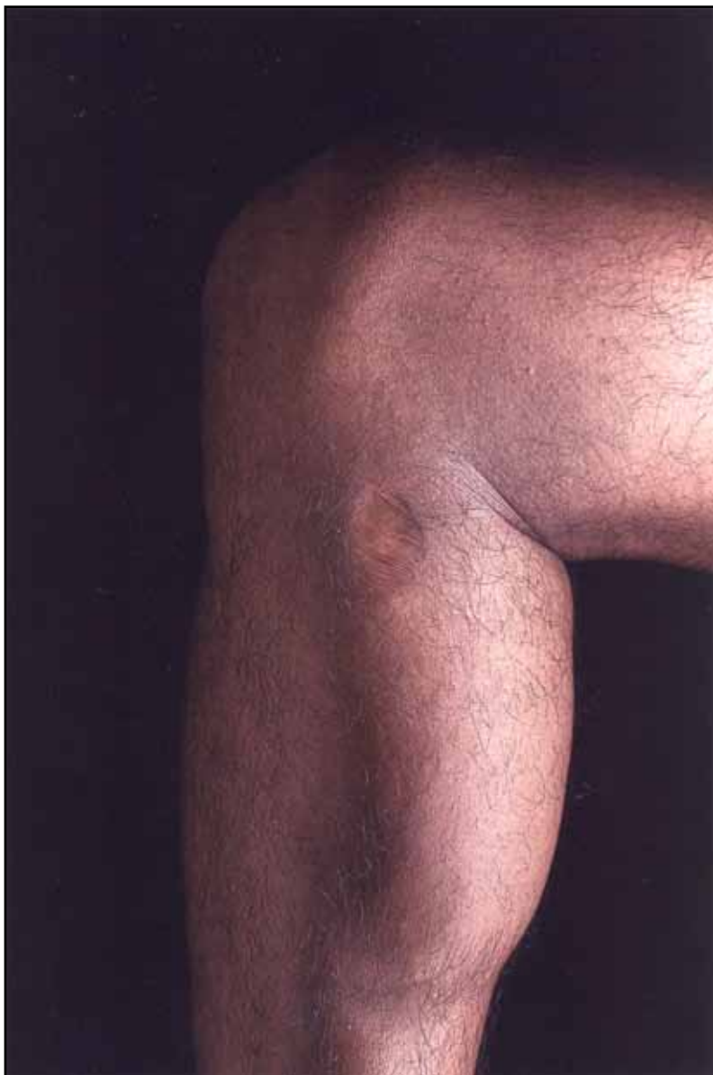
8. Cicatriz G. II