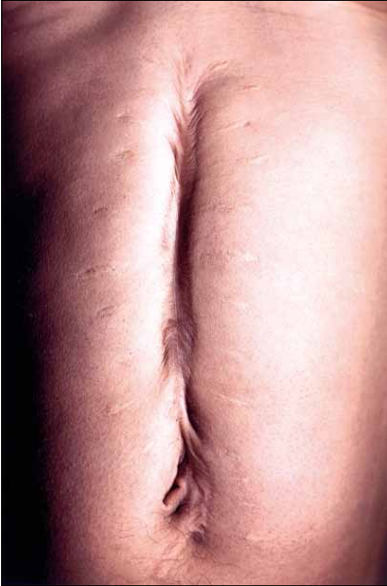
4. Cicatriz G