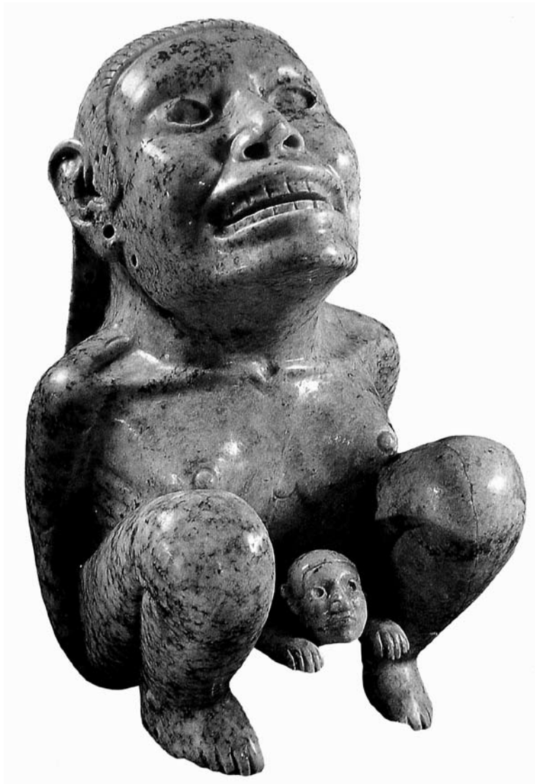
Figura 1. Diosa Tlazolteotl

Se muestra en cuclillas, postura que se acostumbraba en el parto. Aplita. 20.2 × 12 cm. Dumbarton Oaks Research Library and Collections. Washington, D.C. Tomado de Arqueología Mexicana , 2003, edición especial, núm. 13:70.