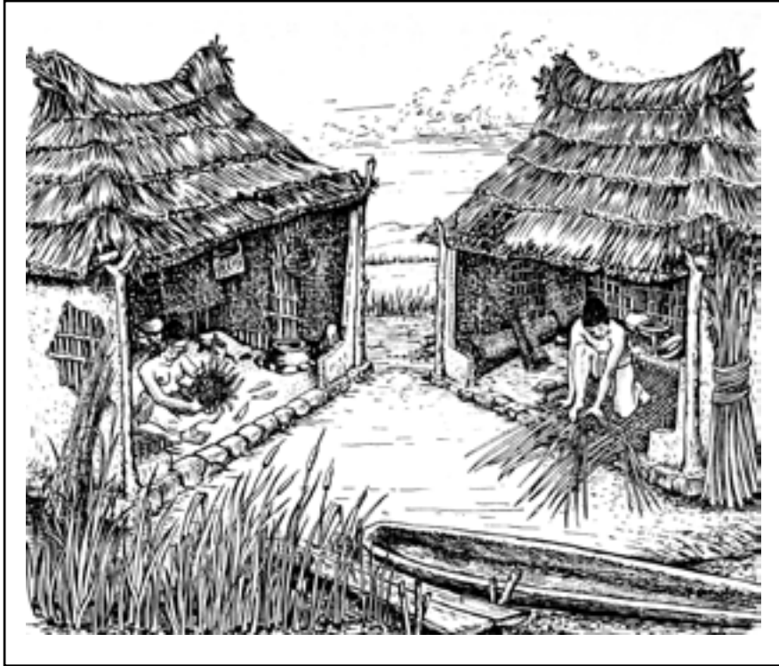
Figura 2. Reconstrucción hipotética de las casas en el islote de Terremote-Tlaltenco