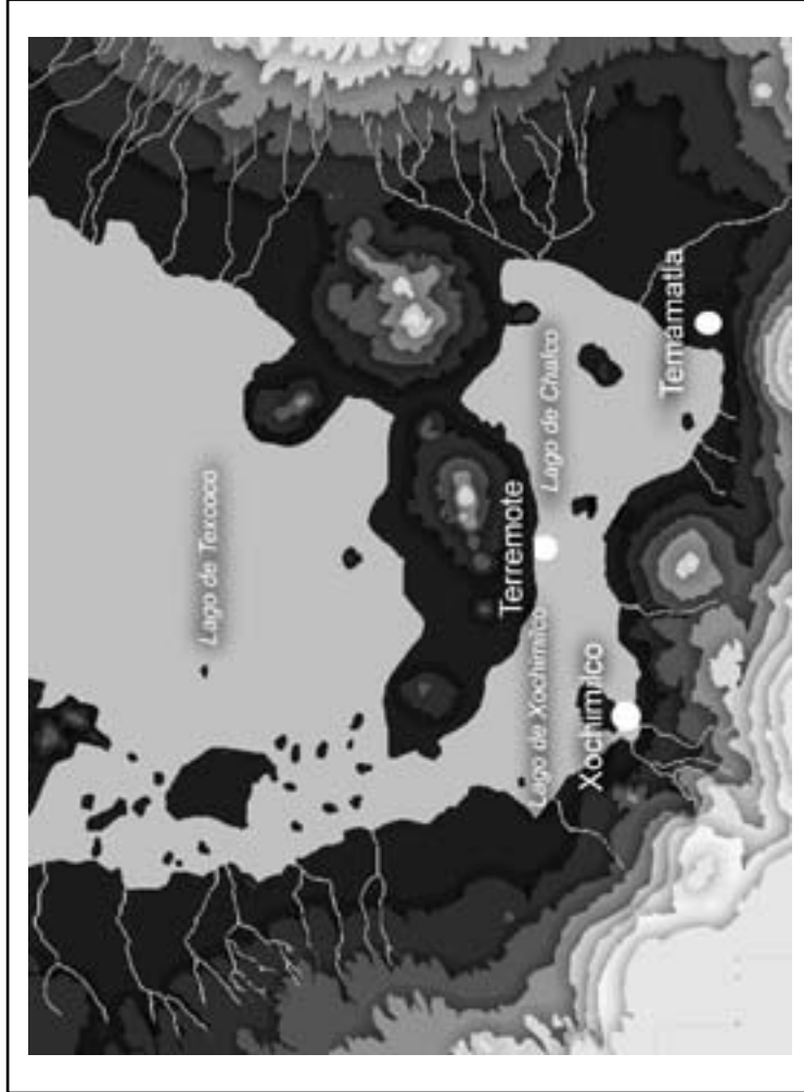
Figura 1. Localización de los sitios de Terremote, Temamatla y Xochimilco en el sur de la cuenca de México