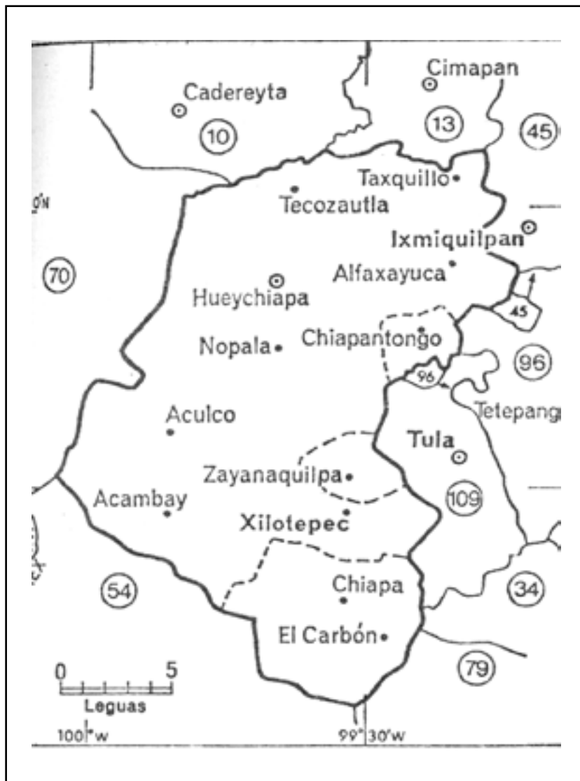
Figura 1. Encomienda de Jilotepec en el siglo XVI