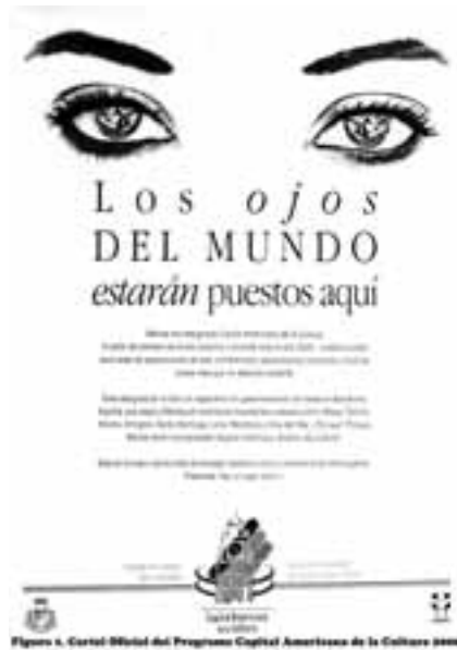
Figura 1. Cartel Oficial del Programa Capital Americana de la Cultura 2008