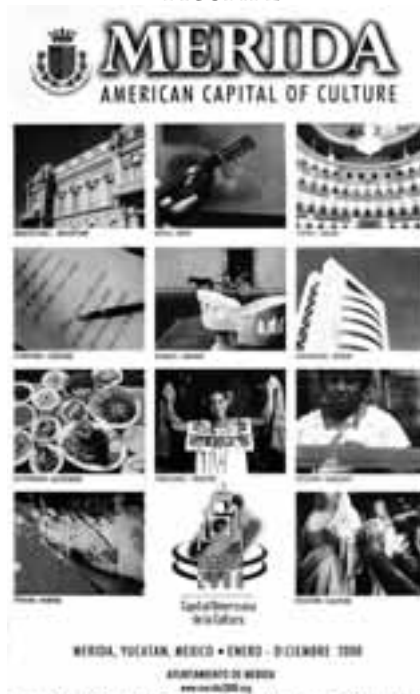
Figura 2. Cartel Oficial del Programa Capital Americana de la Cultura 2008