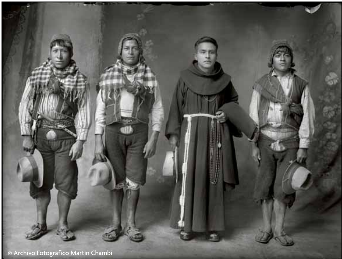
El hermano cura