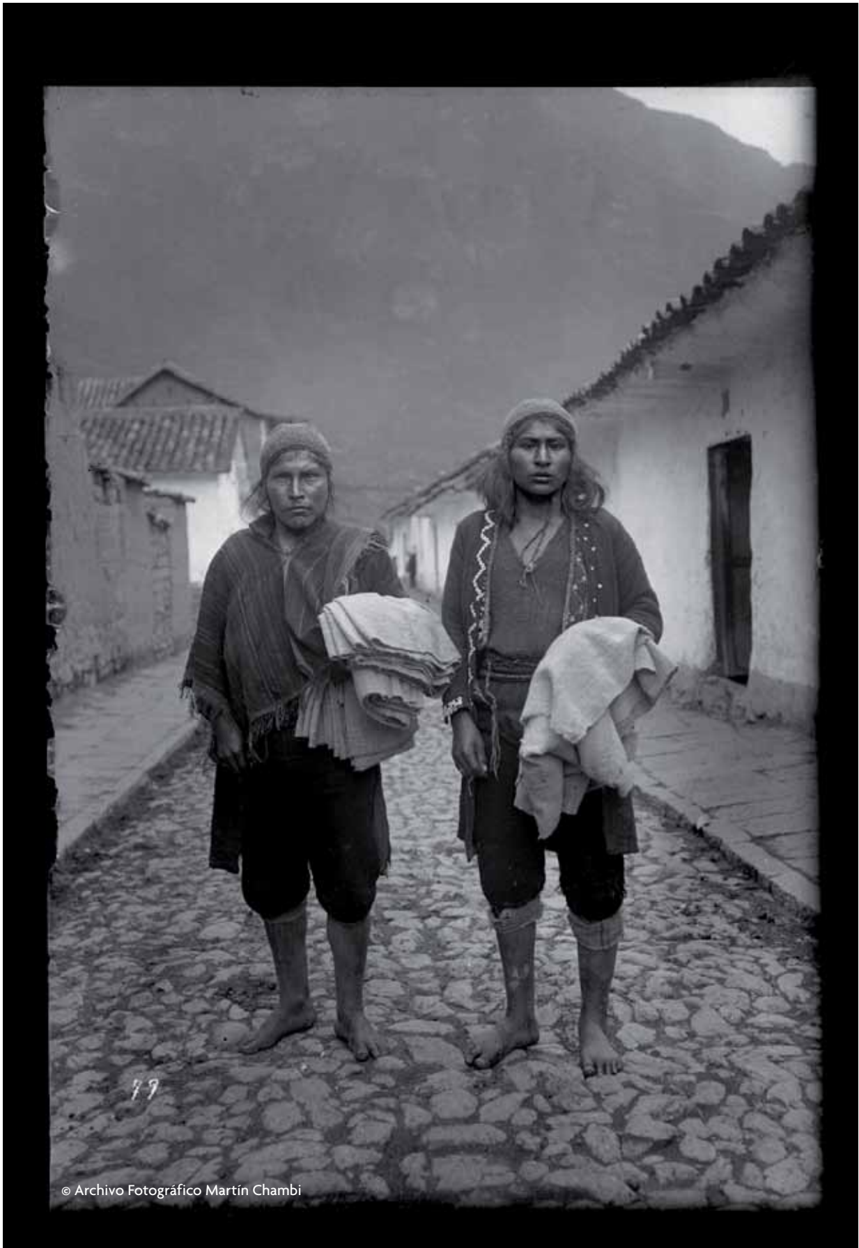
Campeño Q'eros en Paucartambo