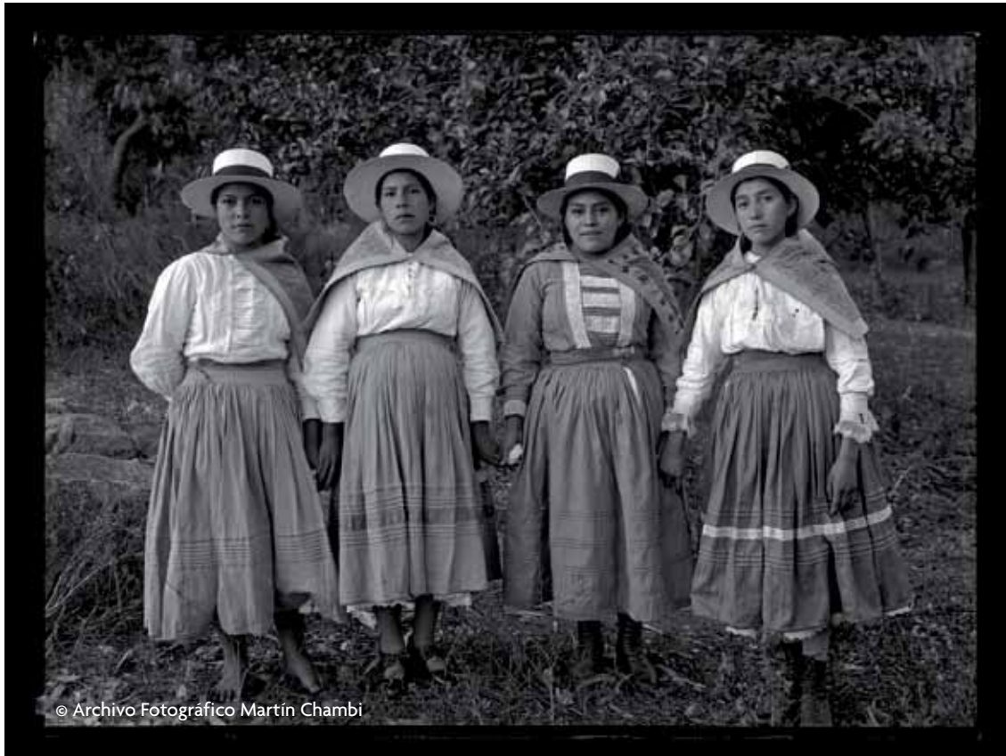
Campesinas de Abancay