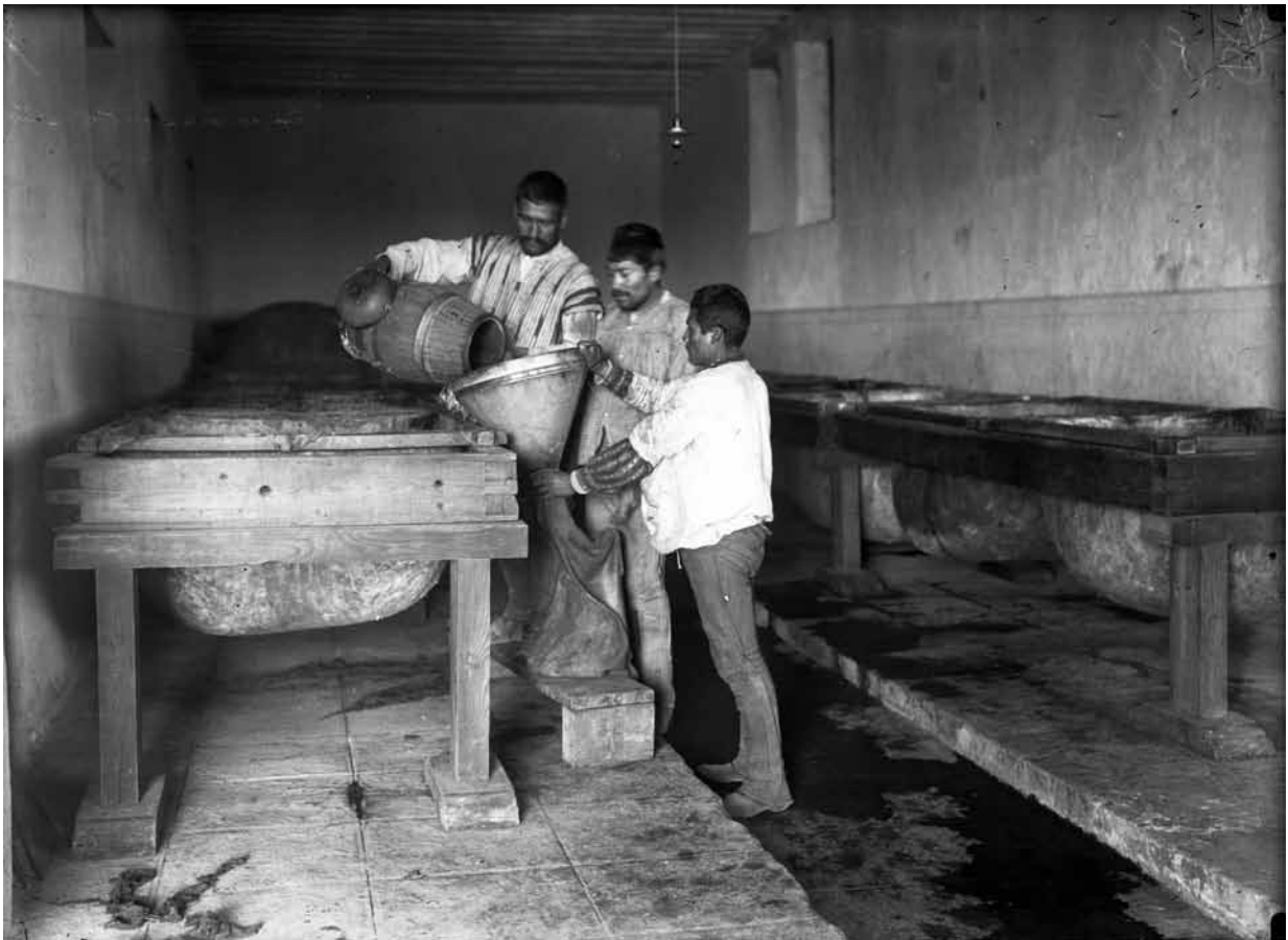
Tlachiheros laboran en tinacal, 1910, Fondo Casasola, Sinafo-INAH, inv. 6335.