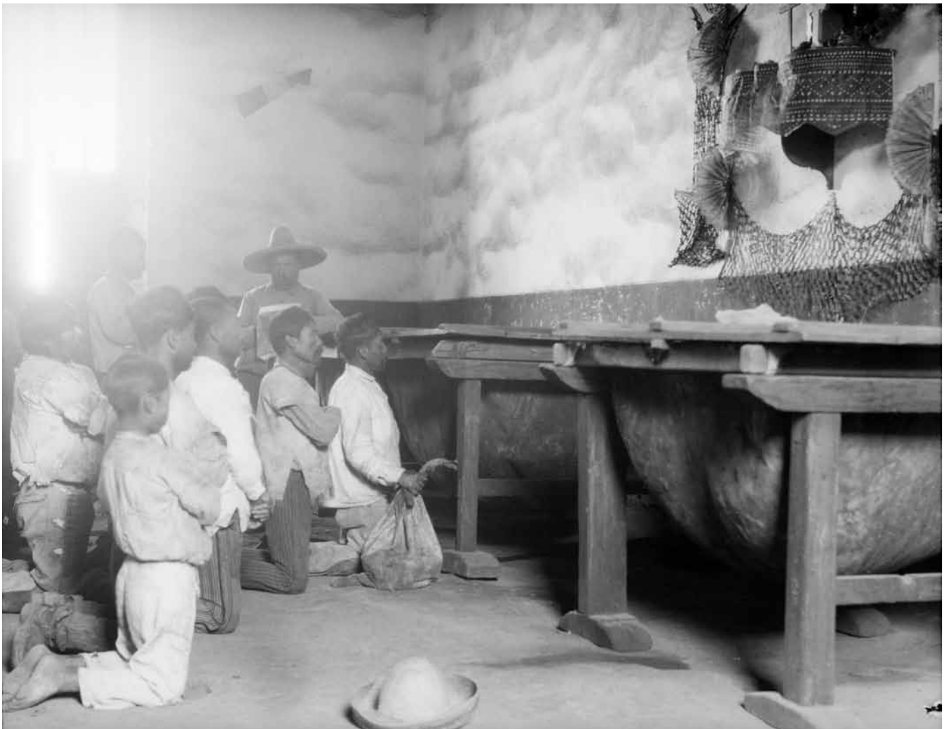
Tlachiqueros orando ante un altar en el tinacal, 1930, Fondo Casasola, Sinafo-INAH, inv. 162996.