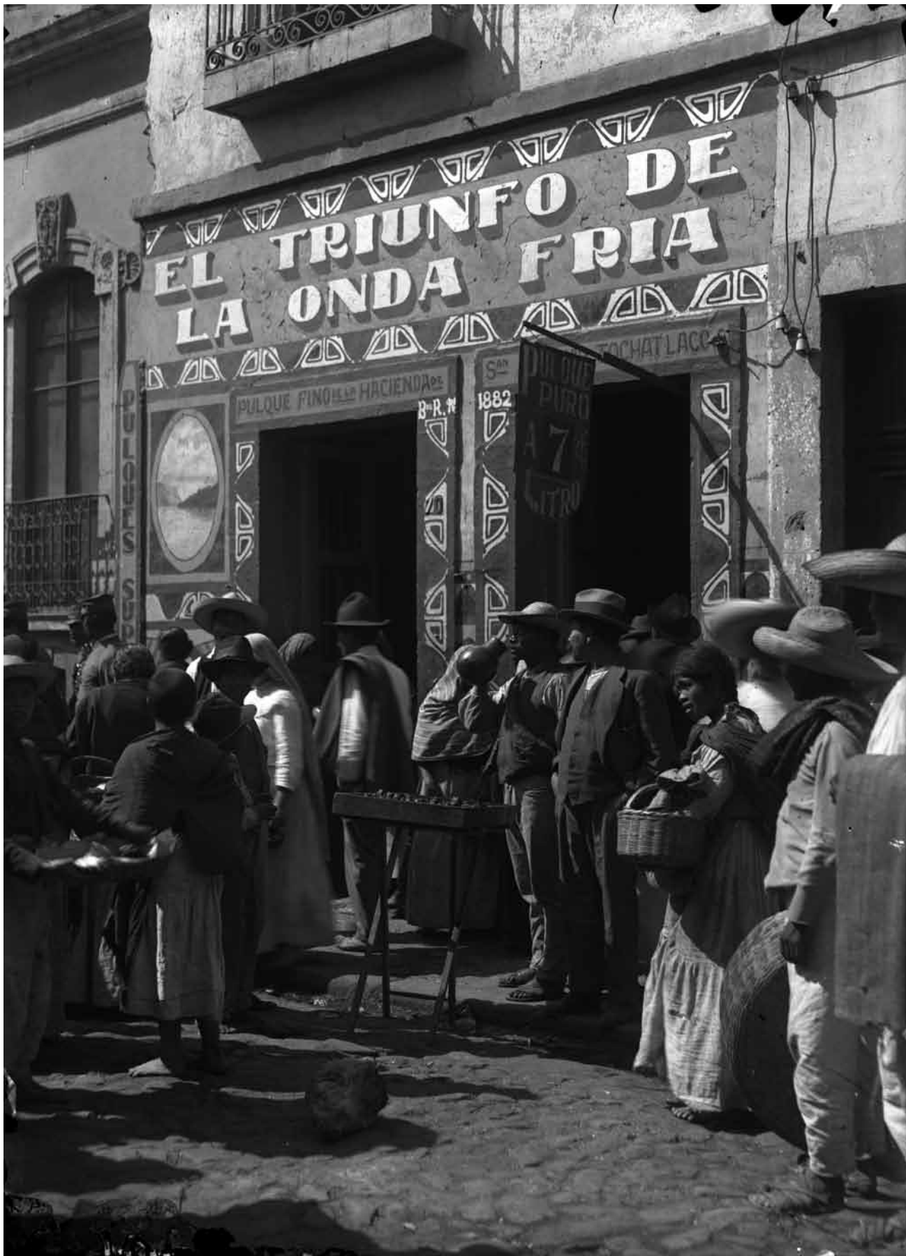
Pulquería en un barrio popular, Fondo Casasola, Sinafo-INAH, inv. 5629.