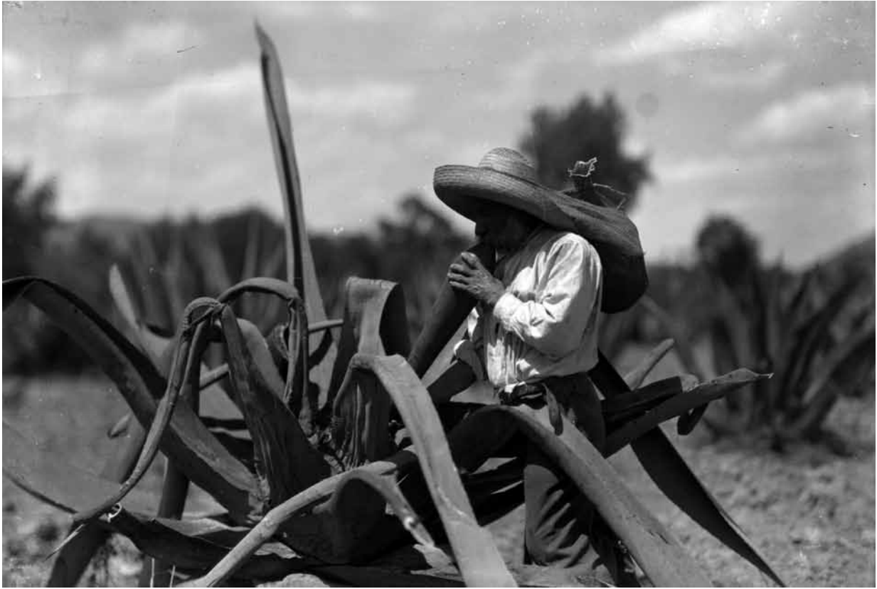
Tlachihero saca aguamiel con acocote, 1915, Fondo Casasola, Sinafo-INAH, inv. 5908.