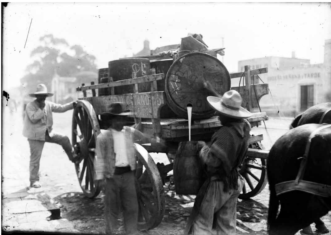
Individuo de condición humilde vertiendo pulque en un recipiente desde un barril en la calle, 1905, Fondo Casasola, Sinafo-INAH, inv. 162967.