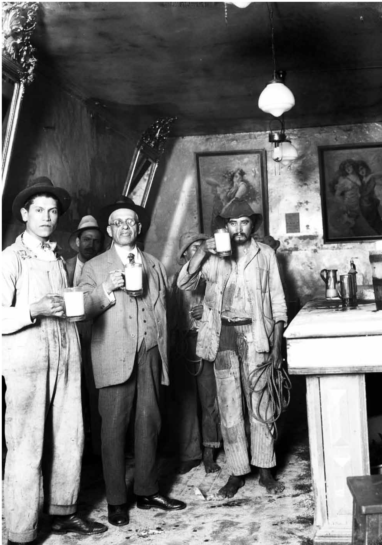
Cientes de una pulquería brindan, 1922, inv. 6357.