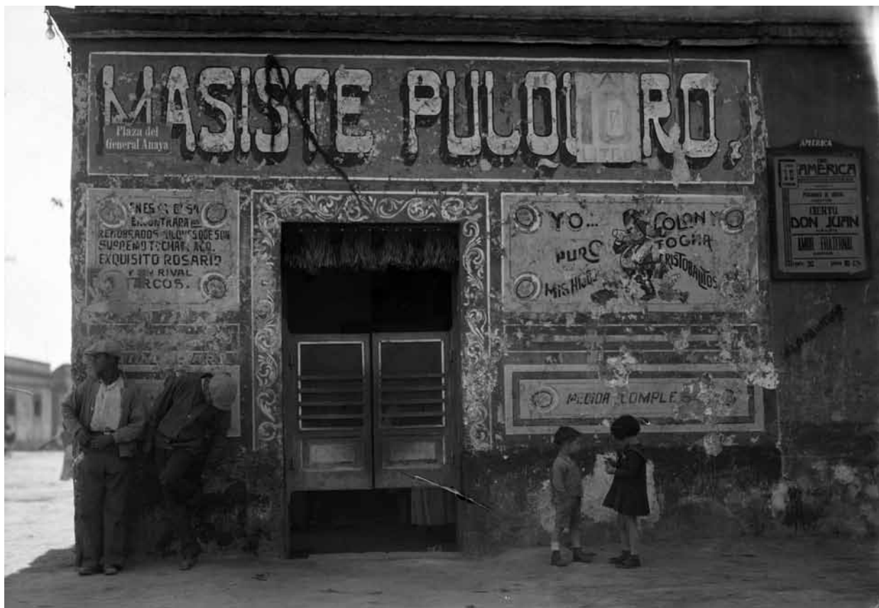
Pulquería "Masiste pulquero", fachada, 1929, Fondo Casasola, Sinafo-INAH, inv. 196367.