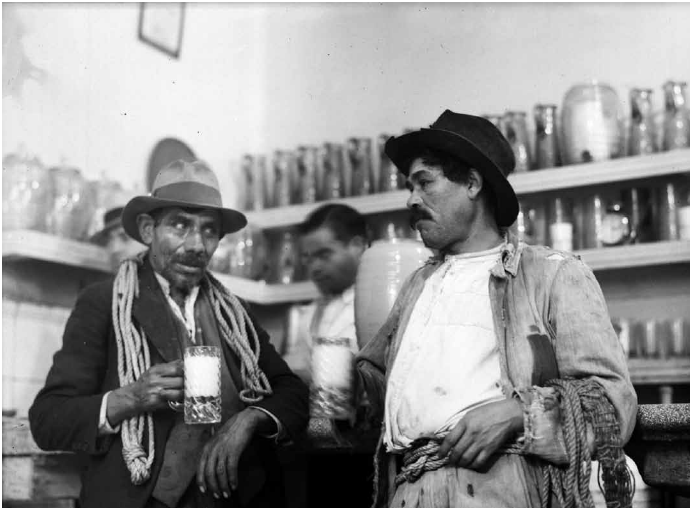
Consumidores en un expendio de pulque, 1930, Fondo Casasola, Sinafo-INAH, inv. 276153.