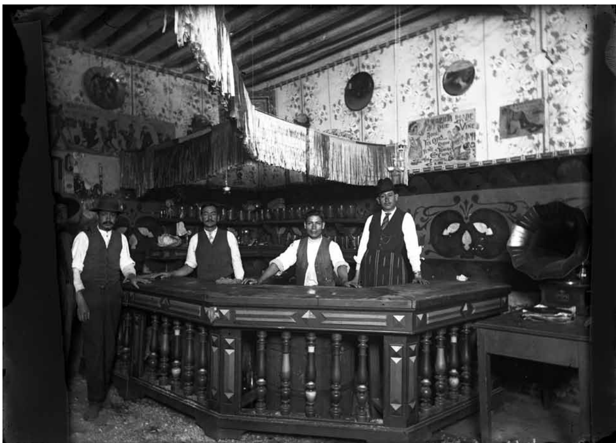
Dependientes de una pulquería, 1915, Fondo Casasola, Sinafo-INAH, inv. 5567.