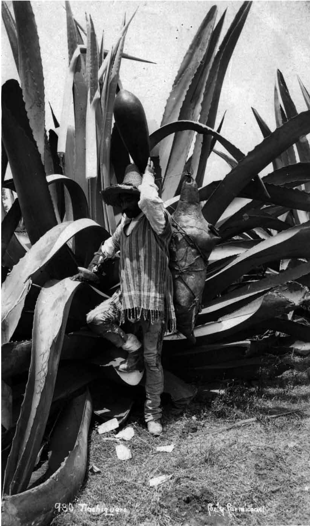
Pulquero junto a maguey, 1930, Col. Felipe Teixidor, Fondo Casasola, Sinafo-INAH, inv. 609476.