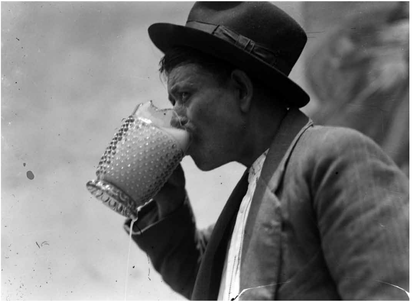
Hombre vestido con traje modesto bebiendo pulque con jarro de vidrio, 1915, Fondo Casasola, Sinafo-INAH, inv. 162964.