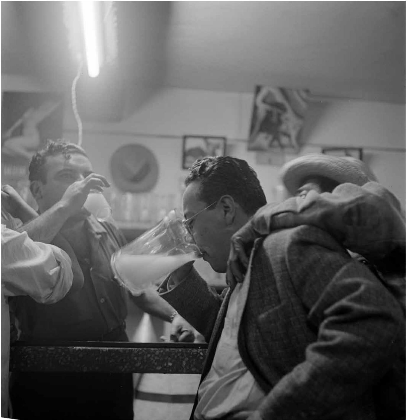
Nacho López, Bebedores toman pulque en cantina , 1955, Fondo Casasola, Sinafo-INAH, inv. 382936.