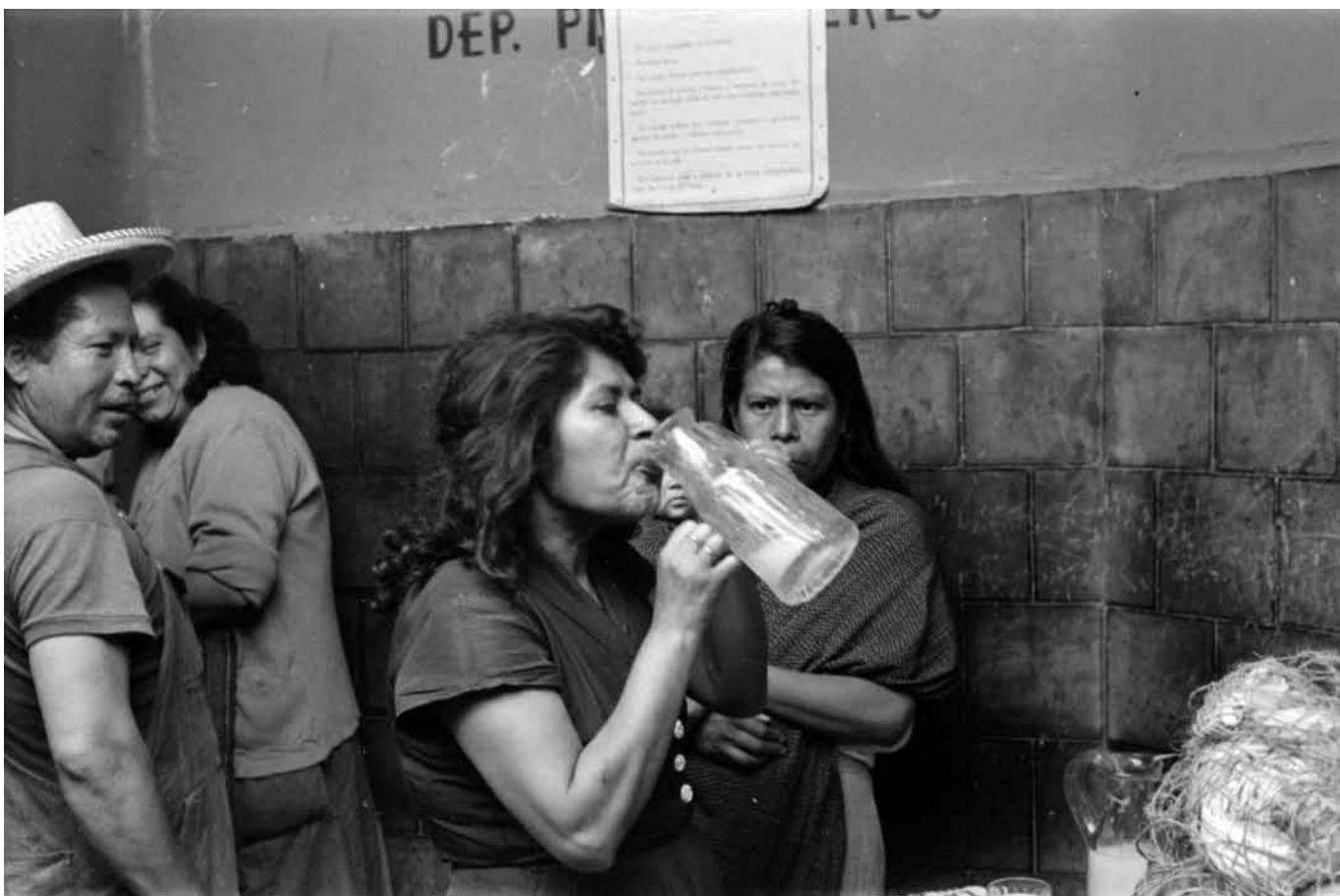
Nacho López, Mujer bebe pulque en una pulcata , 1950, Fondo Casasola, Sinafo-INAH, inv. 382934.