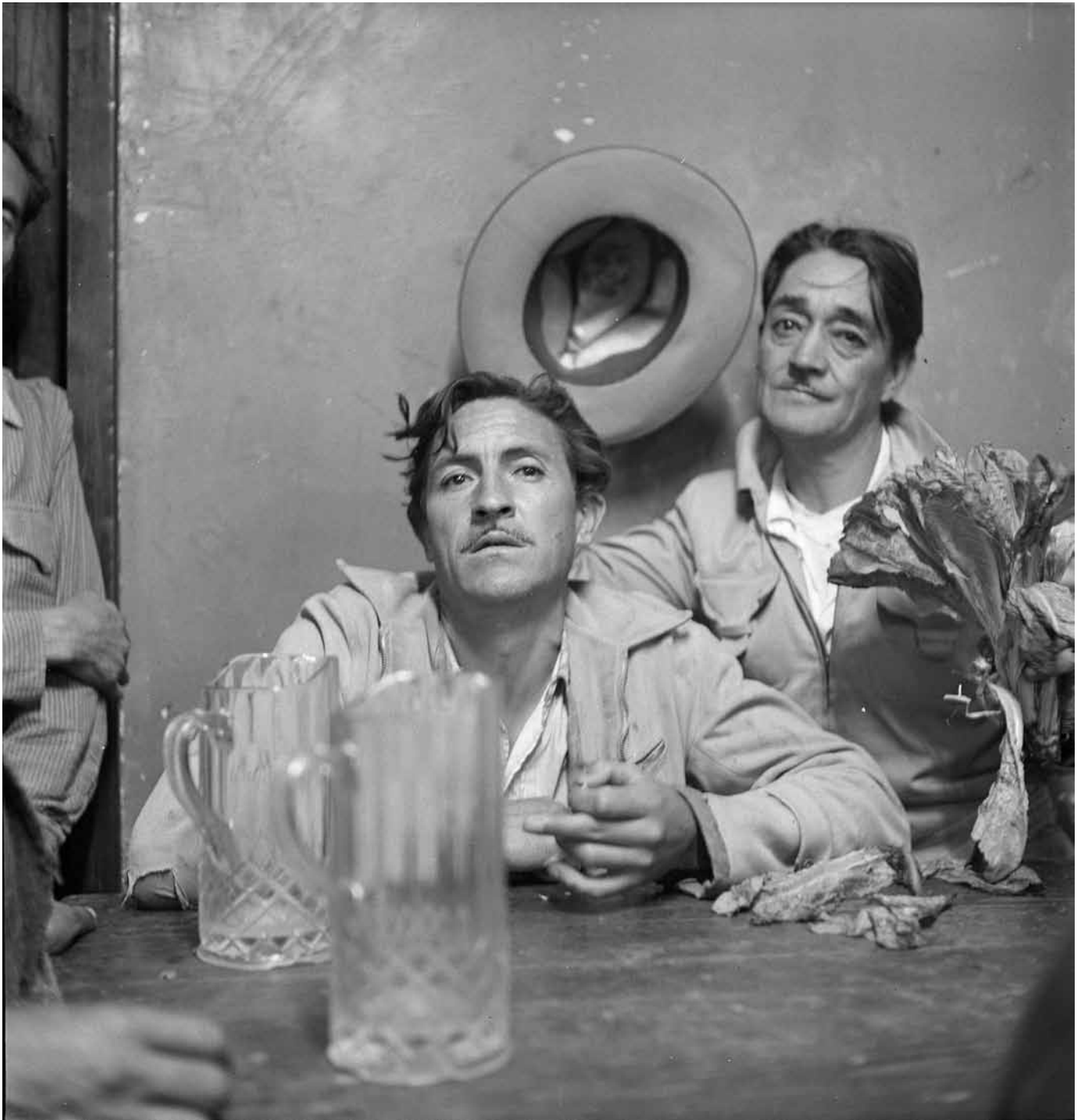
Nacho López, Hombres en una pulquería , 1950, Fondo Casasola, Sinafo-INAH, inv. 382937.