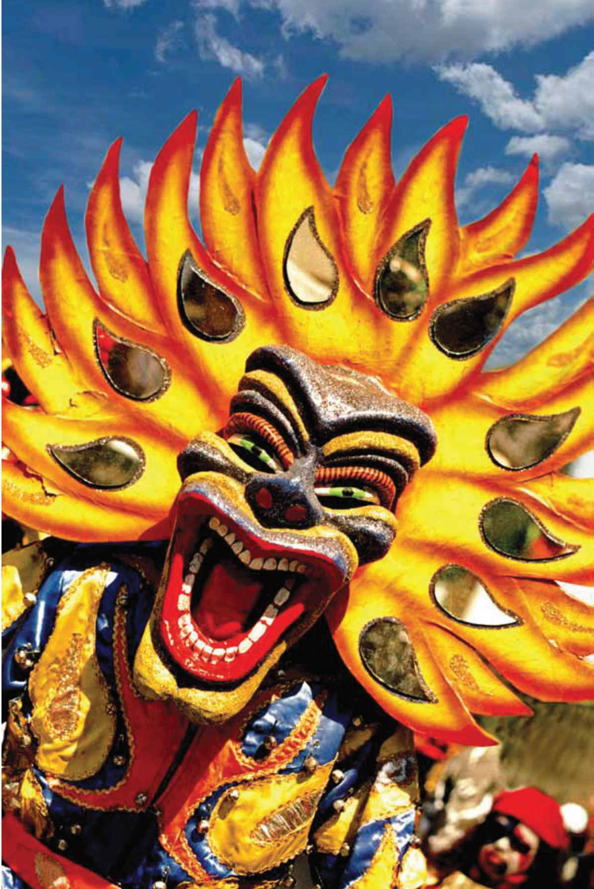
© Mariano Hernández, Juda de Navarrete