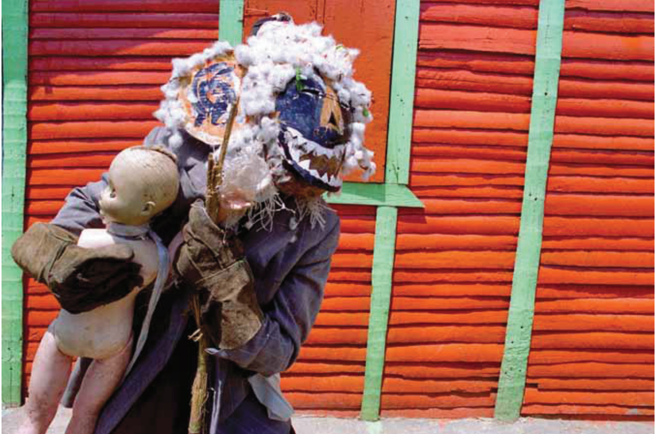
© Mariano Hernández, Negro de la Joya , Guerra