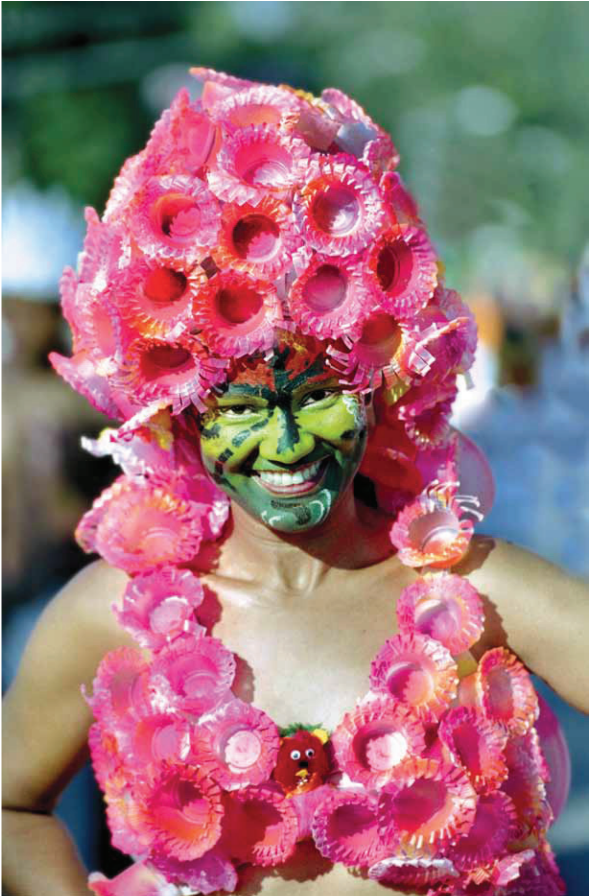
© Mariano Hernández, Margarita, Villa Mella