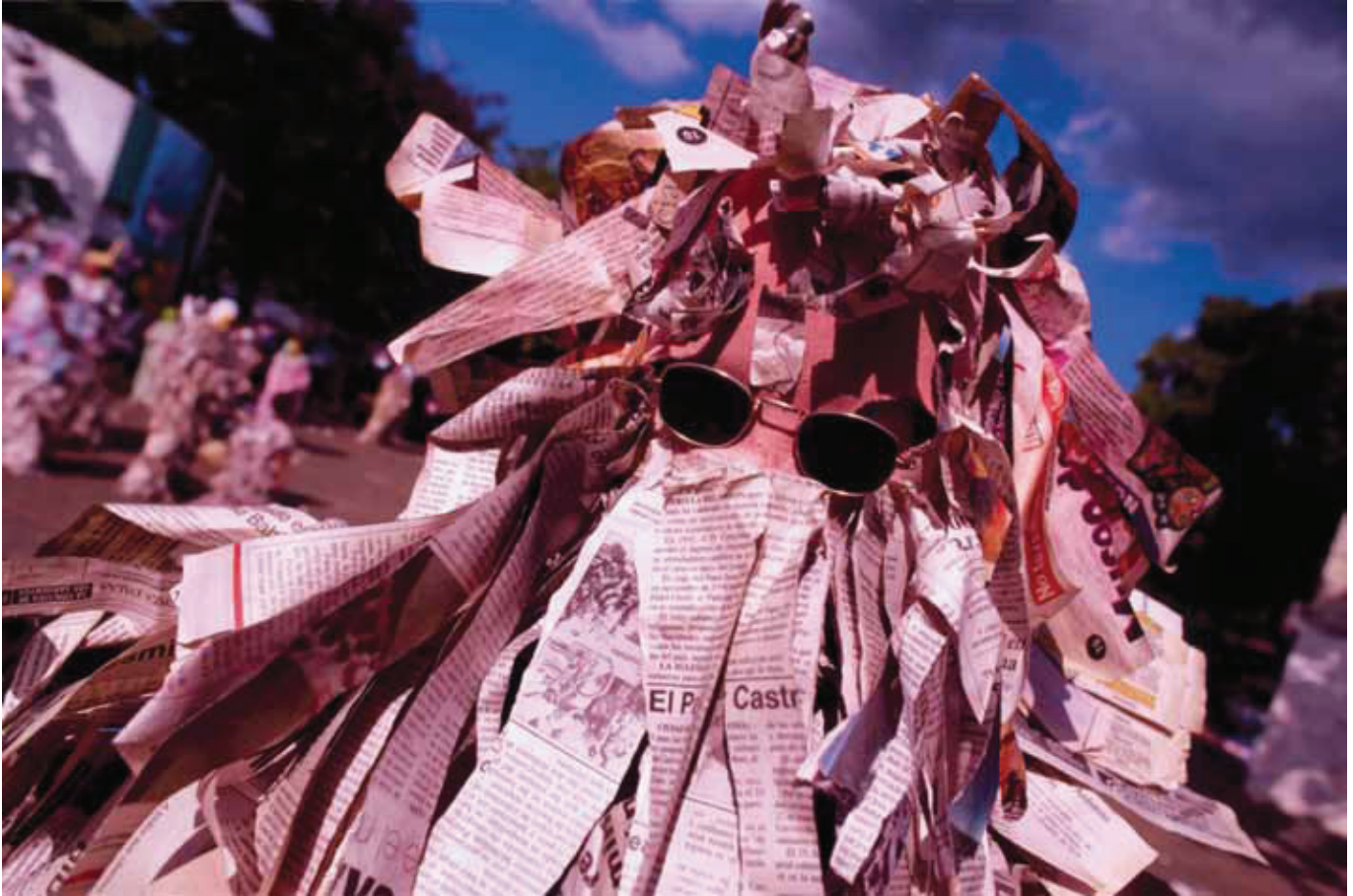
© Mariano Hernández, Papelu de Cotui