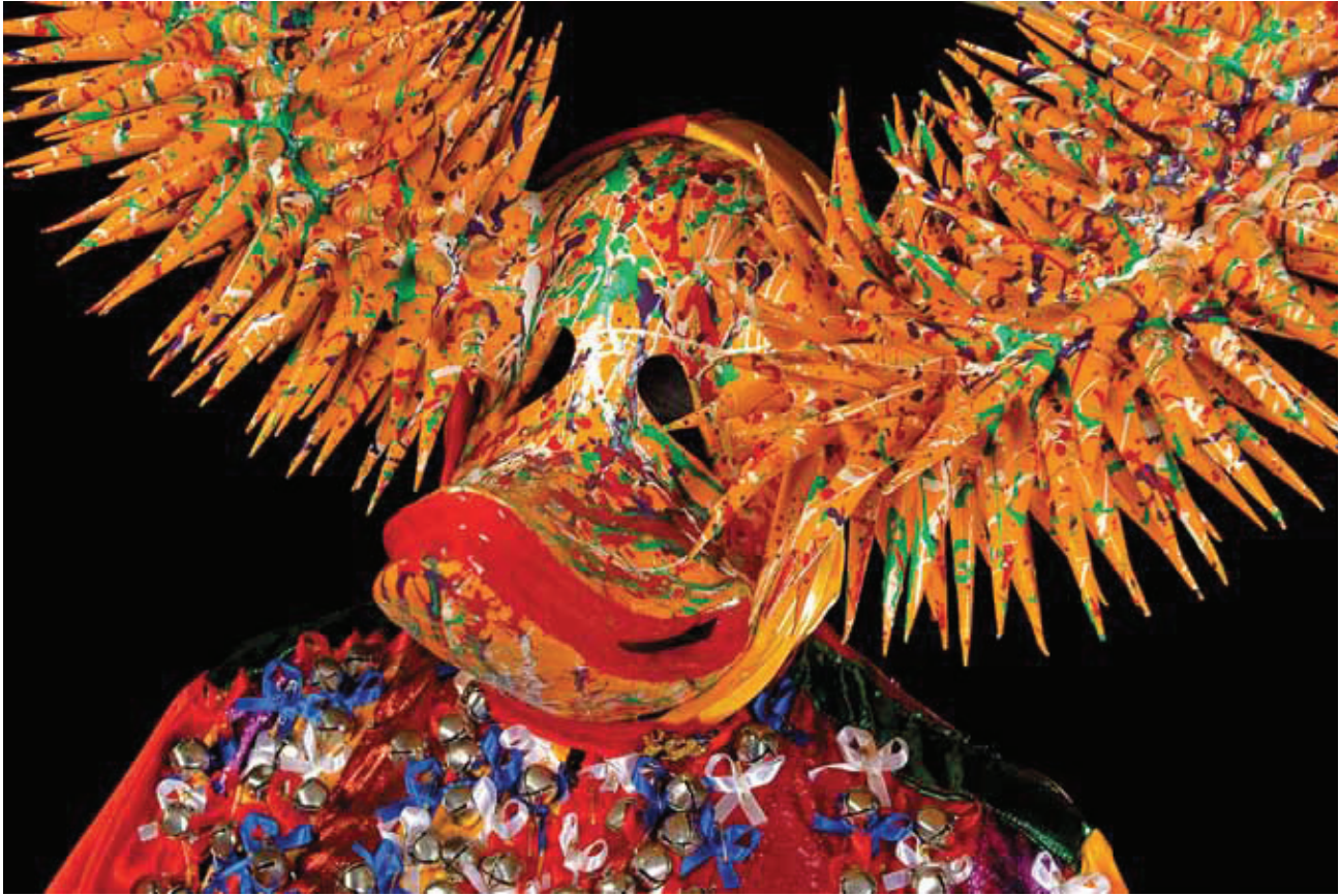
© Mariano Hernández, Lechón joyero , Santiago, República Dominicana