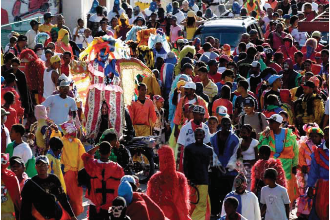
© Mariano Hernández, Cachuas y el Jua en la multitud