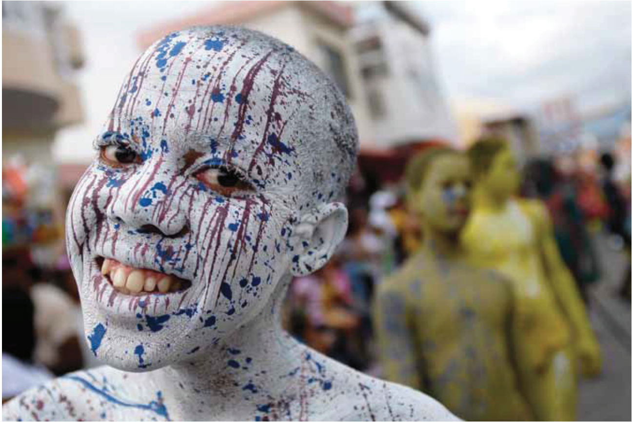
© Mariano Hernández, Pinta'o de Barahona [de blanco]