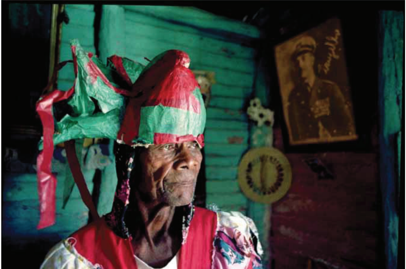
© Mariano Hernández, El cachua mayor