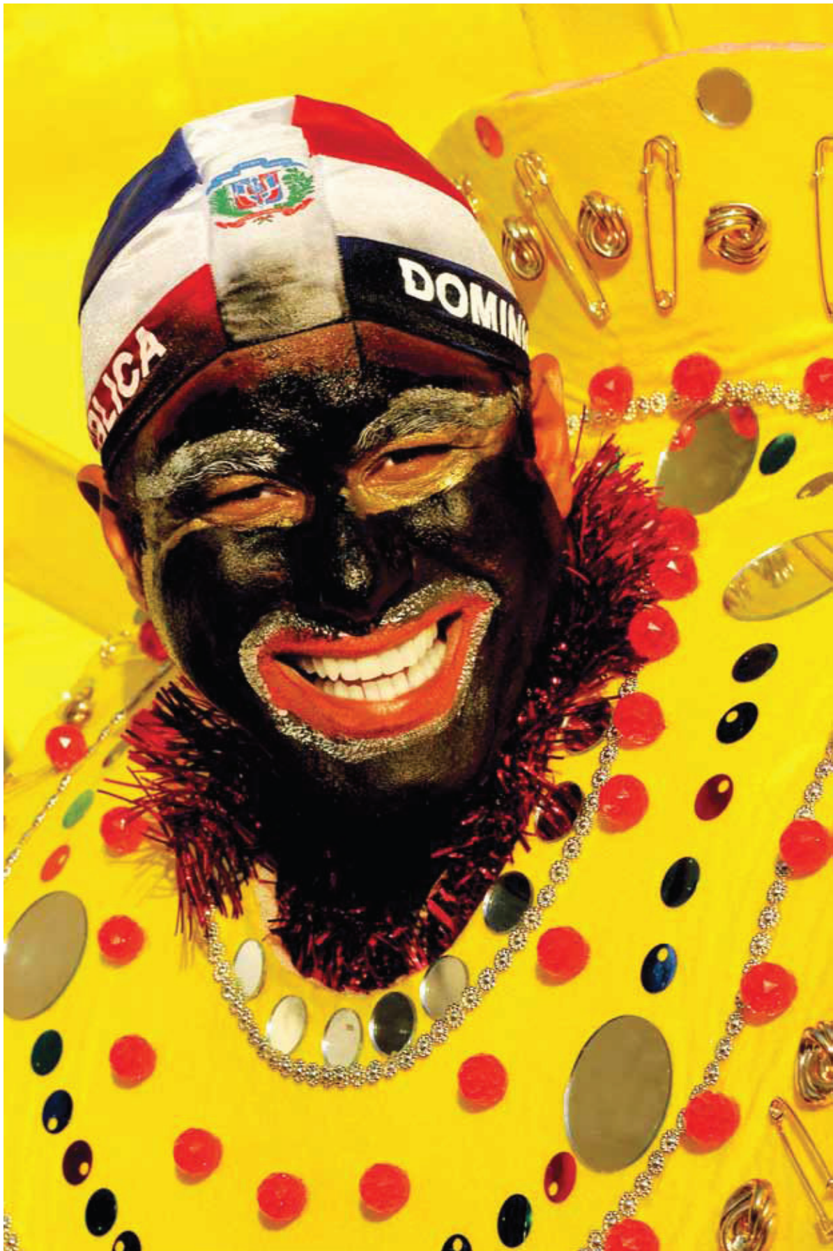
© Mariano Hernández, Enrique de amarillo, Cotui