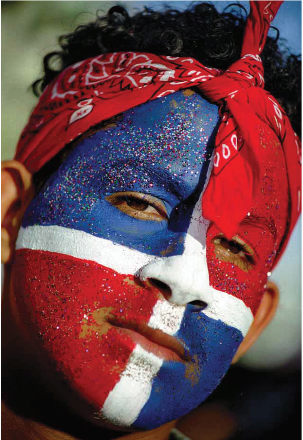
© Mariano Hernández, Rostro con bandera , Santiago