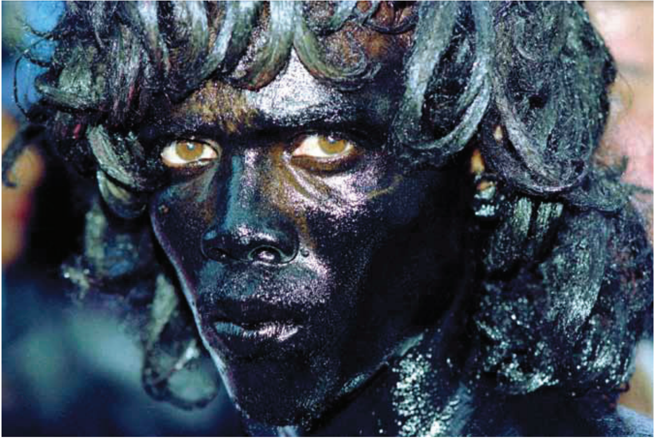
© Mariano Hernández, Rostro de Tizna'o, Santo Domingo