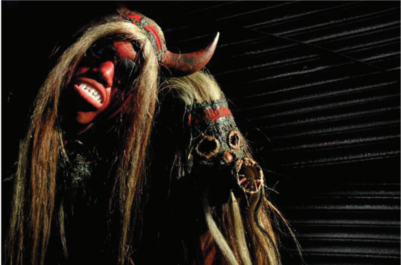
© Mariano Hernández, Tifua de Azua