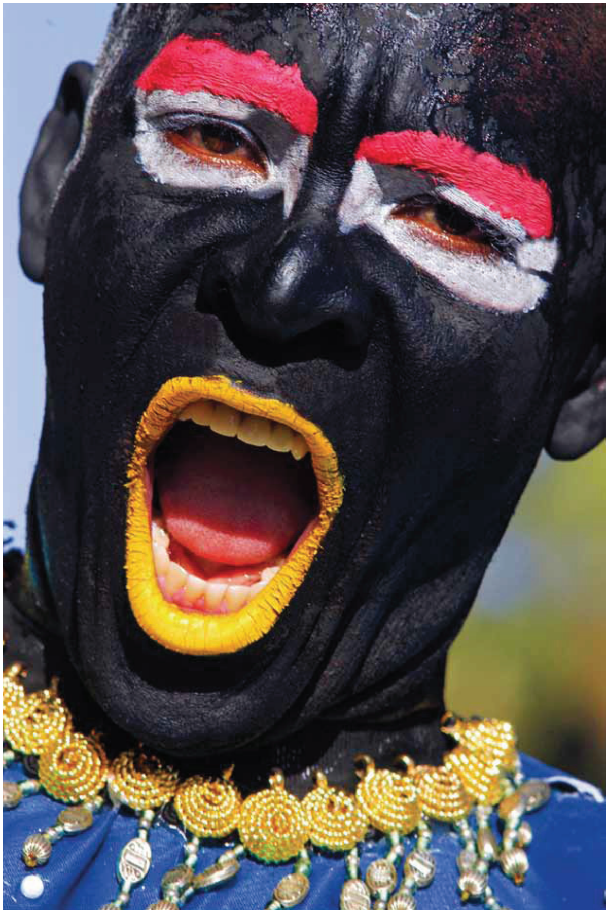
© Mariano Hernández, Grito de Juampa-Cotui