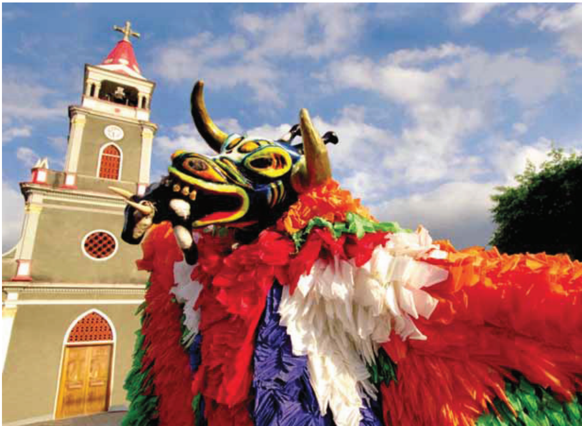
© Mariano Hernández, Macrao de Salcedo