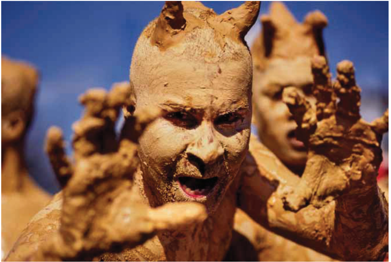
© Mariano Hernández, Hombres de barro , Bonao