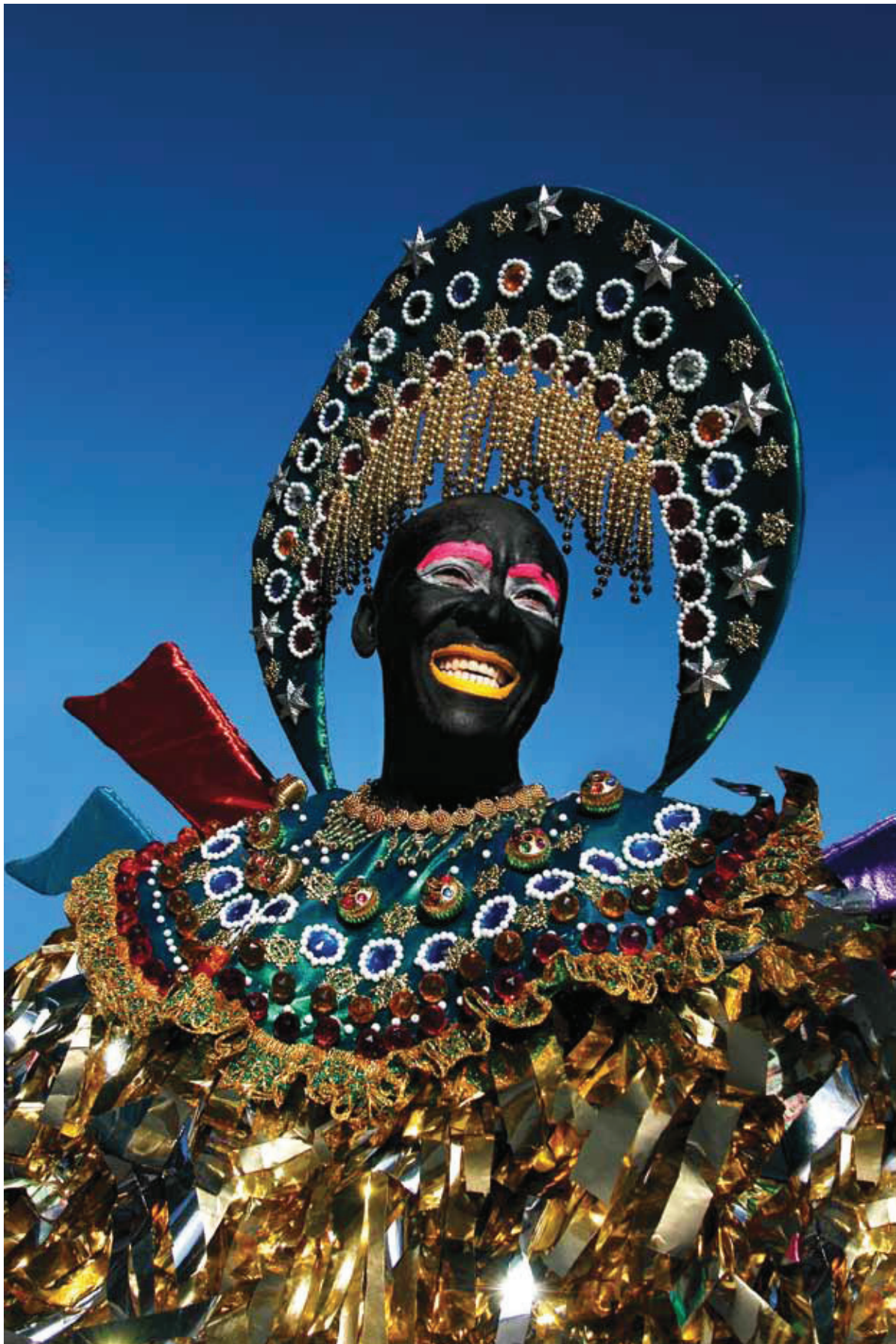
© Mariano Hernández, Príncipe africano (carnaval de Cotui)