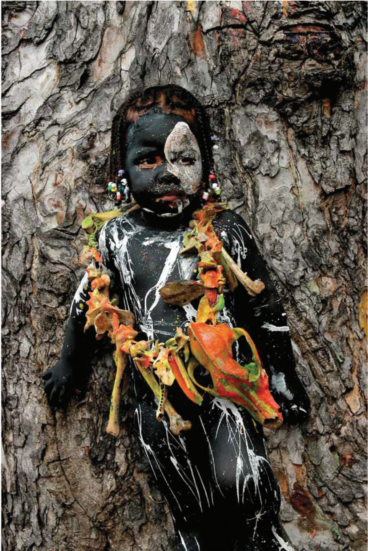
© Mariano Hernández, Niña de los Pintao de Barahona