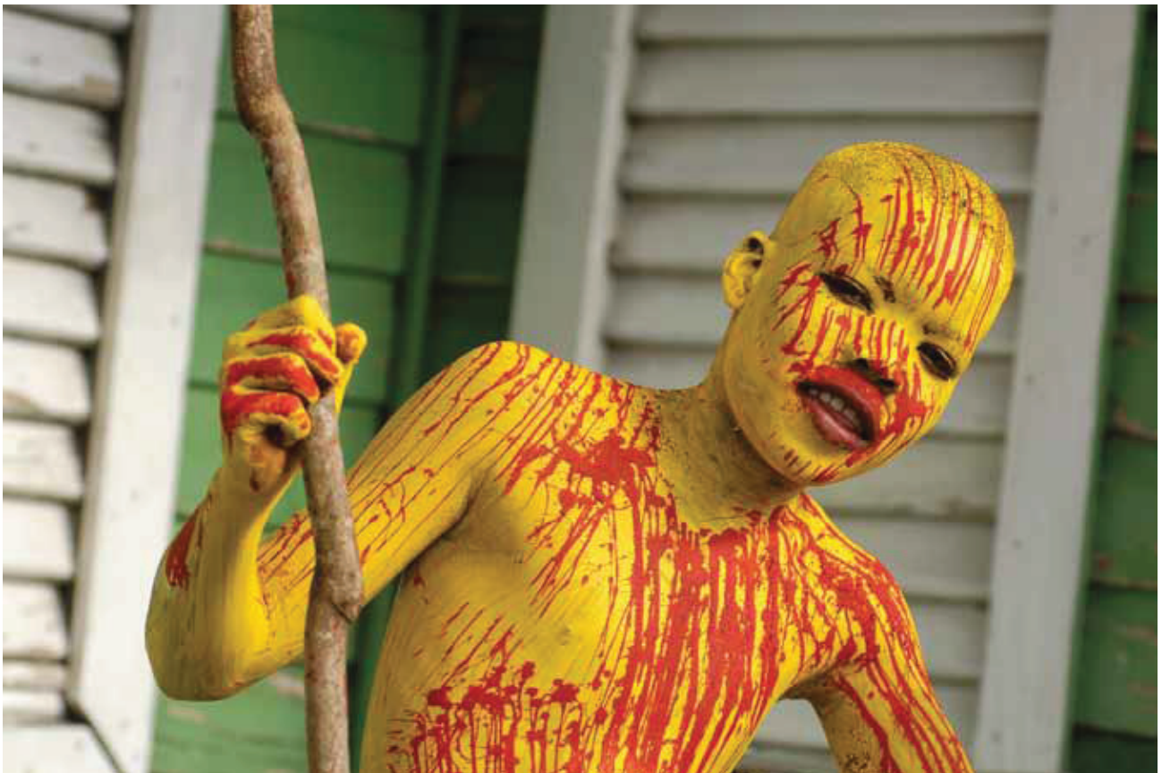
© Mariano Hernández, Pinta'o de Barahona [de amarillo II]