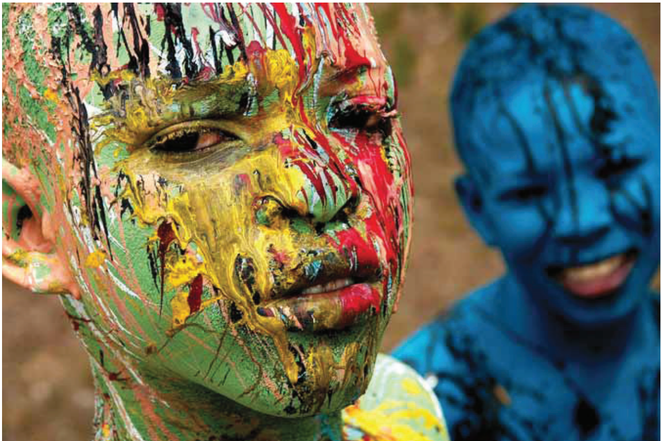
© Mariano Hernández, Los Pintao de Barahona