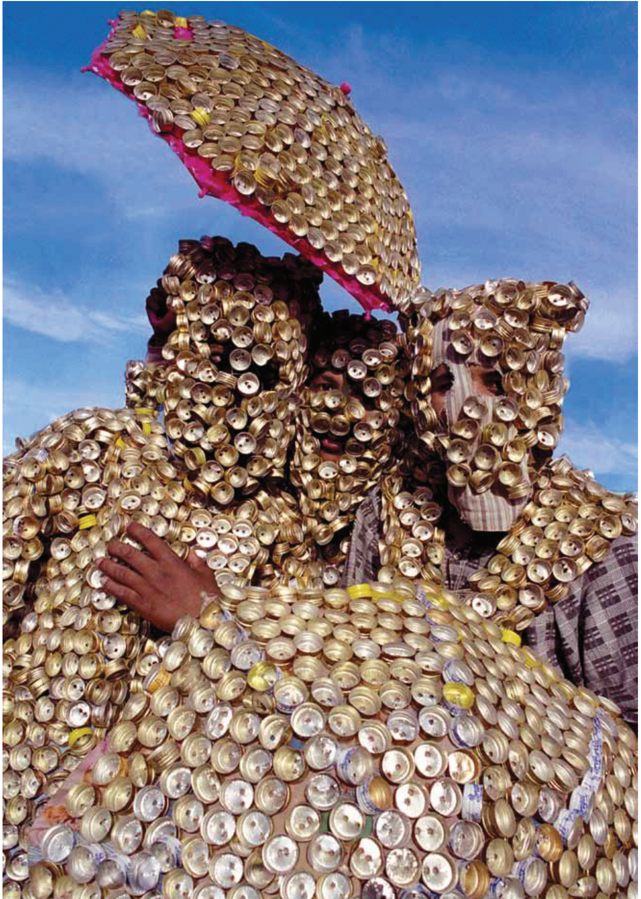
© Mariano Hernández, Hombres tapitas , Santo Domingo