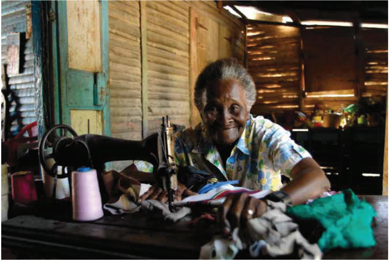
© Mariano Hernández, Haciendo trajes de cachuas