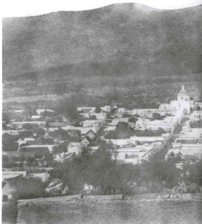
Autor no identificado. Vista de Ciudad del Maíz, San Luis Potosí, México,

Durante tres días (12 al 14 de noviembre del 2008) se reunieron en el Palacio de la Autonomía