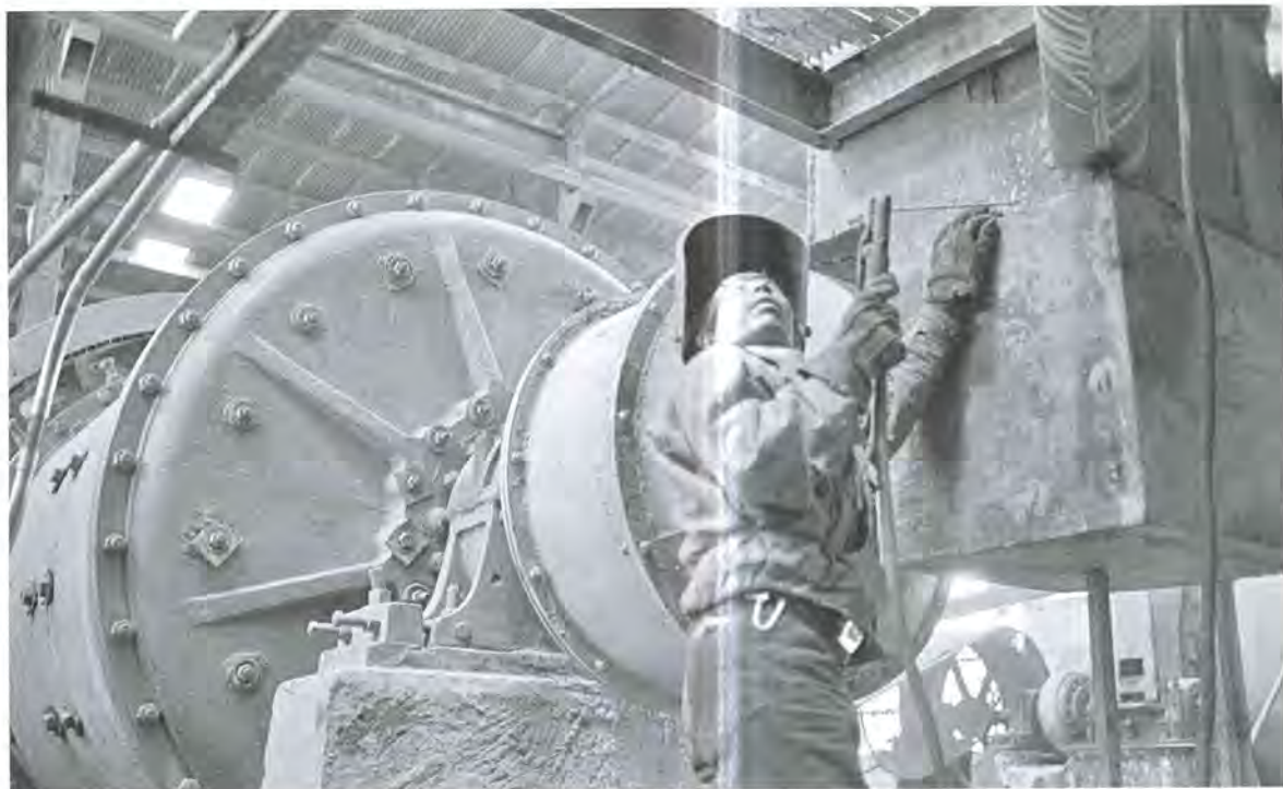
Molino de bolas, Fresnillo, Zacatecas.

temente entonces, era un valor. Los filósofos acabaron por pensar que el valor es más real que los hechos de la experiencia y que el mundo real es, en concreto, un valor. Esta idea nos fue heredada: intrínsecamente creemos que la realidad de una cosa es su actividad, su actualización, como diría Aristóteles.