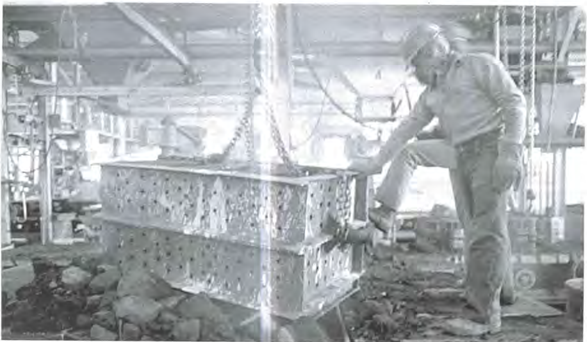
Planta de maestranza, departamento de fundición, Pachuca, Hidalgo.

Así, Beuys nos señala la importancia de cuestionar el estatuto mismo del objeto, lo que implica sin duda un ataque frontal a las nociones de integridad y autenticidad, como en su momento lo hiciera también Marcel Duchamp. Asimismo, este segundo caso, que habla sobre la paradoja de la identidad, la creatividad, la autoría y la originalidad, nos lleva, por ahora, al siguiente tema que quisiera abordar, esto es, al problema de la sinonimia y el lenguaje coloquial (o precrítico).