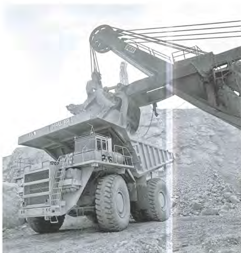
Grandes máquinas en el tajo, Cananea, Sonora.

Coordinación Nacional de Conservación del Patrimonio cultural-INAH difusion.cncpc@gmail.com