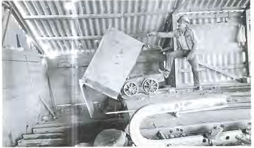
Cribas en La Valenciana, Guanajuato.

Como astutamente lo advirtió el empirista David Hume en el siglo XVIII, la paradoja anterior es un problema sobre la identidad . 1 Y es probablemente por ello que la autenticidad es un tema tan