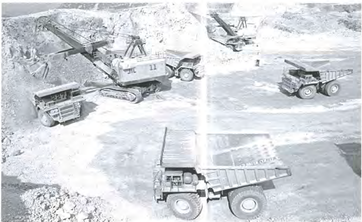
Mina a cielo abierto en Cananea, Sonora.

Es inútil enredarse en un problema de esta naturaleza. Es mucho más interesante asumir las paradojas y tratar de estudiarlas una a una, casuísticamente, por convenciones y consensos: si aun cuando existe una autenticidad pragmática (la nominal, la que avalan los peritos, la que nos dice que de la O siguen la P y la