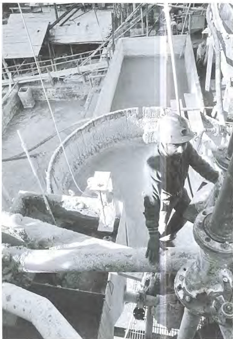
Hacienda de beneficio, El Cubo, Guanajuato.

Como mencioné líneas arriba, los valores son probablemente el asunto clave en la discusión sobre la autenticidad: parafraseando a la filósofa C. Korsgaard, es interesante preguntarnos por qué cuando observamos dos flores decimos que no son exactamente iguales y en vez de ver dos flores colocadas la una frente a la otra las vemos como si estuvieran esforzándose por ser algo que no son. Esto, además de ser un problema metafísico sobre la identidad nos muestra que la pregunta responde a que la mente, per se , tiene una idea preconcebida de lo igual. En la tradición griega esto eran las formas, mismas que funcionaban como una especie de modelo. La forma, consecuen-