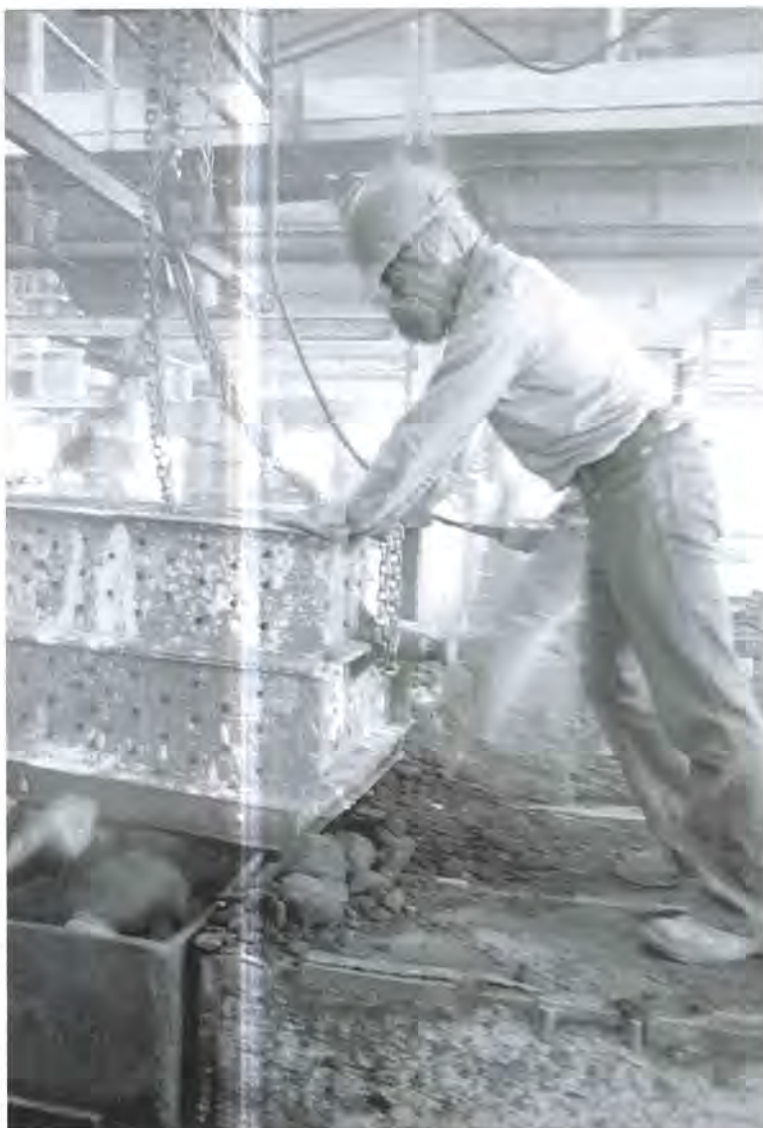
En la fundición de maestranza de la Compañía Real del Monte y Pachuca, Hidalgo.

En nuestro ámbito de acción, empero, la autenticidad “es una medida del grado en que los atributos del patrimonio cultural (incluyendo su forma y diseño, sus materiales y sustancia, su uso y función, sus tradiciones y técnicas intrínsecas, su localización y ambiente, y su espíritu y sentimiento, entre muchos otros factores) actúan adecuada y creíblemente como testigos de su importancia” (Carta de Riga). De alguna manera, si debiéramos equiparar la “autenticidad” con alguno de los términos anteriores, rescataríamos tan sólo la noción de lo genuino , pero no la de lo verdadero, lo original o lo natural.