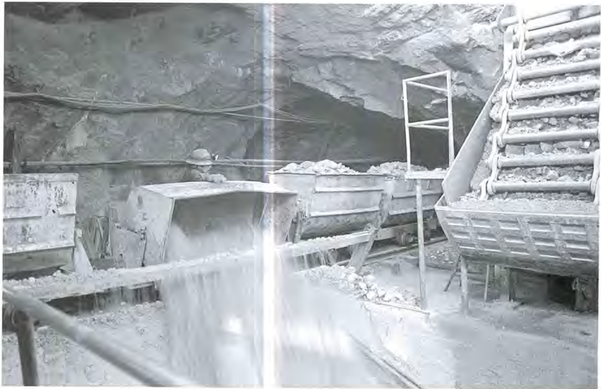
Cribas a interior de mina, Guanajuato.

en la segunda guerra mundial fue de tal magnitud que la reconstrucción total de las ciudades tras 1945 podía equipararse a la recuperación de una parte de su identidad nacional. ¿Puede algún profesionalista decir que dicha actividad no fue legítima?