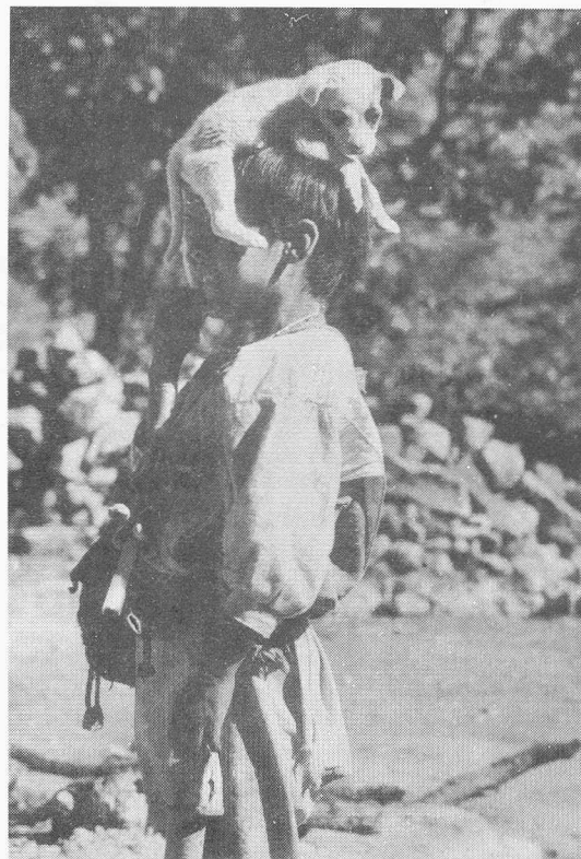
• Quinto concurso de fotografía / 1985 Guillermo Aldana E., Hignacio: el regalo de la vida

Aceptamos así el reto de articular información de procedencia antropológica, demográfica, de análisis regional y ambien-