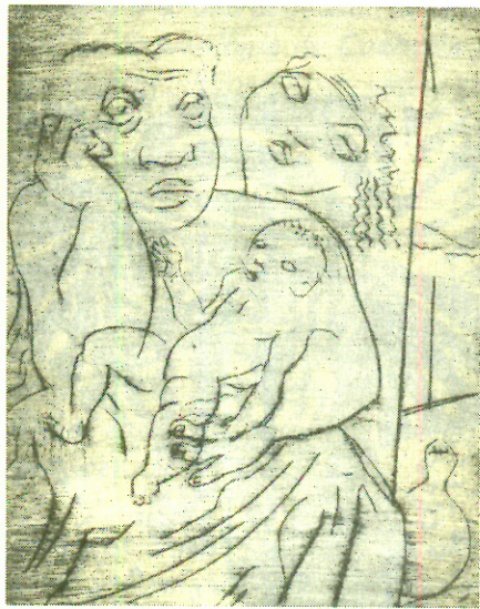
Cândido Portinari, Composición número 1 , Brasil.