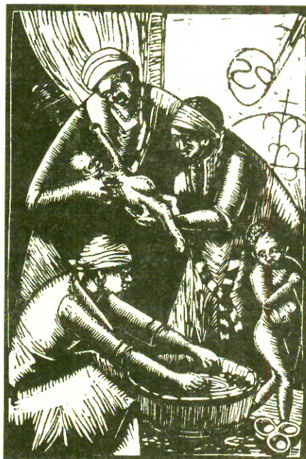
Petion Savain, Las abluciones de Navidad , Haití.

2 Ver convocatoria en este mismo número de Diario de Campo .