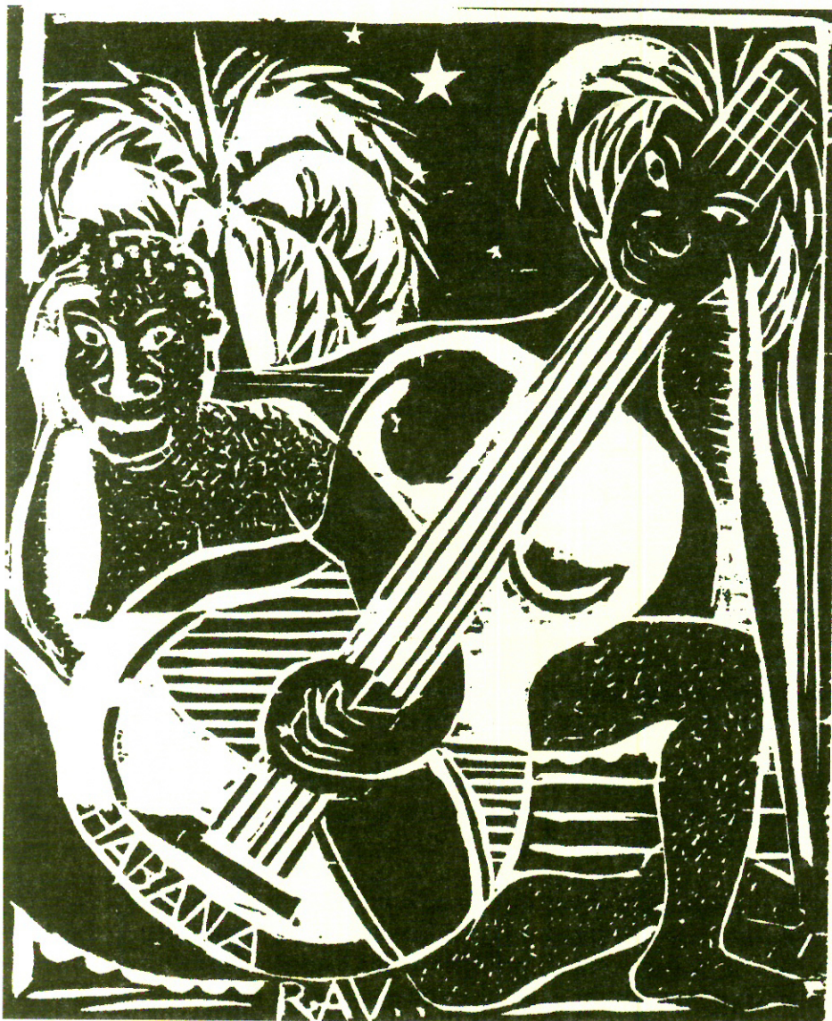
Domingo Ravenet, Noche tropical , Cuba.