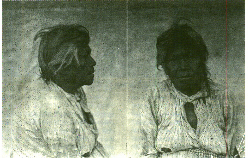
Anciana indígena retrato. 356 242

Departamento de Difusión Cultural TEMPLO MAYOR - INAH