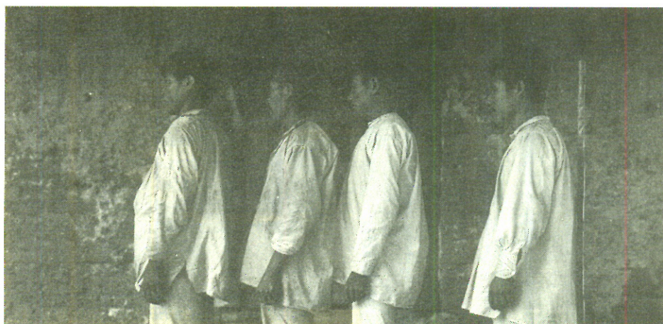
Hombres mixes perfil, Oaxaca. 351 261

En la sala 8 se muestran materiales coloniales encontrados en lugares aledaños al Templo Mayor, a través del Programa de Arqueología Urbana (PAU) NO SÓLO SON OBJETOS DEL PAU, SINO TODO LO COLONIAL QUE SE HA OBTENIDO INCLUSO ANTES DEL PAU. Destacan los objetos recuperados en las excavaciones más recientes de la Capilla de las ánimas de la Catedral Metropolitana.