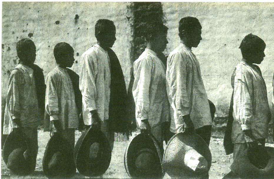
Hombre purépechas de perfil. 350 908

depositados en las ofrendas por su valor simbólico. Entre ellos, incluso, encontramos obras de épocas muy anteriores a la mexicana. En esta sala se exhiben objetos provenientes de la zona Mixteca, como es el grupo de figurillas de piedra verde, conocidas como penates y que representan, en su mayoría, al dios Tláloc. De la actual Oaxaca es un grupo de joyas hechas en oro y plata. Los objetos de coral, caracoles y concha, trabajada en relieve, son originarios del océano Pacífico, del Golfo de México y del Caribe mexicano. Resulta sumamente relevante un enorme grupo de piezas llegadas de la zona de Mezcala, en el actual Estado de Guerrero, que representan máscaras, cabezas y figuras humanas de cuerpo entero.