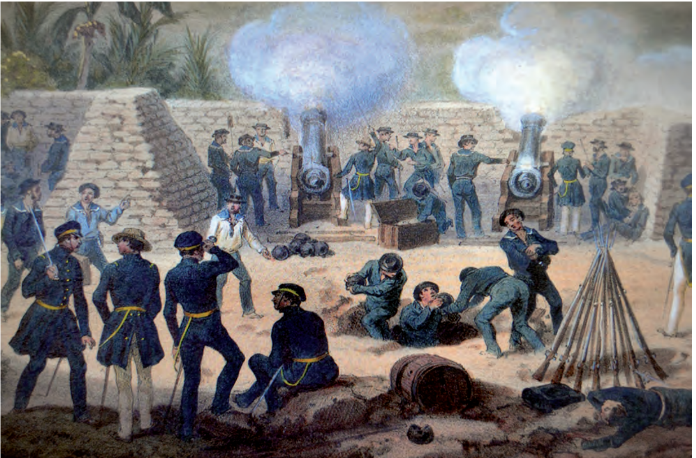
Karl Nebel, Bombardeo de Veracruz, 22-29 de marzo de 1847 (detalle) siglo XIX, litografía