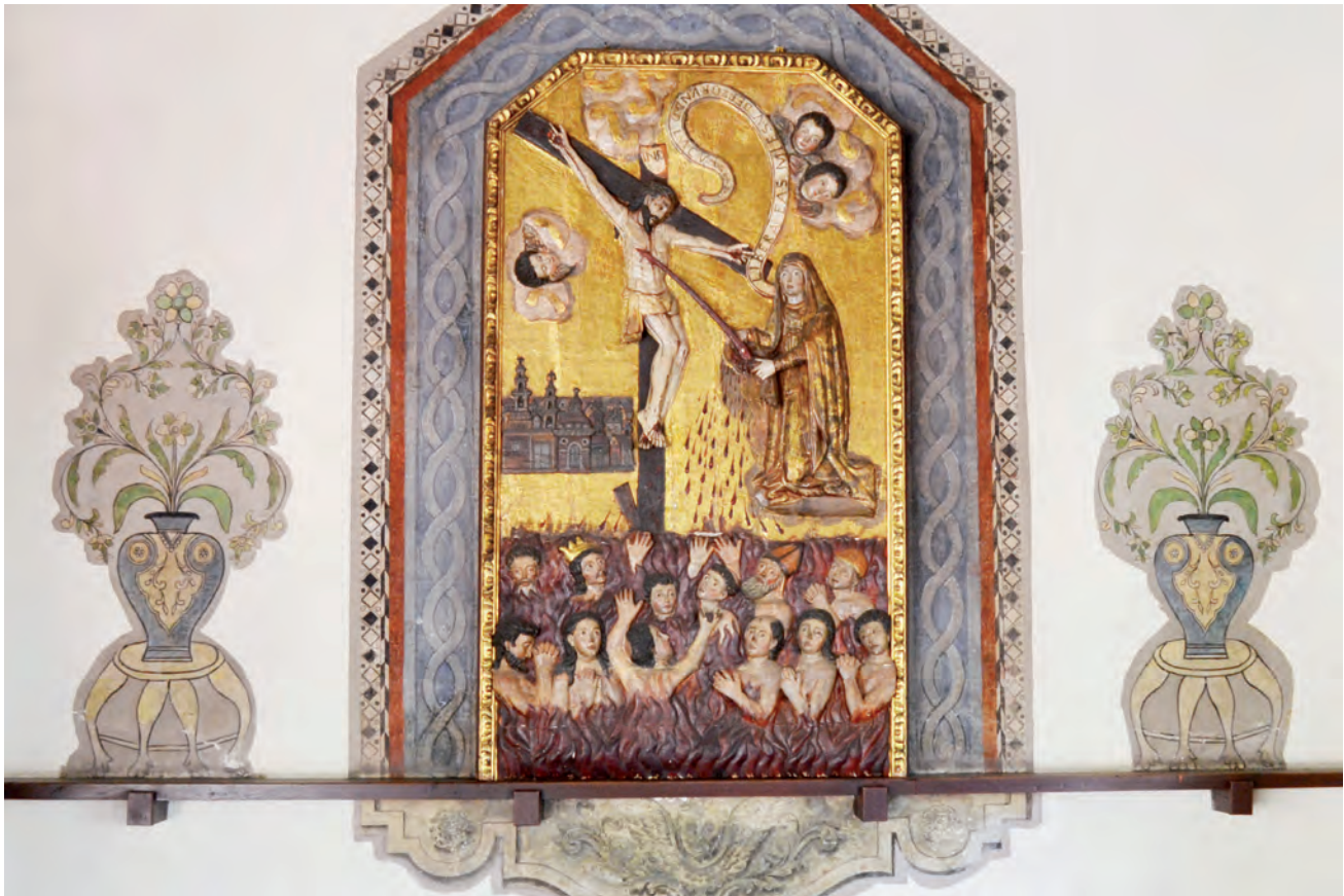
Autor no identificado, Retablo la redención de las ánimas del purgatorio, fragmento , siglo XVII