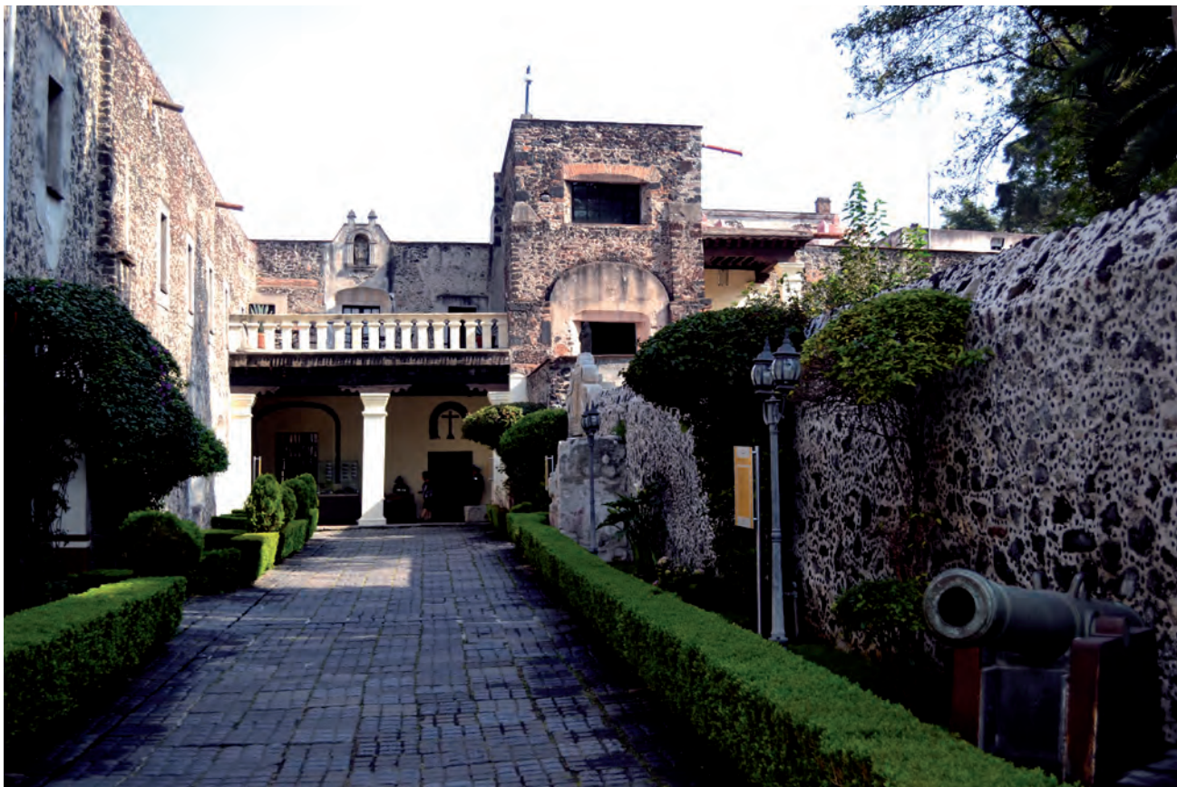
Patio de acceso al Museo Nacional de las Intervenciones, 2013