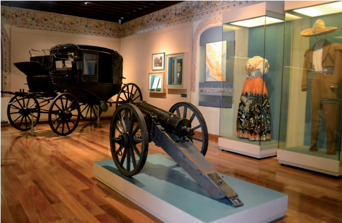
Sala Intervención Francesa 1862-1867, Museo Nacional de las Intervenciones, 2013