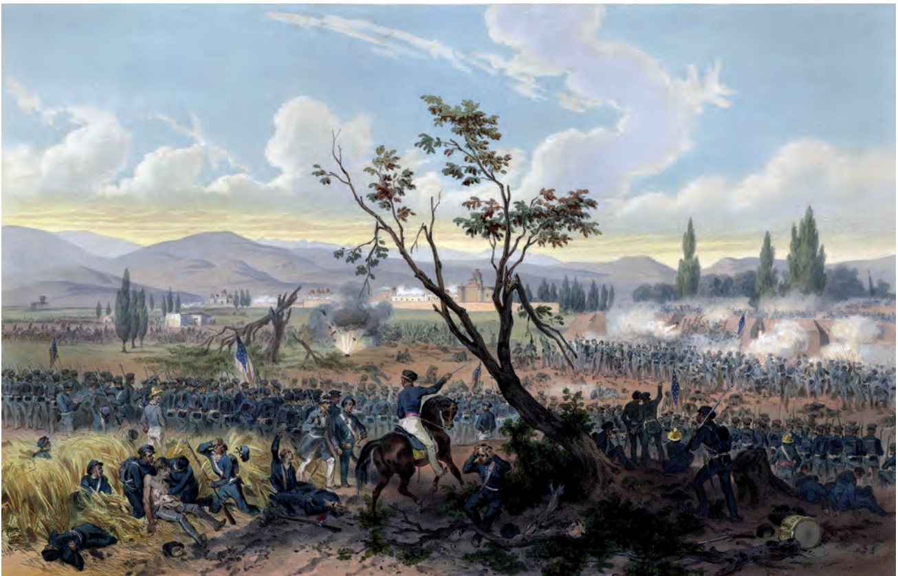
Karl Nebel, Batalla de Churubusco . 20 de agosto 1847, siglo XIX, litografía