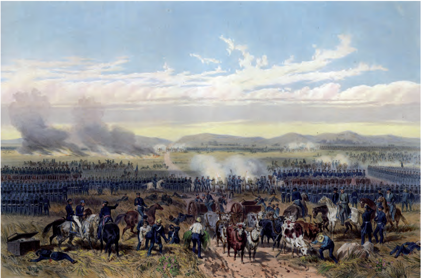
Karl Nebel, Batalla de Palo Alto, 8 de mayo de 1846 , siglo XIX, litografía