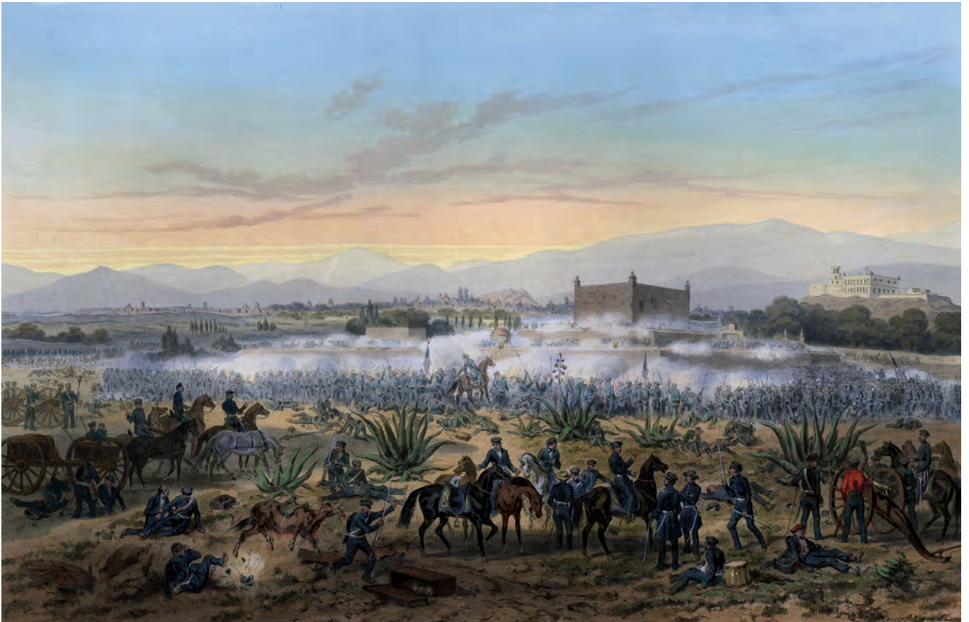
Karl Nebel, Batalla del Molino del Rey. 8 de septiembre 1847 , siglo XIX, litografía Imagen Colección MNI-INAH