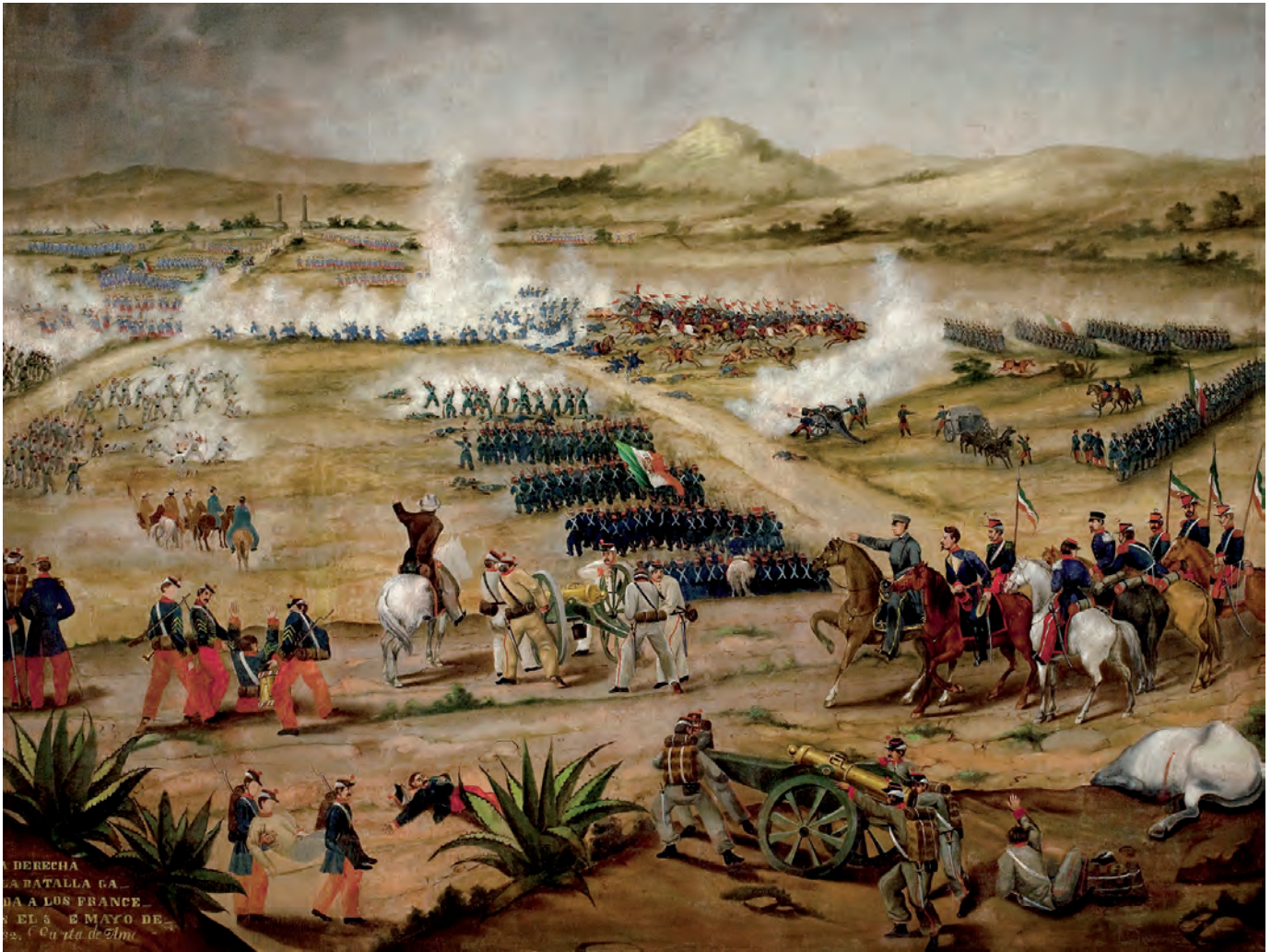
Autor no identificado, Batalla del 5 de mayo de 1862 , 1870, óleo sobre tela