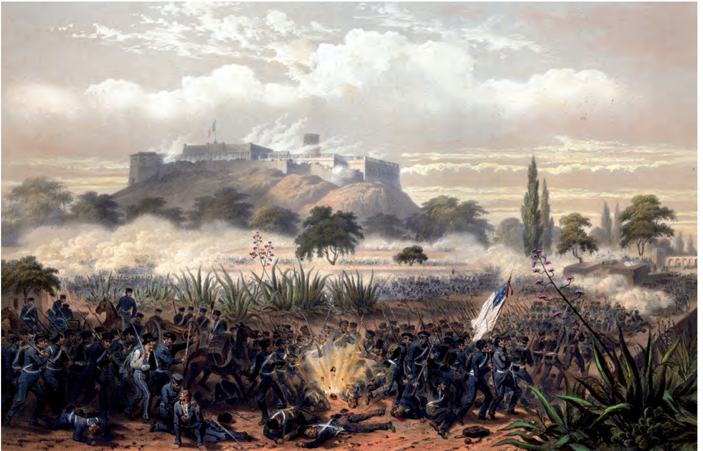
Karl Nebel, Batalla de Chapultepec . 13 de septiembre 1847, siglo XIX, litografía