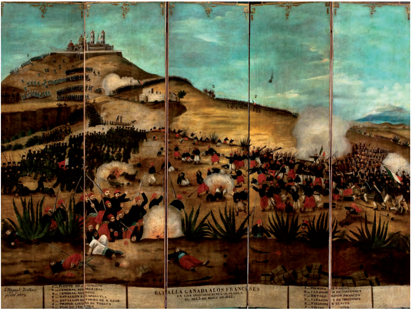
Batalla ganada a los franceses, siglo XIX, biombo