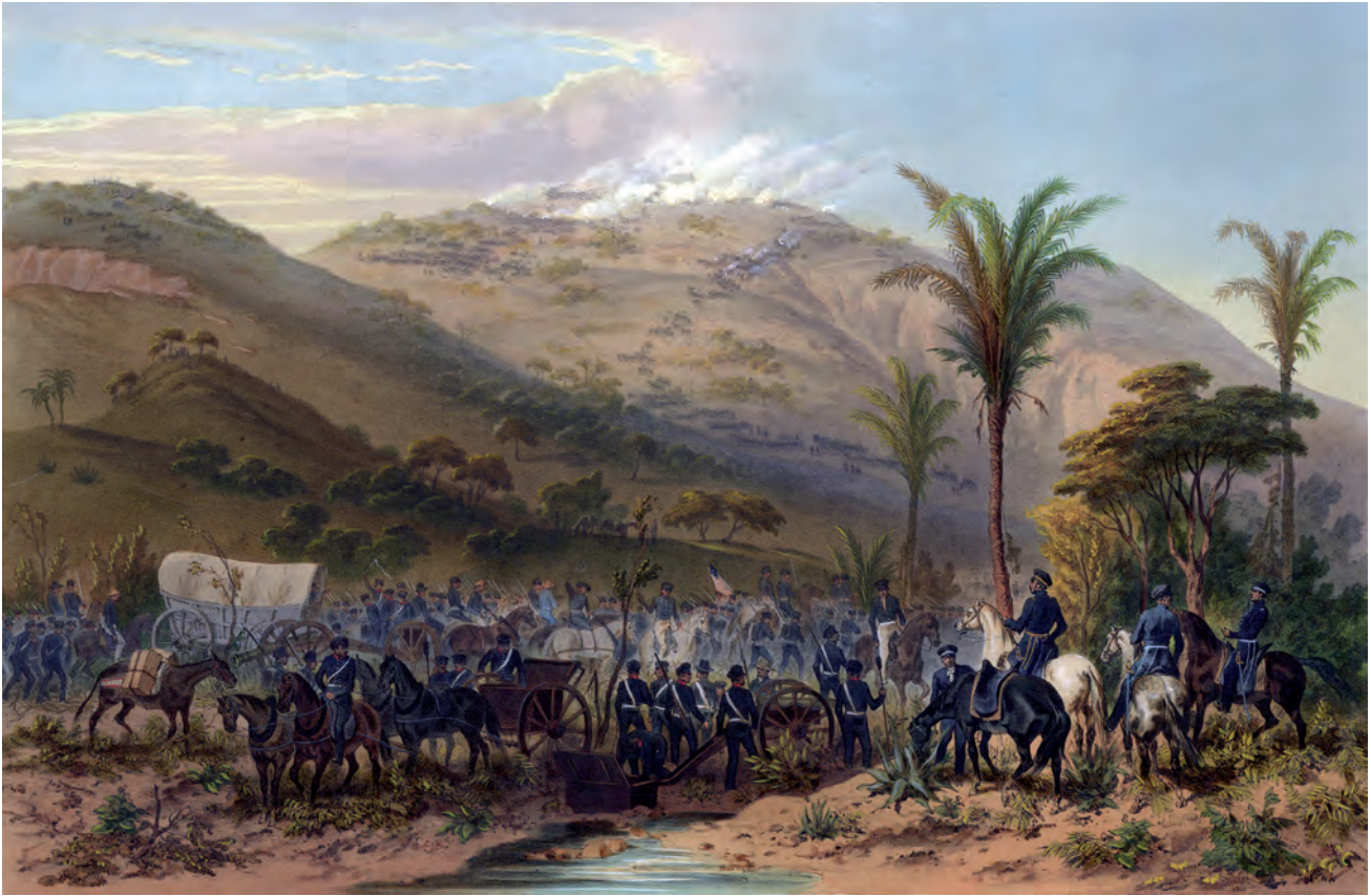
Karl Nebel, Batalla de Cerro Gordo . 18 de abril 1847, siglo XIX, litografía