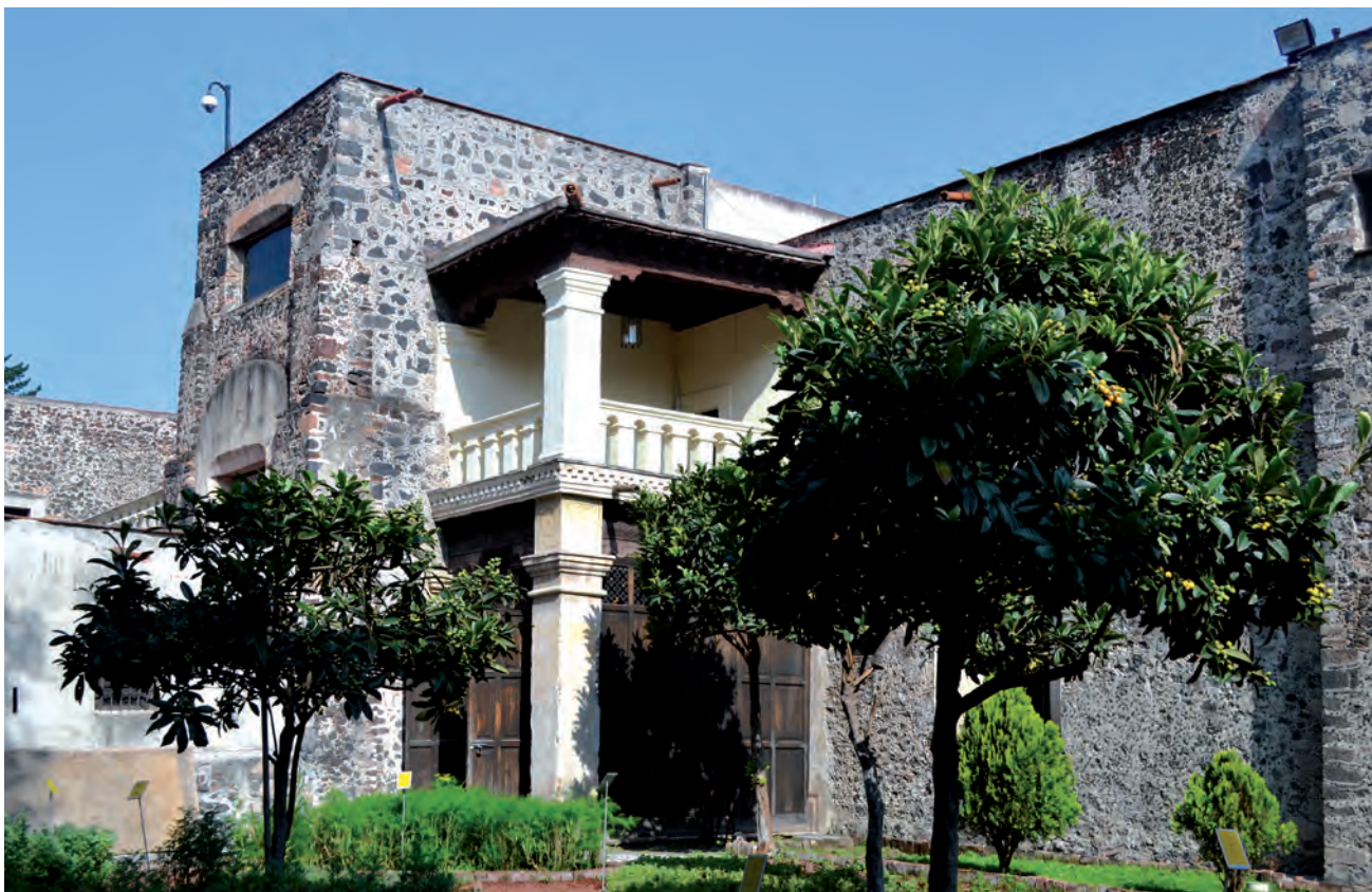
Museo Nacional de las Intervenciones, toma desde el huerto, 2013