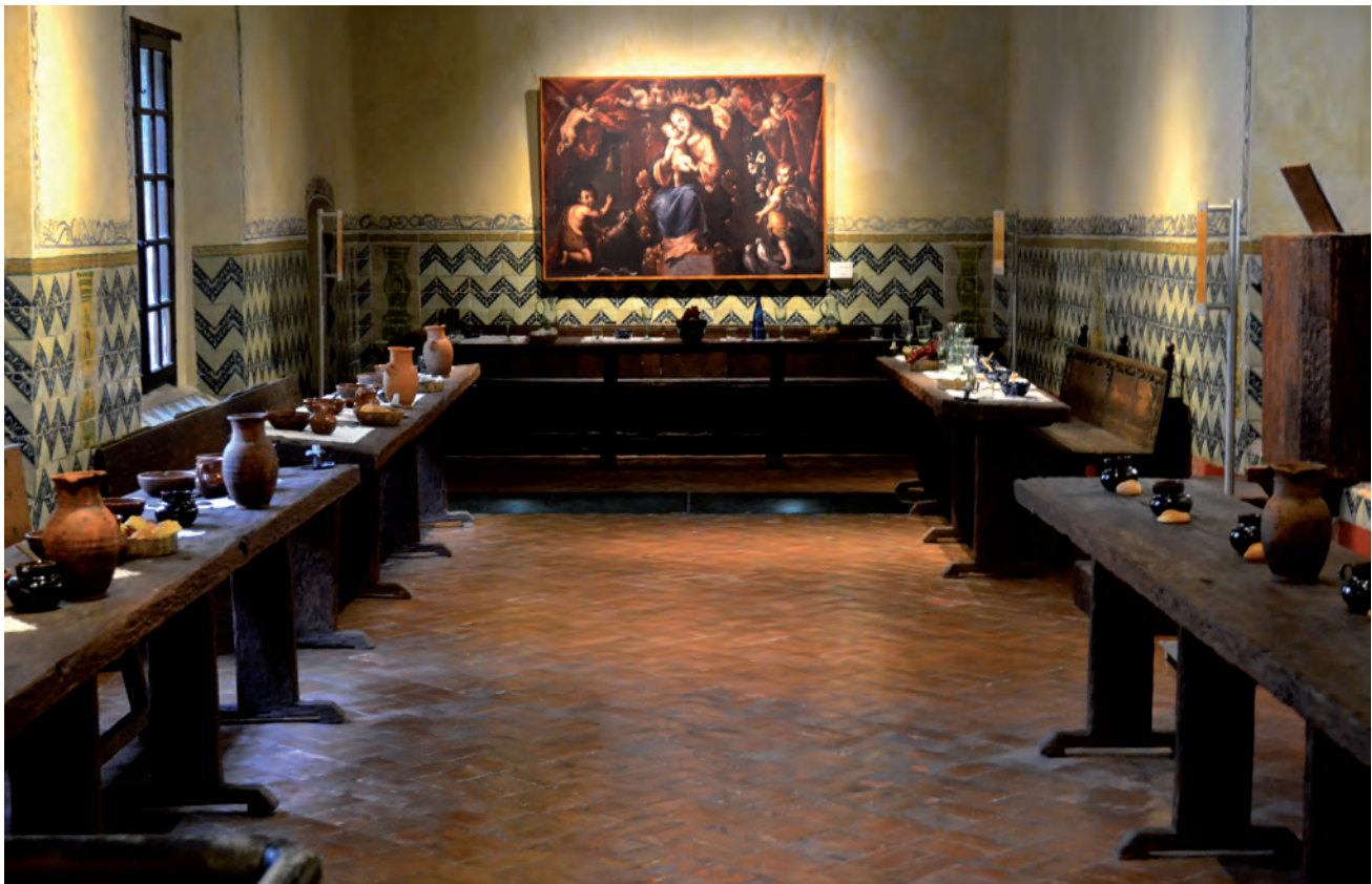
Sala Refectorio del Convento , Museo Nacional de las Intervenciones, 2013