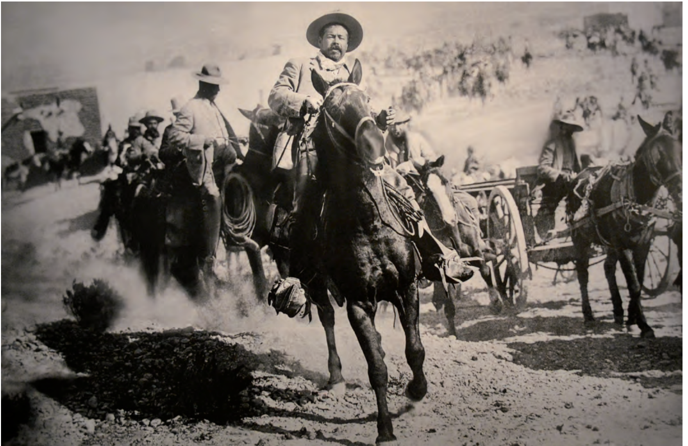
Autor no identificado, Francisco Villa a caballo, Torreón, Coahuila , 1914 Fotografía Archivo Casasola, Sinafo-Fototeca Nacional del INAH