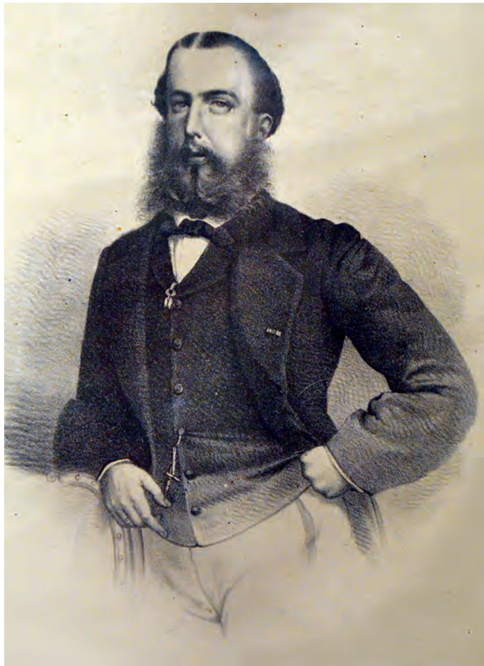
L. Nieve, Maximiliano de Habsburgo , 1865, litografía