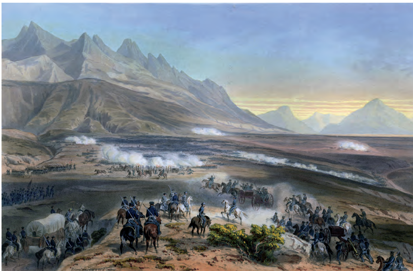
Karl Nebel, Batalla de Buena Vista. 23 de febrero 1847 , siglo XIX, litografía Imagen Colección MINI-INAH

K arl Nebel nació en la ciudad alemana de Altona, en la actual provincia de Hamburgo, el 19 de marzo de 1805. Tras cursar estudios de arquitectura en París, a los 24 años viajó a México por primera vez. Durante aquella estancia de cinco años en este país realizó una carpeta de 50 ilustraciones costumbristas que publicaría en París en 1835, con un prólogo de Alexander von Humboldt. En 1847, cuando ya era un ilustrador famoso, volvió a México para retratar algunos de los episodios clave de la intervención estadounidense, los cuales sirvieron para ilustrar la publicación The War between the United States and Mexico Illustrated , de 1851. Murió en París el 4 de junio de 1855.