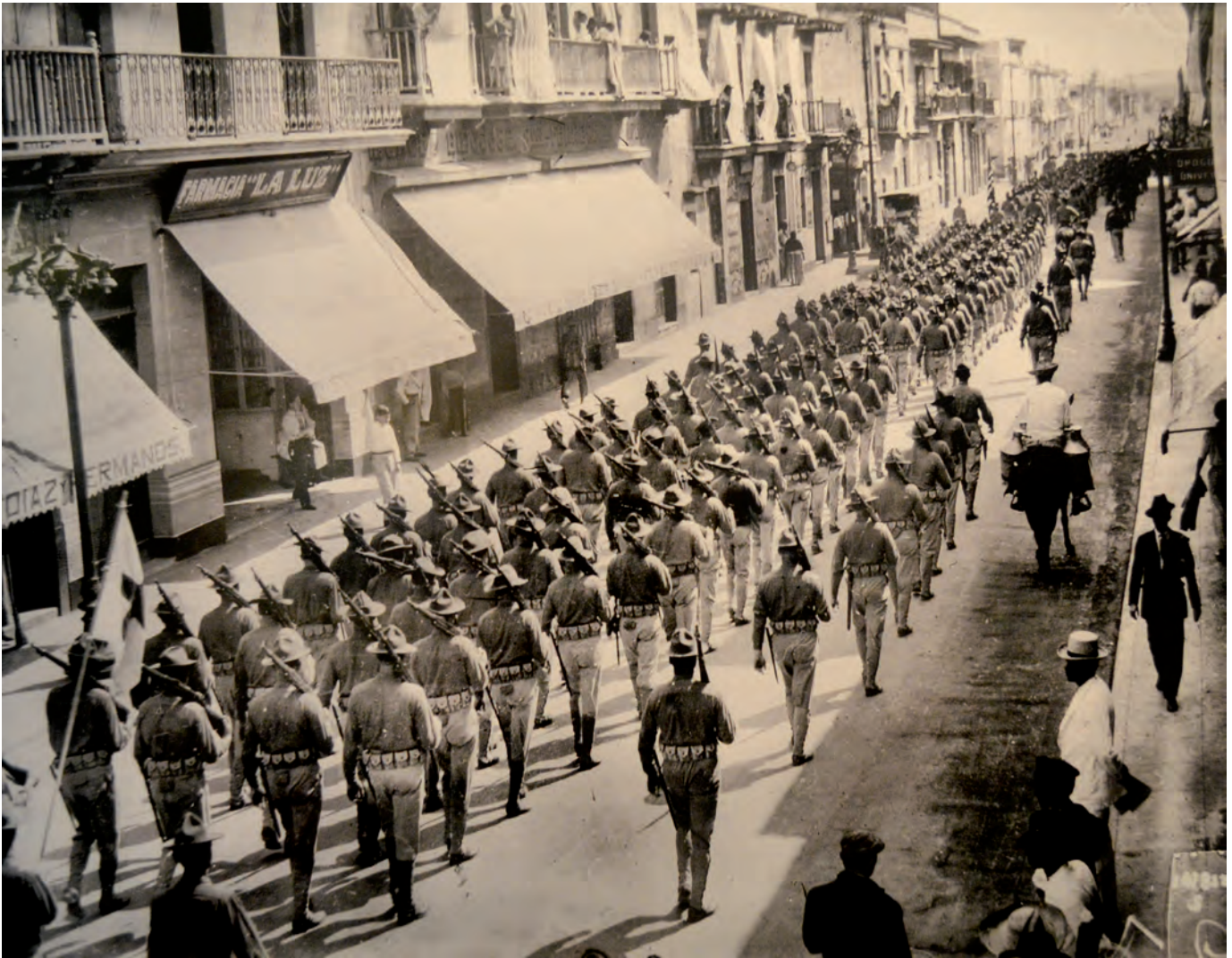
Autor no identificado, Soldados norteamericanos desembarcan y entran a la ciudad de Veracruz, 1914 , negativo en original en placa de vidrio Fotografía Colección MNI-INAH