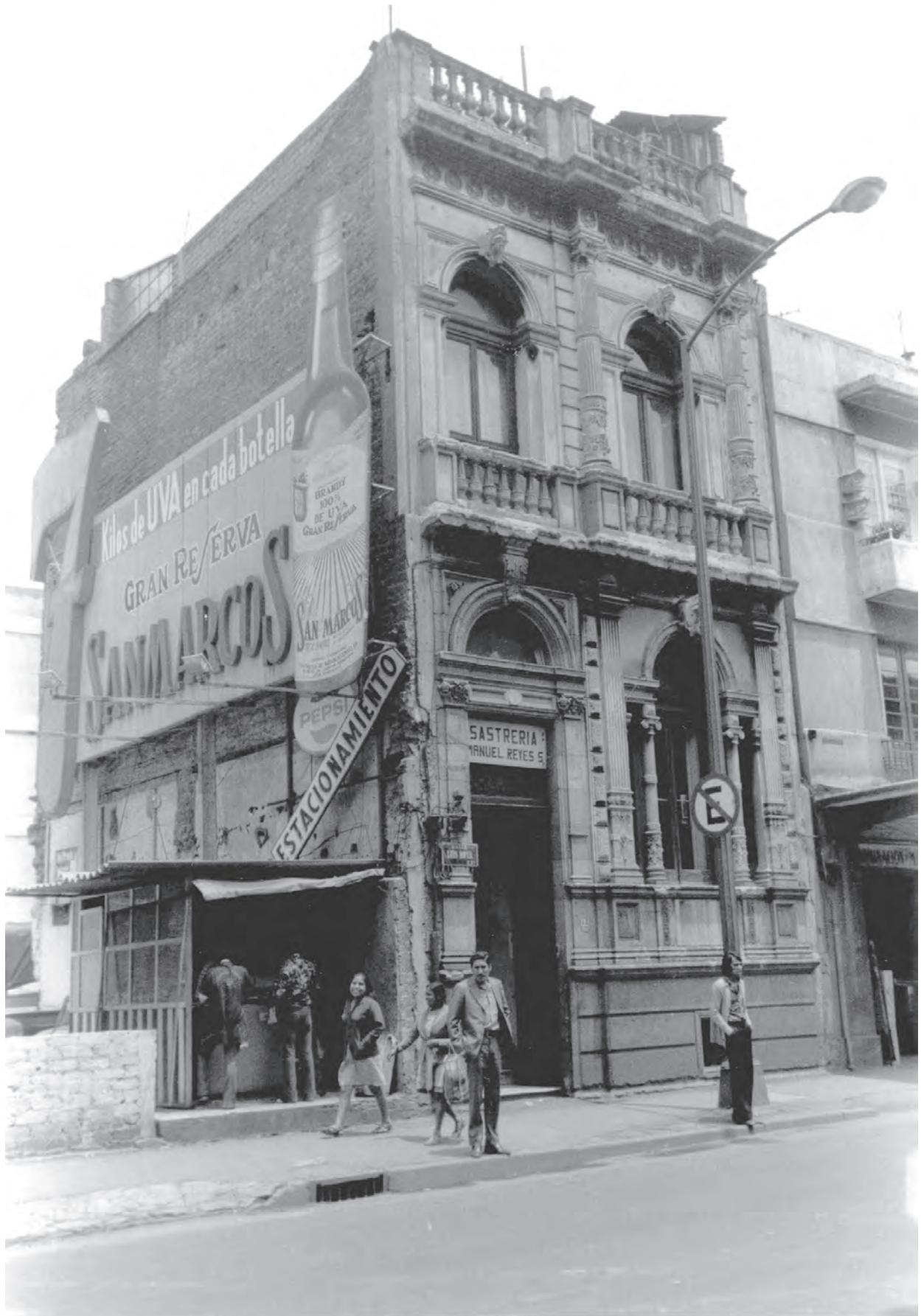
Calle Luis Moya núm. 53, 1970-1974