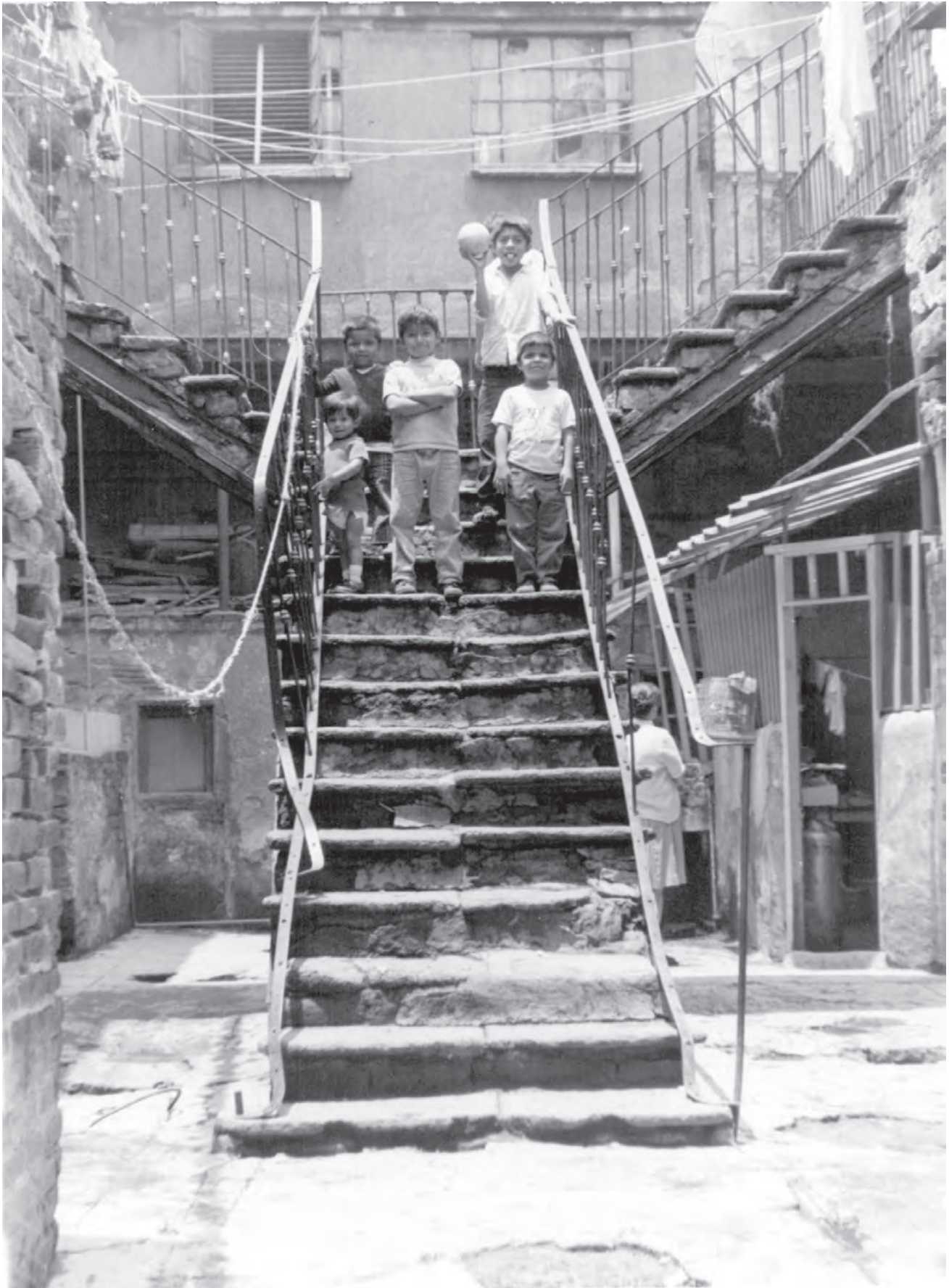
Interior, calle República de Ecuador núm. 103, 1970-1974