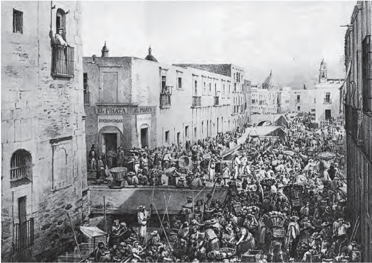
Casimiro Castro, Litografía de la ciudad de México