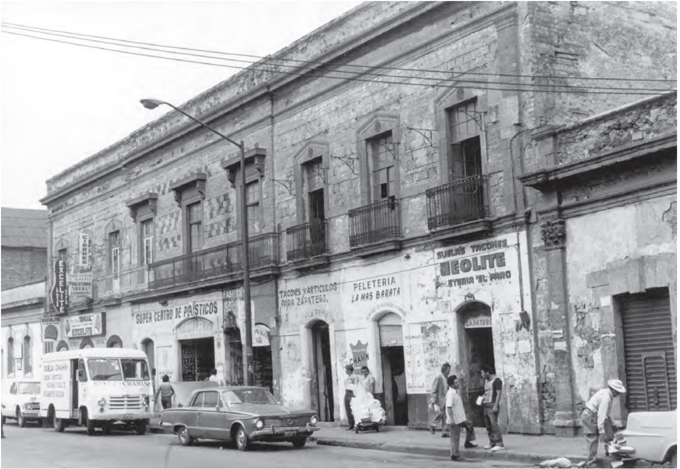
Calle Jesús Carranza núm. 24