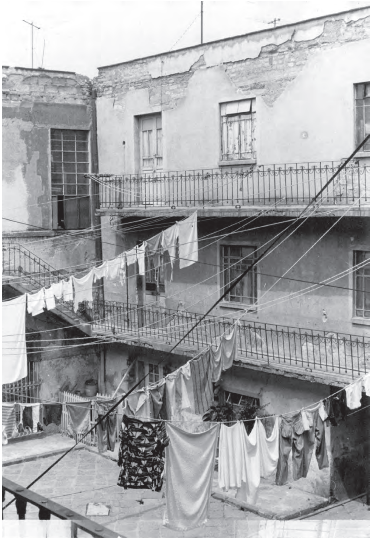
Interior, calle Jesús Carranza núm. 24