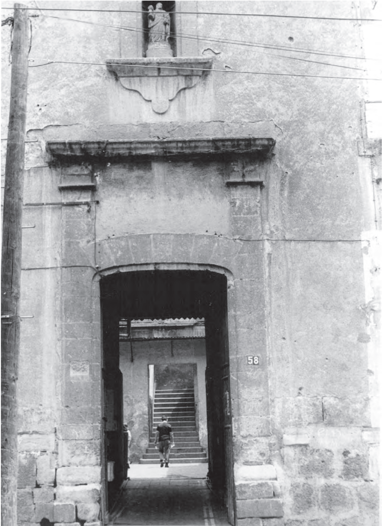
Fachada, calle República de Bolivia núm. 58