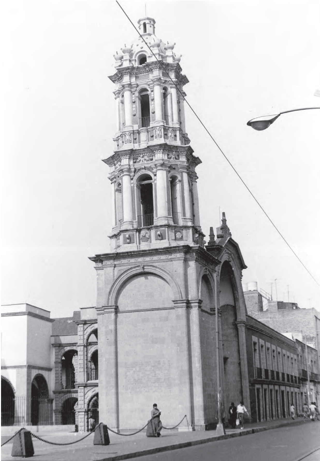
Calle República de El Salvador núm. 47