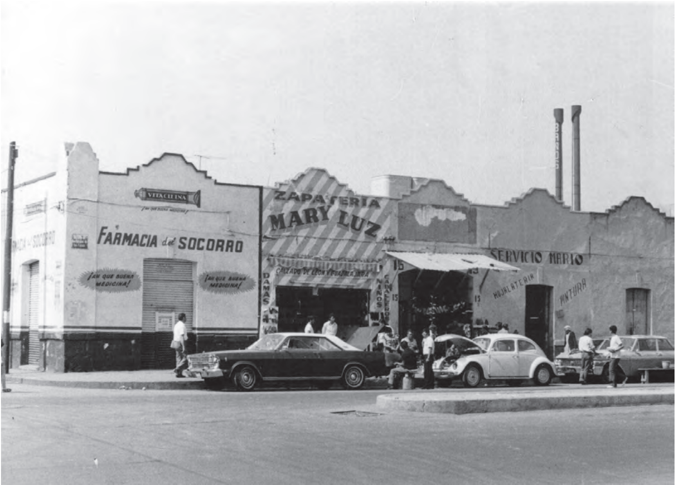
Calle Fray Bartolomé de las Casas núm. 15 esquina con Tenochtitlán