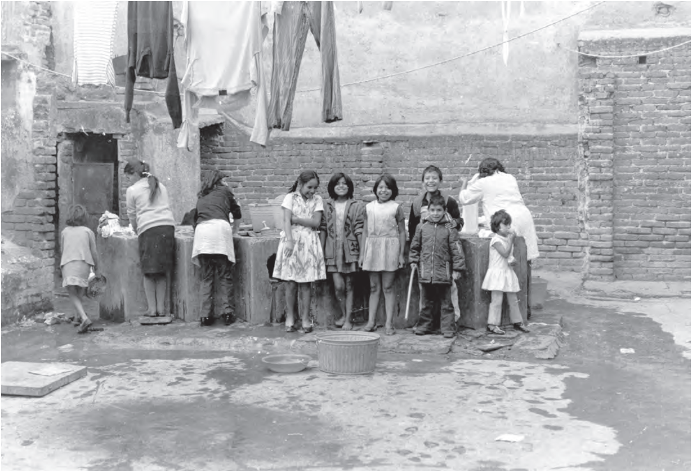
Interior, callejón Lecheras, 1970-1974