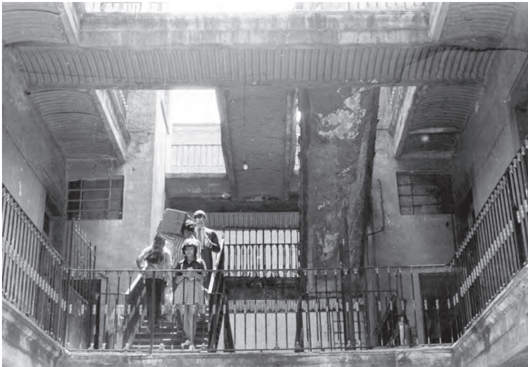
Interior, calle República de Argentina núm. 99