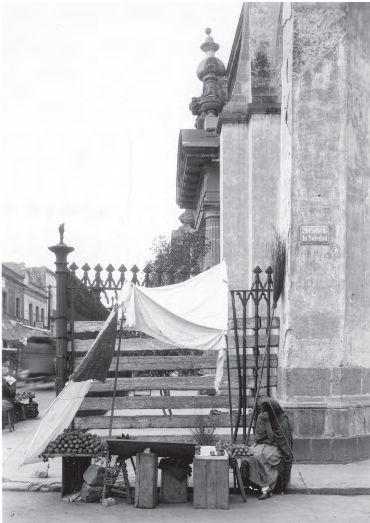
Calle Soledad esquina con Jesús María