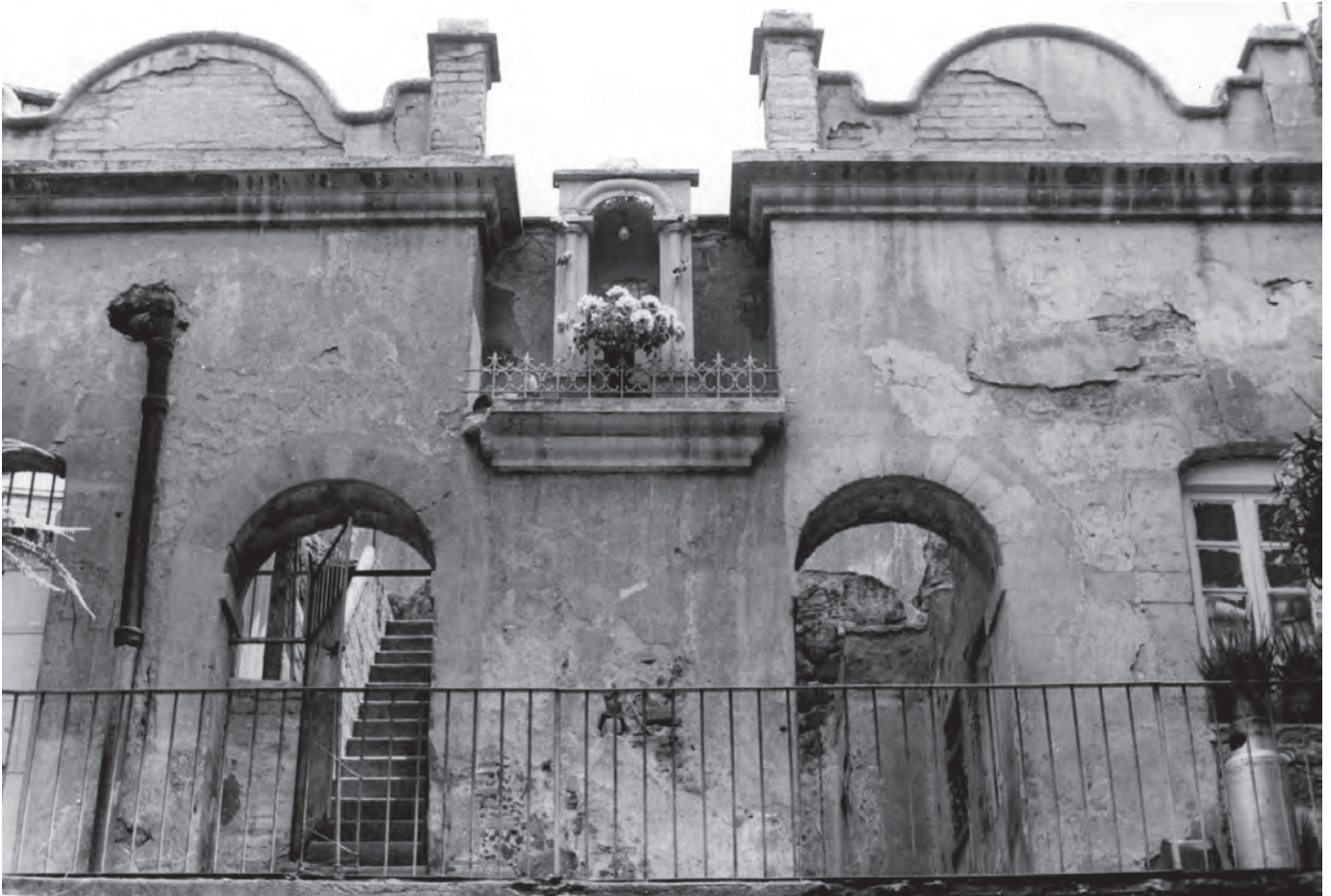
Interior, calle República de Bolivia núm. 58