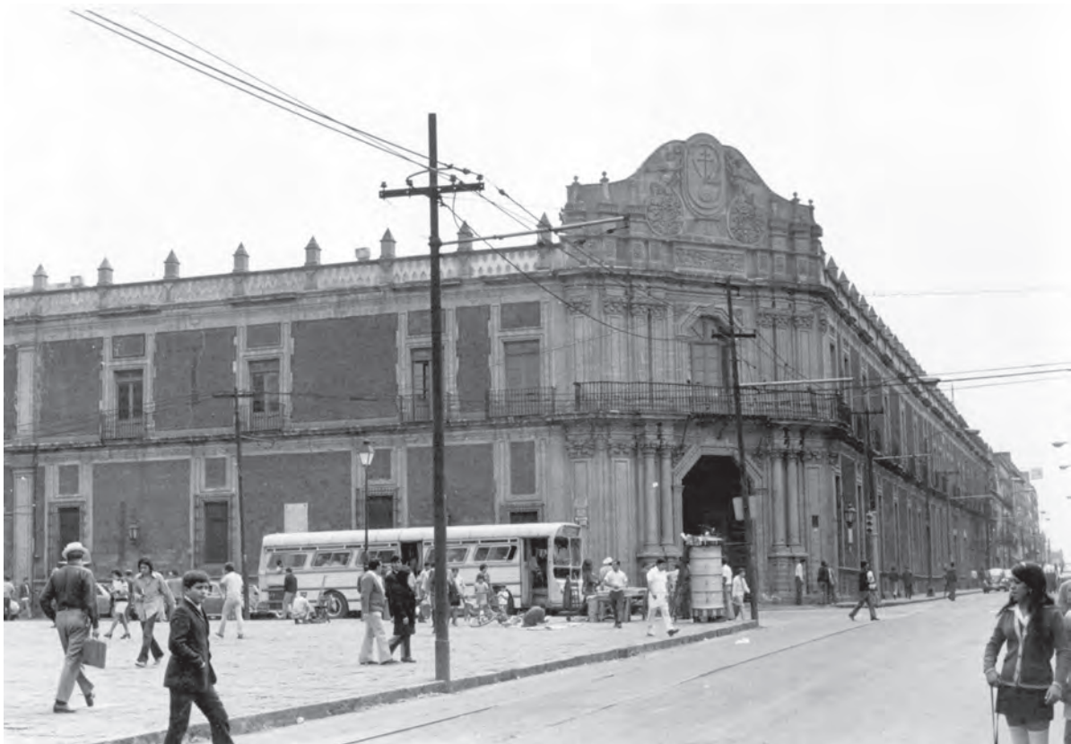
Comparativo, calle República de Brasil esquina con República de Venezuela, 1970-1974