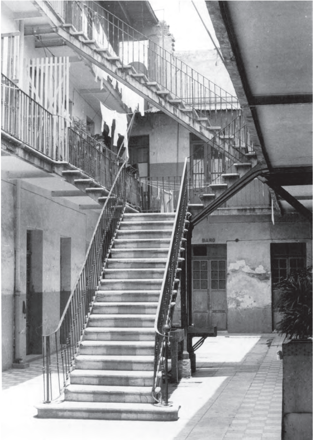
Interior, calle República de Colombia núm. 46