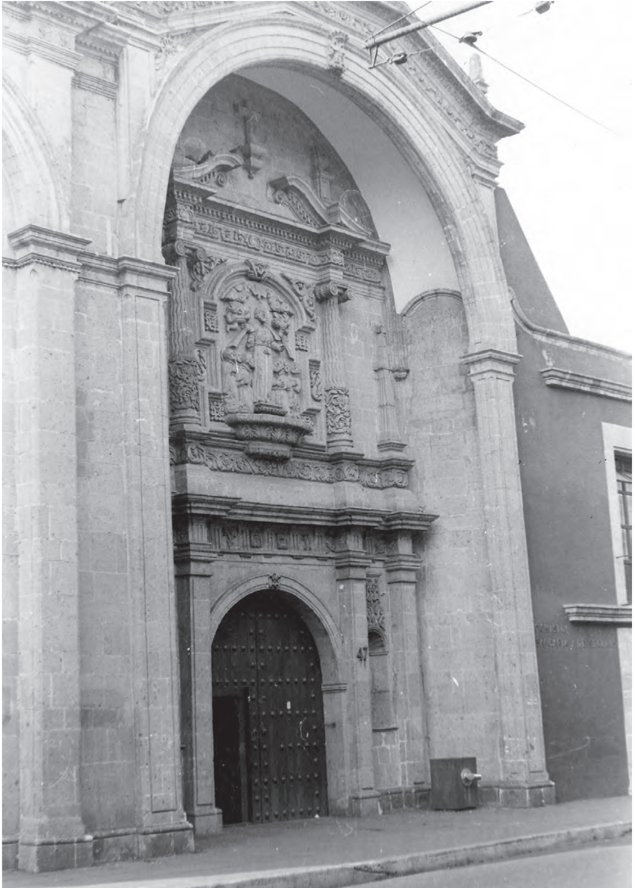
Comparativo, fachada del templo de San Felipe Neri, calle República de El Salvador