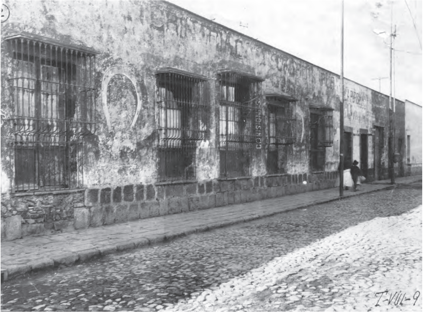
Calle Soledad núm. 65