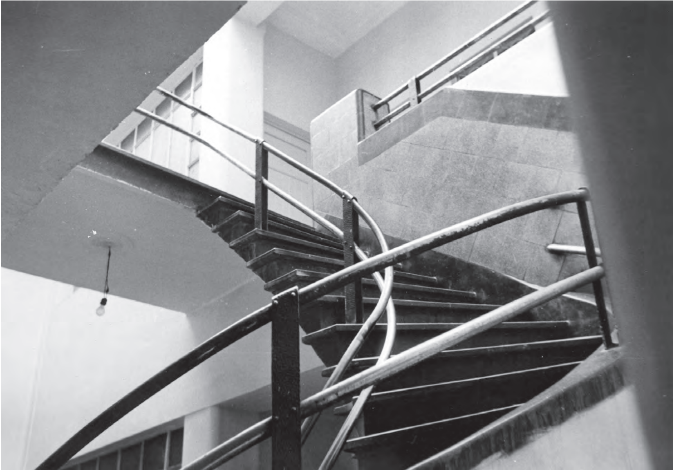
Interior, calle Artículo 123, 1970-1974