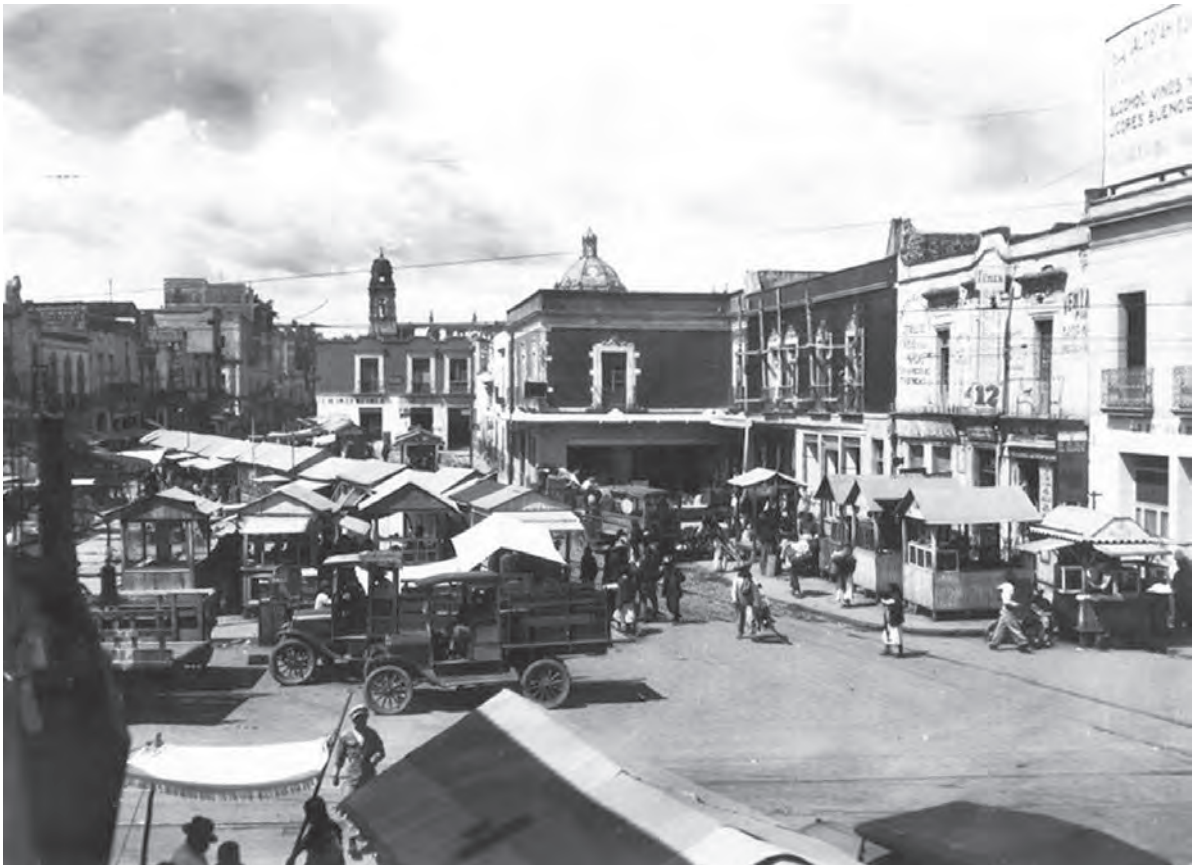
Comparativo, calle Roldán