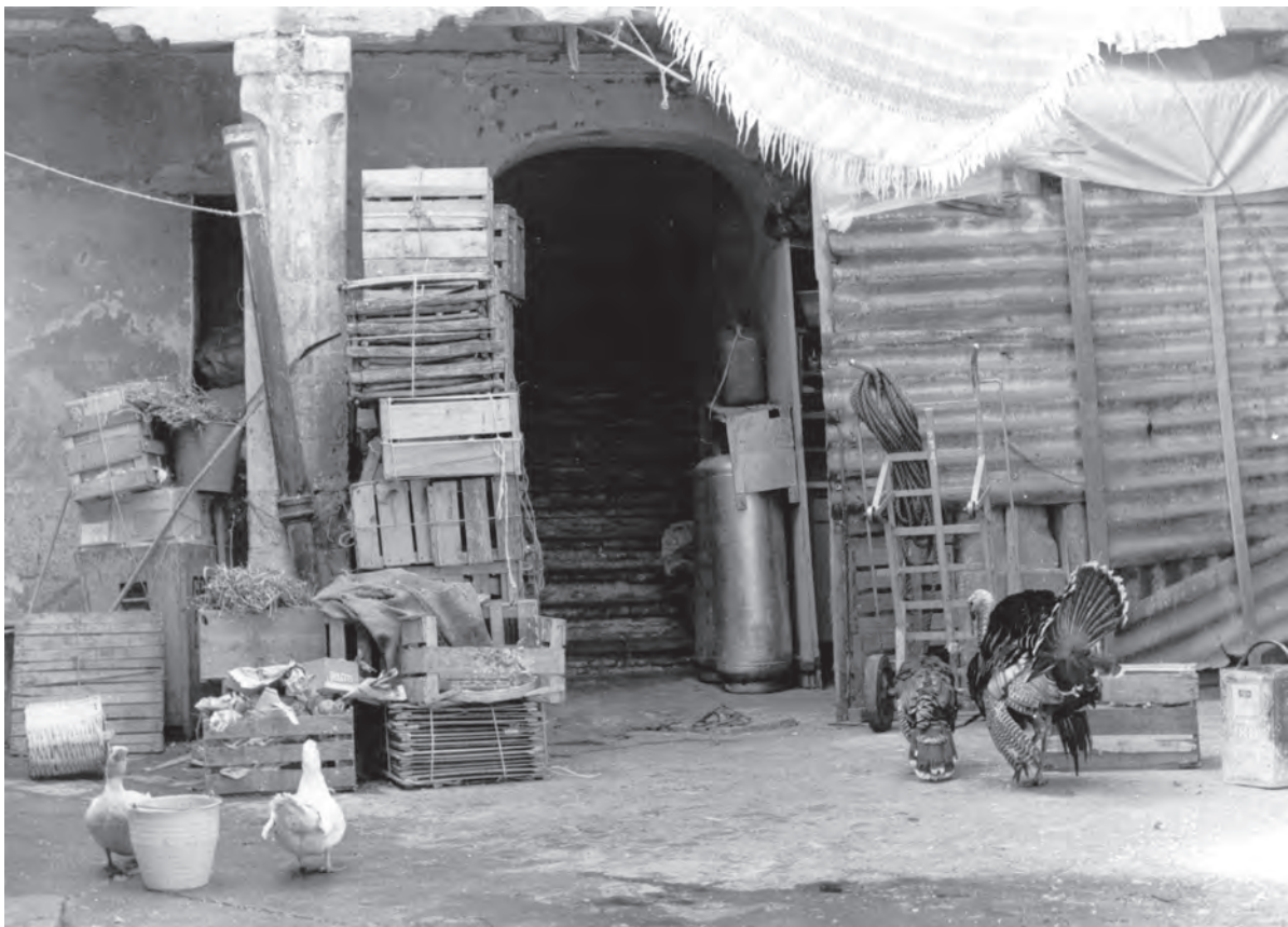
Interior comparativo, calle República de Uruguay núm. 183, 1970-1974