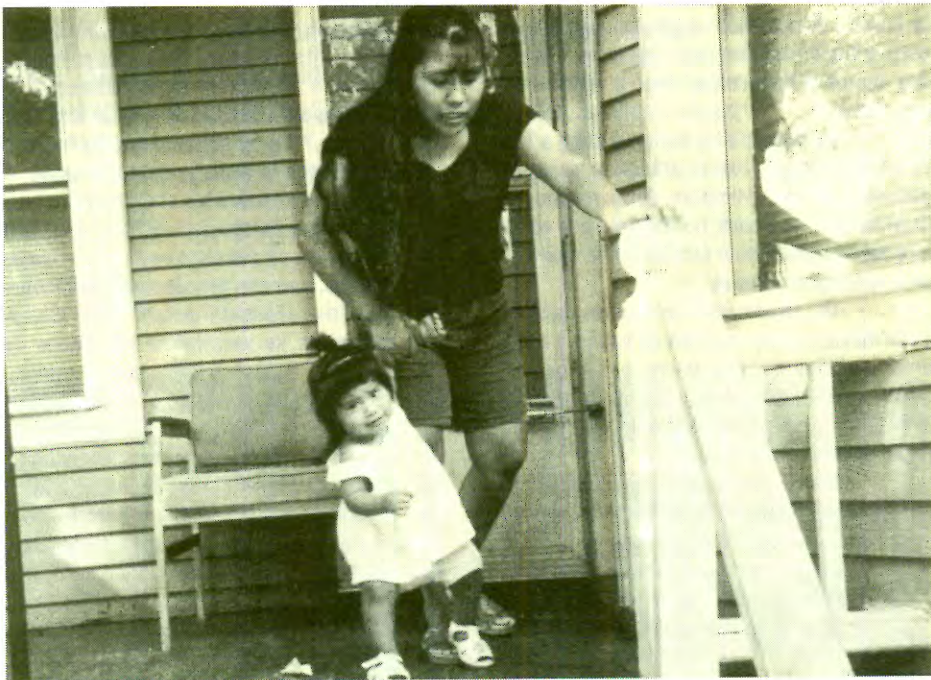
Vida doméstica. Waukegan, Illinois, 2000.

El compadrazgo fue una institución que se fortaleció a lo largo del XVII aunque apareció antes, y fue el resultado de la alta mortalidad masculina; su finalidad era que los compadres sobrevivientes cuidaran de la viuda y los huérfanos.