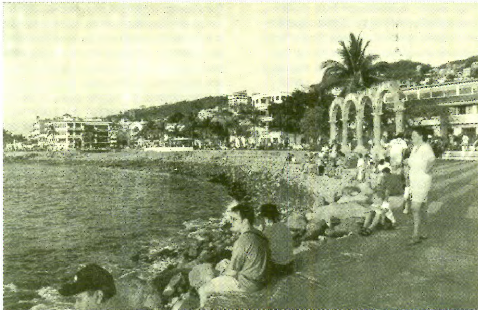
Puerto Vallarta, enclave nacional de los temalaquenses. 2001.