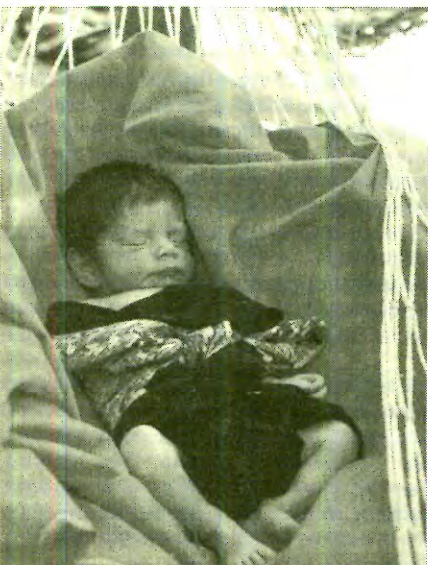
Paraqueno se vaya lejos, Temalac, Gro. 2002.

Antes ya dijimos que estas fórmulas familiares continuaron en el siglo XIX, y fue hasta la Constitución Juarista cuando el matrimonio dejó de considerarse un sacramento para ser visto como un contrato; pero esto es harina de otro costal.