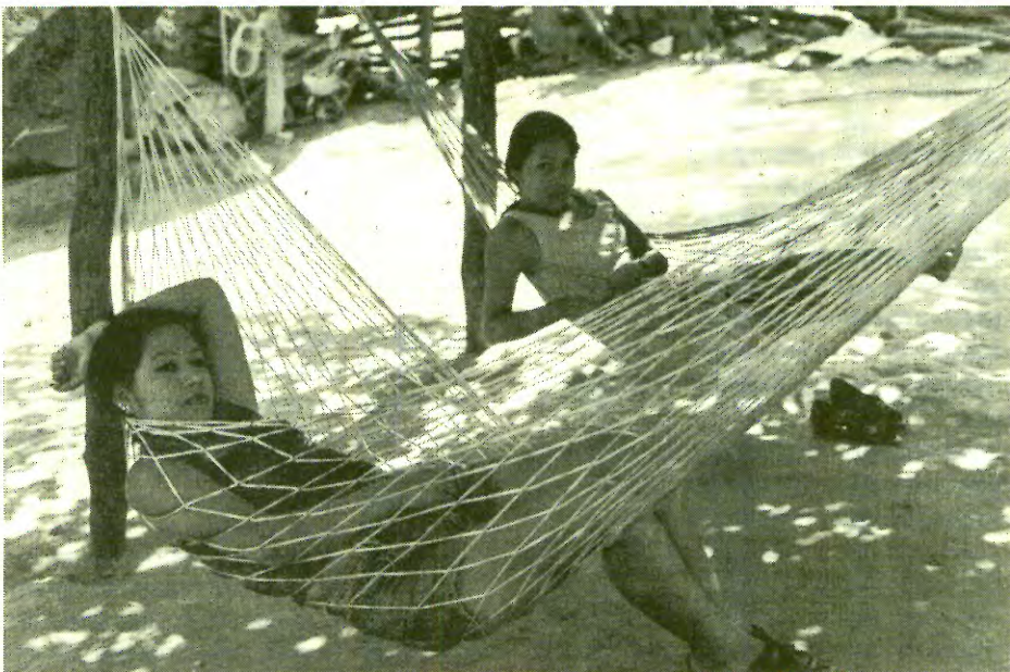
La hermana que ha salido del pueblo y la que no. Temalac, Gro.

La jurisprudencia colonial manejó a la familia como la base y el control de la sociedad. El jefe era el representante legal ante el Estado hispano. Políticamente fue un mecanismo de poder, y entre los nobles funcionó como el Estado mismo, verbigracia la familia Habsburgo. El rey era el paterfamilia de todos, y en la sociedad, el padre era la figura del rey. 24 La familia era también la célula de la economía y formaba unidades de trabajo, ya que el padre enseñaba su oficio a los hijos hombres. Así, entre más grande era una familia resultaba más poderosa y presentaba mayor defensa social y política.