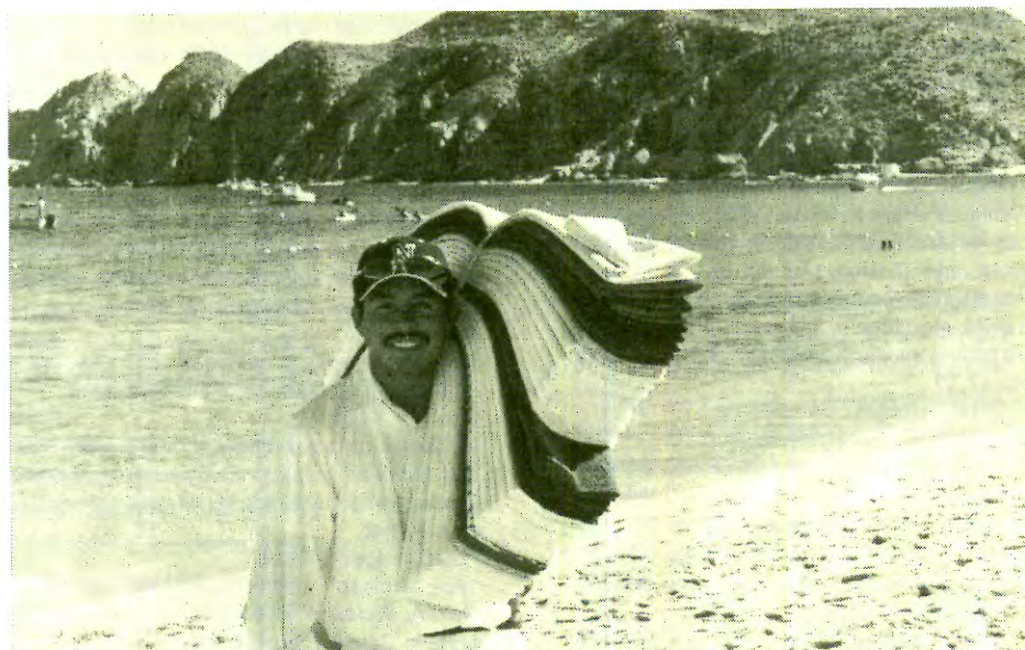
Temalaquense vendedor de manteles en Cabo San Lucas, B.C.

1989a Las castas mexicanas. Un género pictórico americano , México, Olivetti.