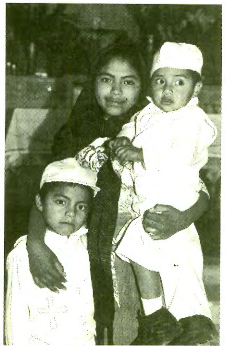
Bautizo en Temalac, Gro. 2000.