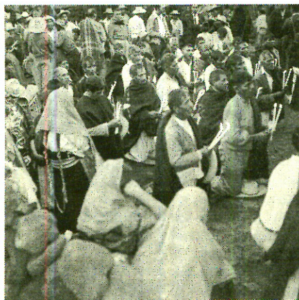
San Lorenzo, Michoacán, purépechas, 1962-1963.