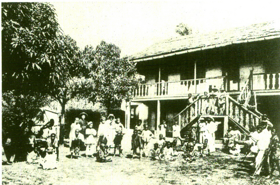
Antigua escuela de Libreville a principios del siglo XX.

Para comprender la interrelación de los itzaes con otros pueblos no conquistados, se compararán los distintos sistemas de organización social, política y religiosa. Aunque de entrada se puede decir que todos estos grupos compartían rasgos culturales similares. Sin embargo, las relaciones entre estos grupos fueron más bien hostiles ya que los itzaes persistentemente trataron de someterlos. No obstante sus diferencias, todos estos pueblos se opusieron a la penetración hispana a sus territorios. Un estudio cuidadoso nos permitirá mostrar un panorama completo de las formas de organización de estos grupos y de qué