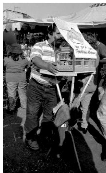
La Feria. Fiesta patronal en Ecatepec Estado de México, 2002.

1999 Ministros de lo Sagrado Sacerdotes feligreses en el México del siglo XVIII , México, El Colegio de Michoacán, Secretaría de Gobernación, El Colegio de México, Vol. II, pp 449-481.