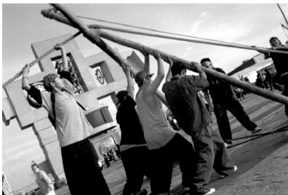
Escenario para la danza de los Maromeros de Guerrero, en la Basílica de Guadalupe. México, D. F., 12 de diciembre 2002.

También ofrecían ciertos beneficios personales o sociales, por ejemplo «...llegar a tener un entierro digno en el que se le inquiera al cuerpo del cofrade muerto todos