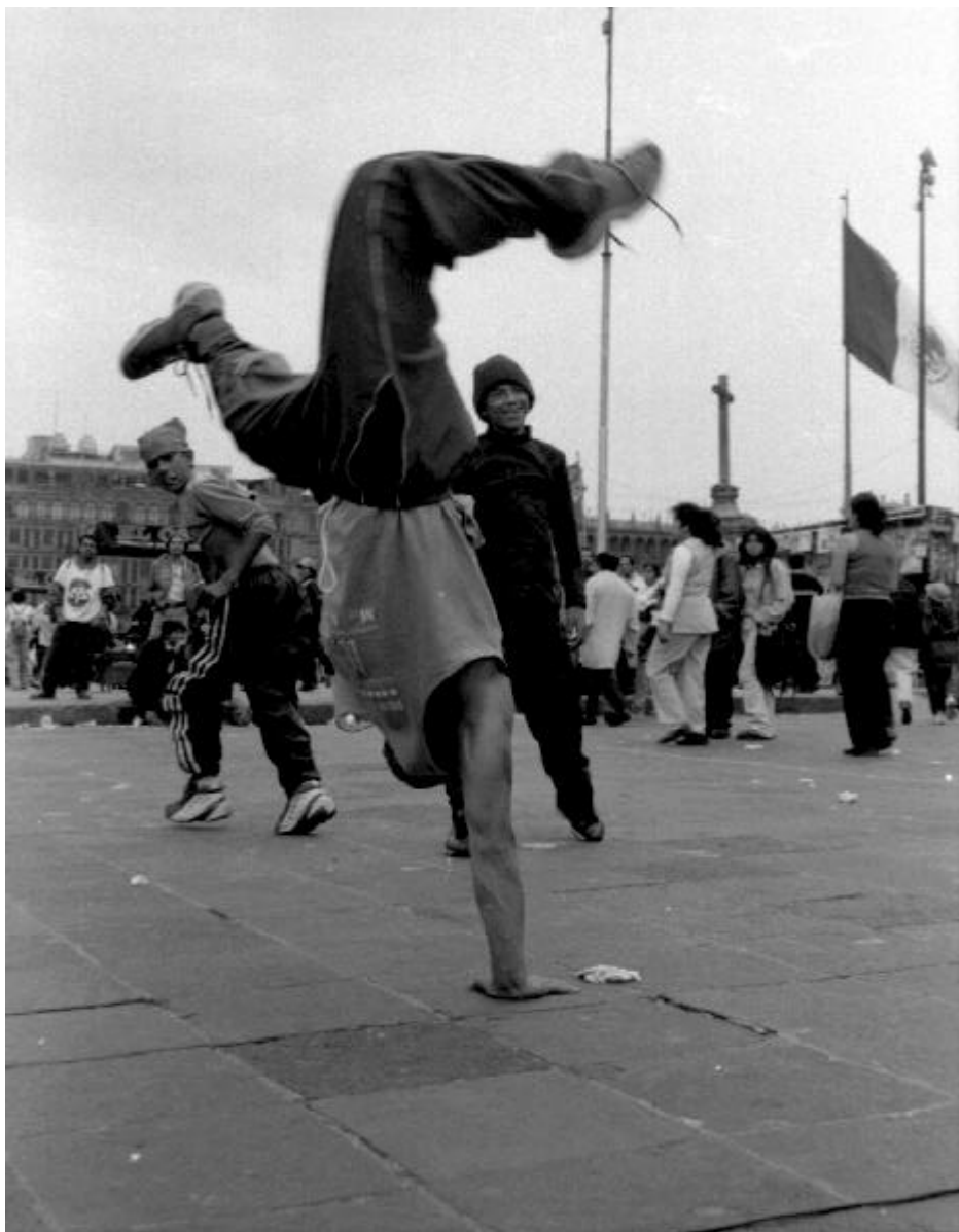
Oficios callejeros. «Bailarines de Break Dance». México, D. F., 2002.