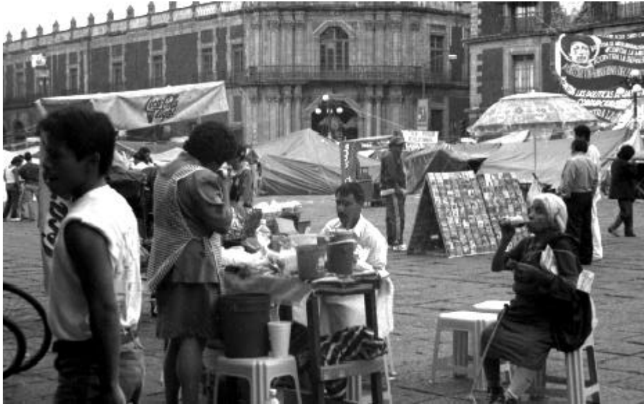
Oficios callejeros. Plaza de Santo Domingo, México, D. F., 2002.

por la sociedad novohispana y las autoridades civiles y eclesiásticas.