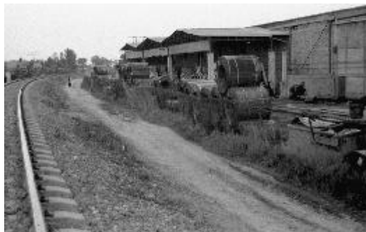
Un camino más... Ecatepec, Estado de México, 2002.