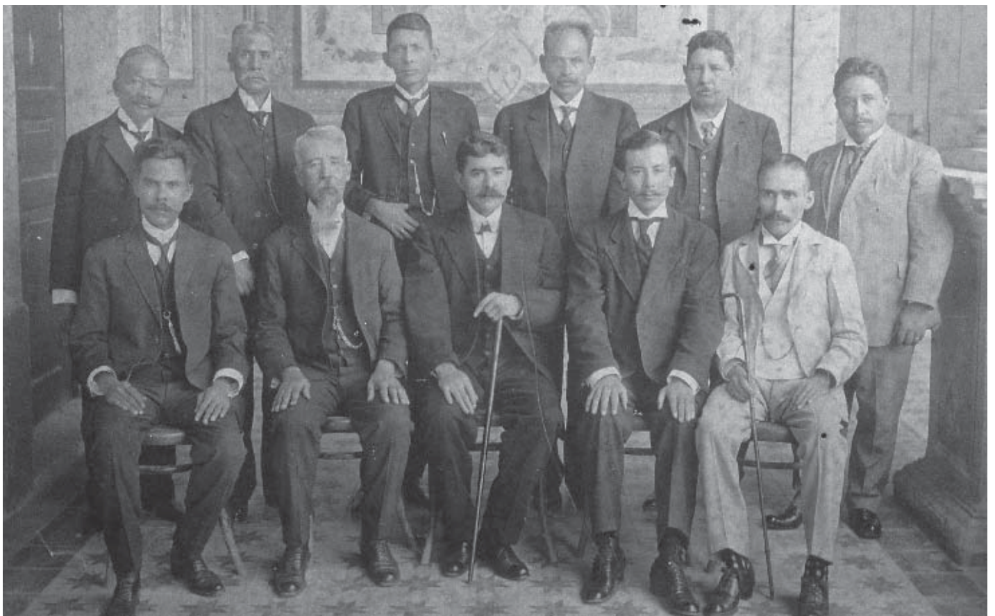
XXII Congreso Constitucional del Estado de Guerrero. Después del triunfo maderista, 1911

V. Análisis semiótico del material arqueológico.