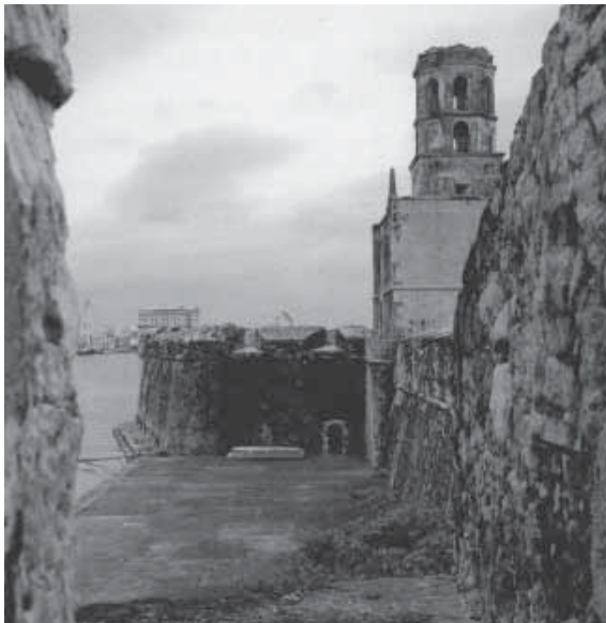
El combate sostenido en San Juan de Ulúa entre las flotas del virrey Martín Enriquez de Almanza y el corsario John Hawkins cambió definitivamente las relaciones entre España e Inglaterra. Fuerte de San Juan de Ulúa, Veracruz.

Desde el inicio del proyecto, en 1998, la DEH participó como convocante para la realización del primer Congreso In-