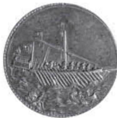
Medalla dedicada a Andrea Doria (1466-1550).

DIRECCIÓN DE ESTUDIOS HISTÓRICOS - INAH direccion.dhe@inah.gob.mx