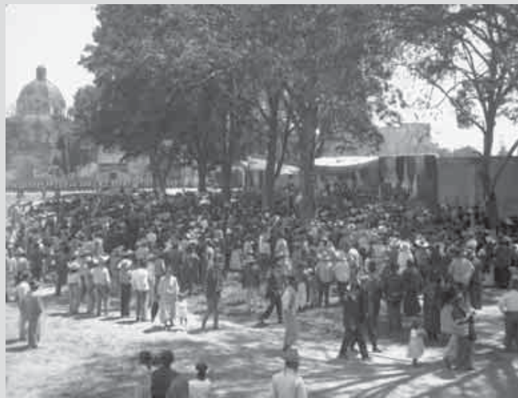
Presidio en la parte sur del Atrio de Atzacapotzalco, al fondo la Banda de Guerra. IX-81.

nal” por el que fuera el presidente municipal de Atzacapotzalco en el año de 1923, el Licenciado Gabriel Ferrer Mendiola, en la sección que denominó “Conmemoraciones”.