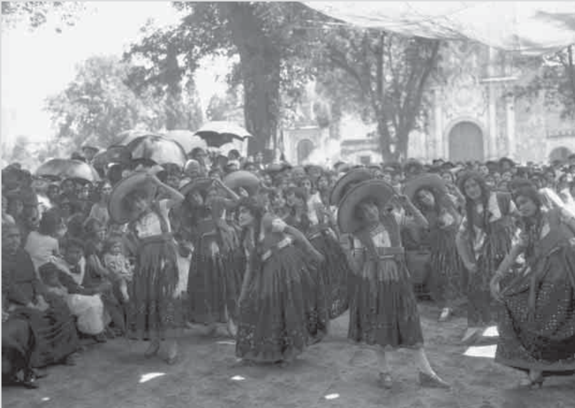
Jóvenes ataviadas con el traje femenino nacional o China Poblana.