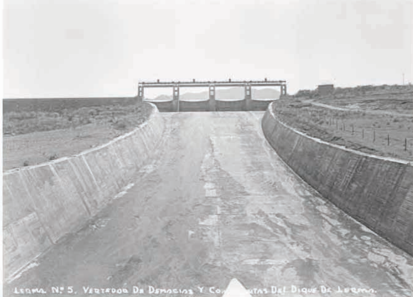
Vertedor de demasías y compuertas del dique de Lerma, estado de Michoacán, 1930.

negativo o soporte en vidrio, se recomienda estabilización y un manejo especial de las mismas.