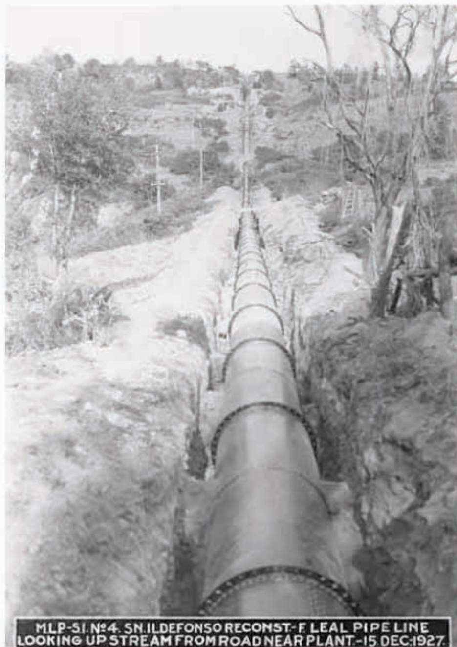
MLP-SI. N°4. SN.ILDEFONSO RECONST.-F LEAL PIPE LINE LOOKING UP STREAM FROM ROAD NEAR PLANT.-15 DEC.1927.

La capacidad instalada de generación en LyFC en nuestros días es de 834 MW, por lo que con las 14 plantas de generación distribuida