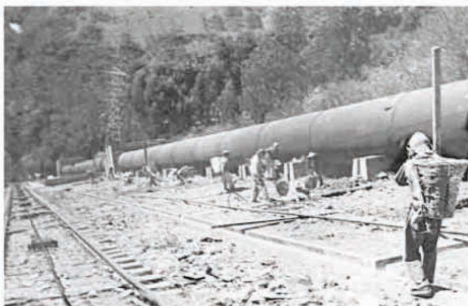
Excavación para los pilares de la tubería de presión. Planta Lerma, estado de Michoacán. 1949.

Estamos seguros de que utilizando dichas herramientas se observarán resultados fehacientes. Hasta nuestros días, en medio de los dilemas reflejados por los criterios entre el Instituto Federal de