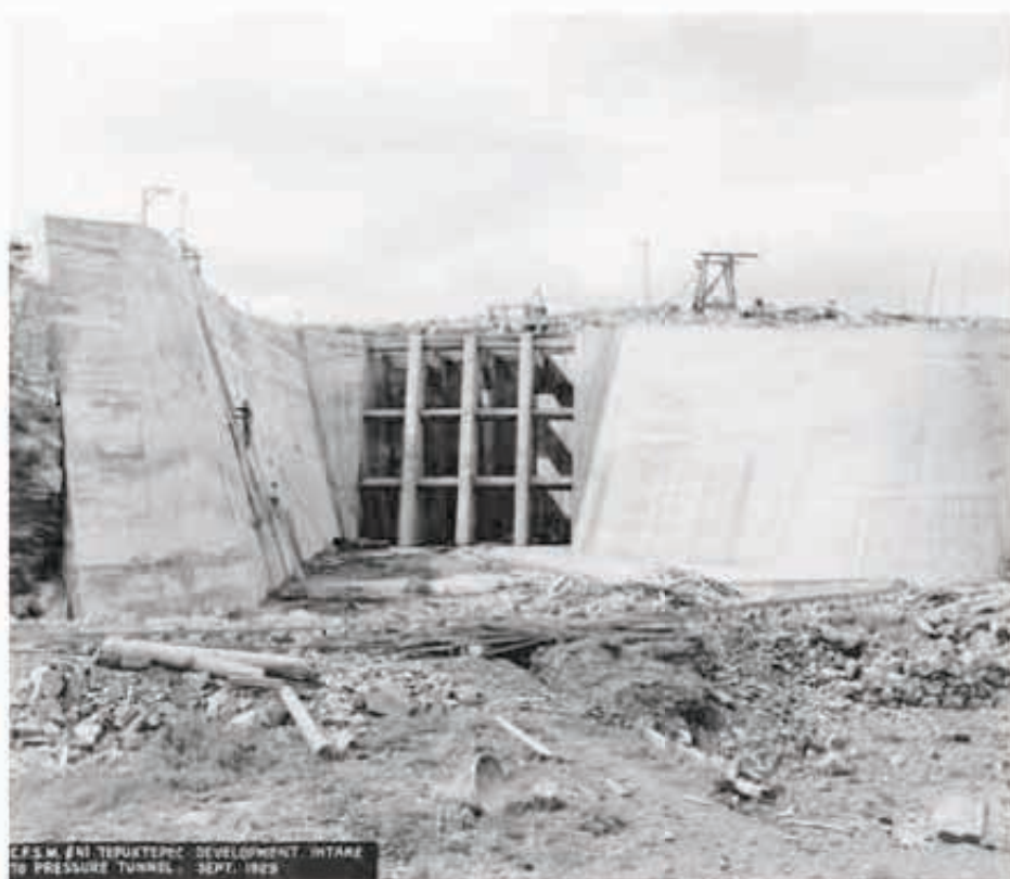
C.F.S.M. EN TEPUXTEPEC. DEVELOPMENT INTAKE TO PRESSURE TUNNEL. SEPT. 1925

-Los materiales de frecuente consulta y/o muy deteriorados, se reproducirán con objeto de restringir el acceso a los originales.