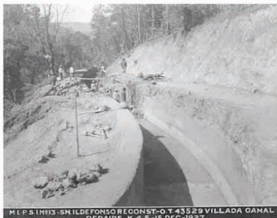
Canal de San Ildefonso, estado de México, 1927.