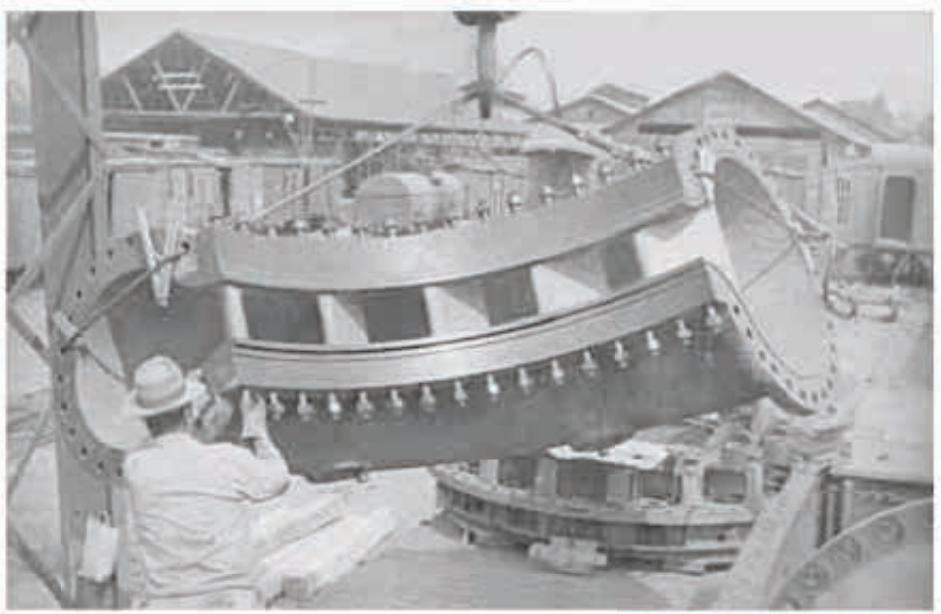
Descargando parte del caracol de la turbina. Planta Lerma, estado de Michoacán. 1949. Fototeca de Luz y Fuerza del Centro. Archivo Histórico.

Históricos de la Revolución Mexicana (INEHRM).