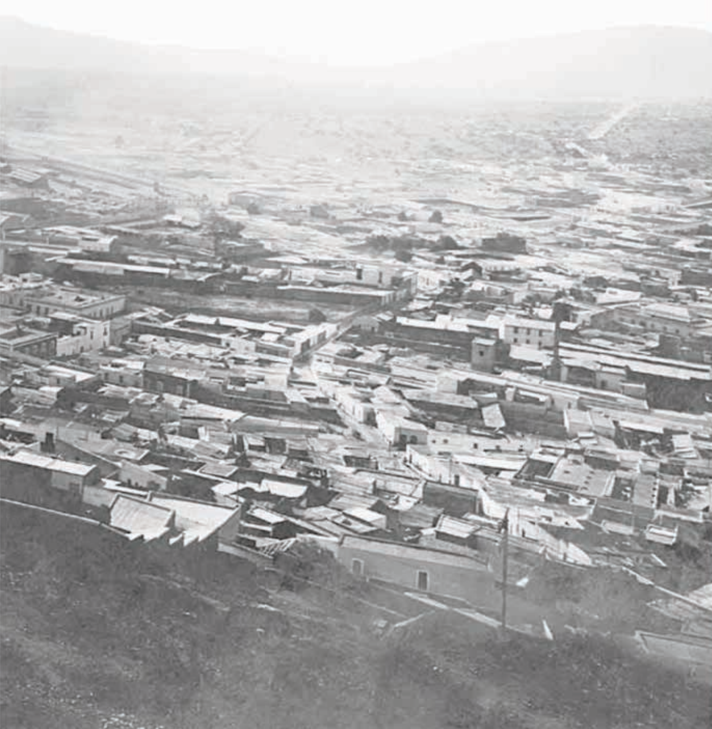
CITY OF PACHUCA LOOKING NORTH POPULATION 50.000.

sarial, entre no pocas dificultades, vicisitudes y tribulaciones. Pero también ha obtenido momentos y circunstancias positivas. Durante su andar, ha acumulado una importante fuente documental que da constancia en buena medida, a los procesos constructivos de sus diferentes instalaciones, donde particularmente la de Necaxa, en el estado de Puebla, sigue funcionando desde 1903.