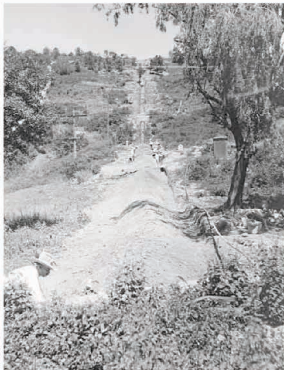
M. L. P. S. I. L. D. # 86-BACK FILLING FERNANDEZ LEAL PENSTOCK, SHOWING CROWNING AND LATERAL - DITCHING IN SOLID MATERIAL. - August 31st 1928

Trabajos en la planta "Fernández Leal", Estado de México, 1928.