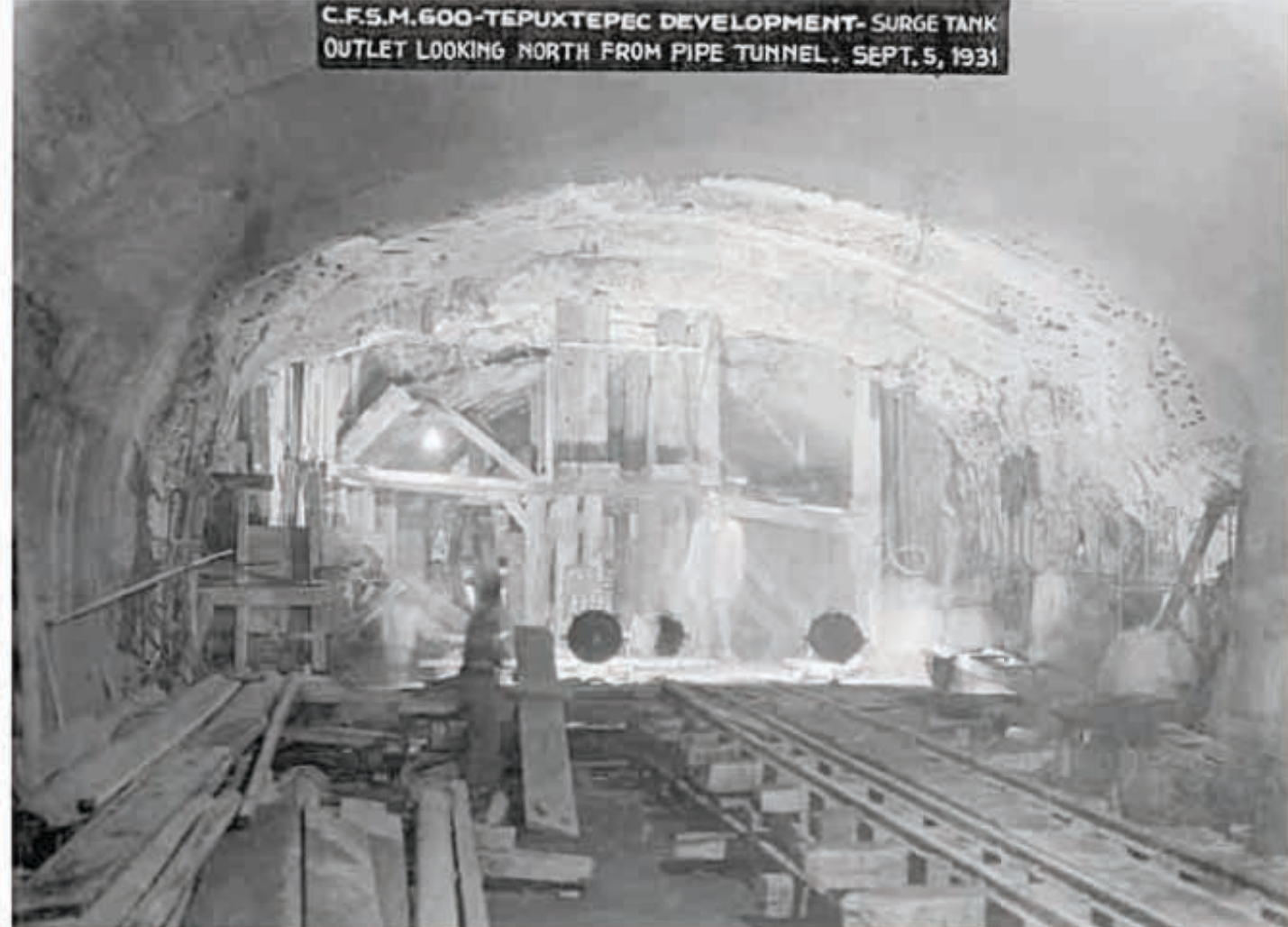
Avance de la obra en el túnel de Tepuxtepec, estado de Michoacán, 1931.

-En el acondicionamiento de las salas de resguardo permanente es definitivo el criterio académico de la instancia de conservación y restauración. 2