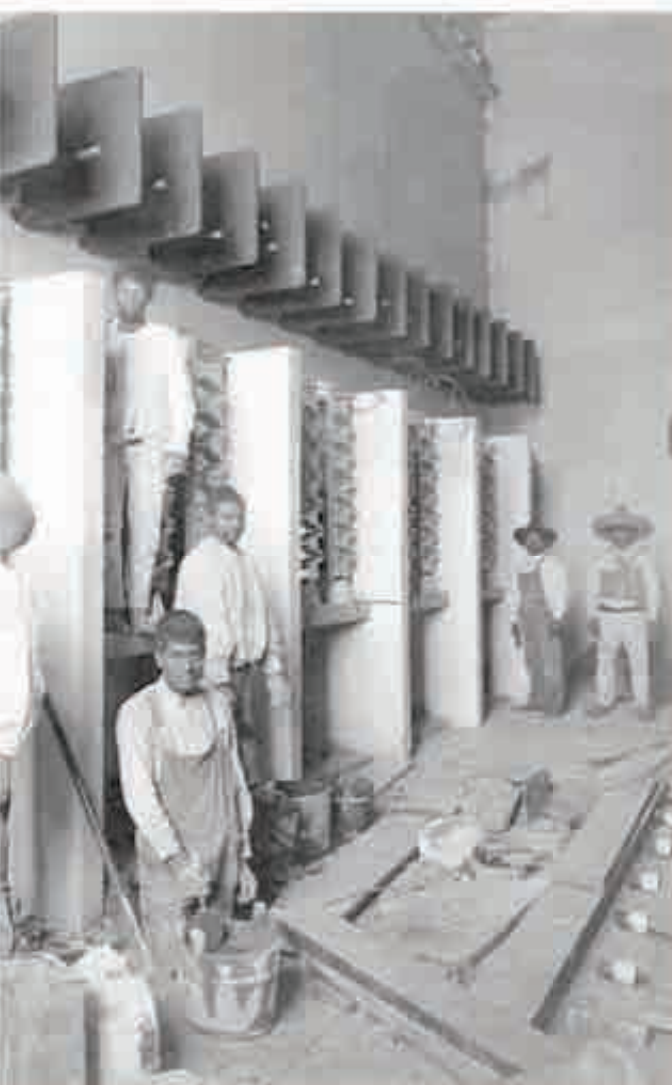
México, Ca., 1915: Fotografía de Luz y Fuerza del Centro, Archivo Histórico.

5 torundas; sin embargo, ante la insistencia de la paciente de que no lo había extraído éste le aseguro que no se había dado cuenta porque estaba "anestesiada", aunque se le había aplicado anestesia local. Días después la inflamación era notable y la radiografía ortopantomográfica 28 reveló que la muela se encontraba en el seno maxilar; la paciente acudió a un cirujano maxilofacial y por recomendación de éste a un otorrino, se decidió operar con anestesia total; la paciente preguntó sobre el procedimiento quirúrgico y el médico le contestó "usted no se preocupe de eso, sólo siga las instrucciones".