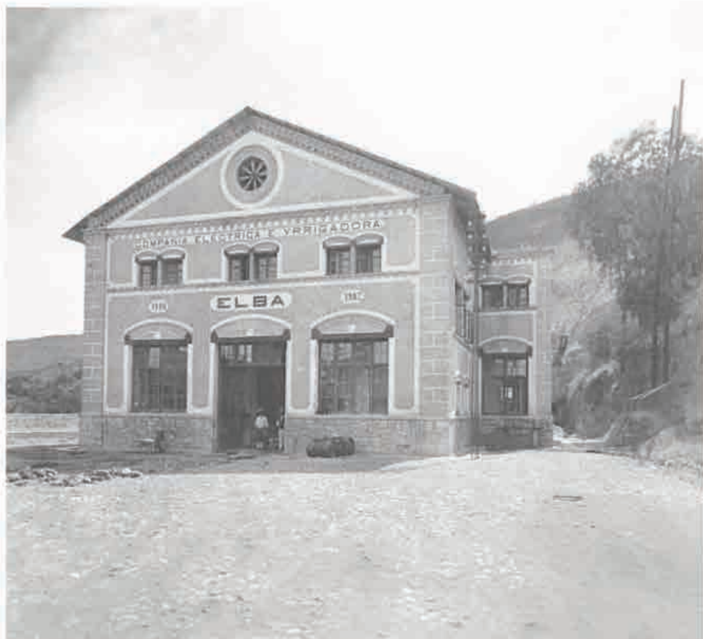
Exterior de la planta Elba, en el estado de Hidalgo, México. Ca. 1915.

WILLIAMS, John R., Manual de ética médica [en línea], Texinfo ed. [Francia]; Unidad de Ética de la Asociación Médica Mundial © 2005 Asociación Médica Mundial, disponible en World Wide Web http://www.wma.net/s/policy/c8.htm