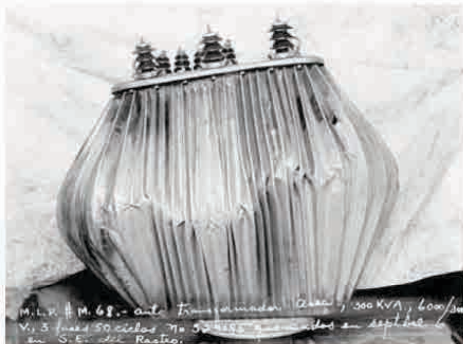
Registro fotográfico de equipos dañados en la Mexican Light & Power Company Limited, Ca., 1930.

(nutritivos o de fármacos) en el interior de una vena (Osol, 1983:1347) en la que se utiliza como impulso la fuerza de la gravedad o una bomba de infusión, que generalmente se instala en las extremidades superiores.