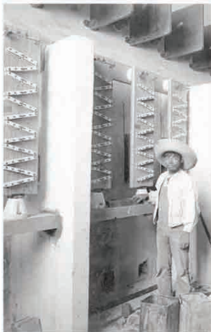
Trabajadores desempeñando sus labores en las instalaciones de Juandó, Hidalgo.

En un hospital pasaron visita los médicos internos, uno de ellos revisó la hoja de enfermería y le dijo al otro tiene bajo el potasio , entonces decidieron administrárselo, trajeron la bolsa y trataron de aplicárselo por vía intravenosa, aunque la bolsa indicaba que la administración debía ser parenteral, la paciente sintió un ardor