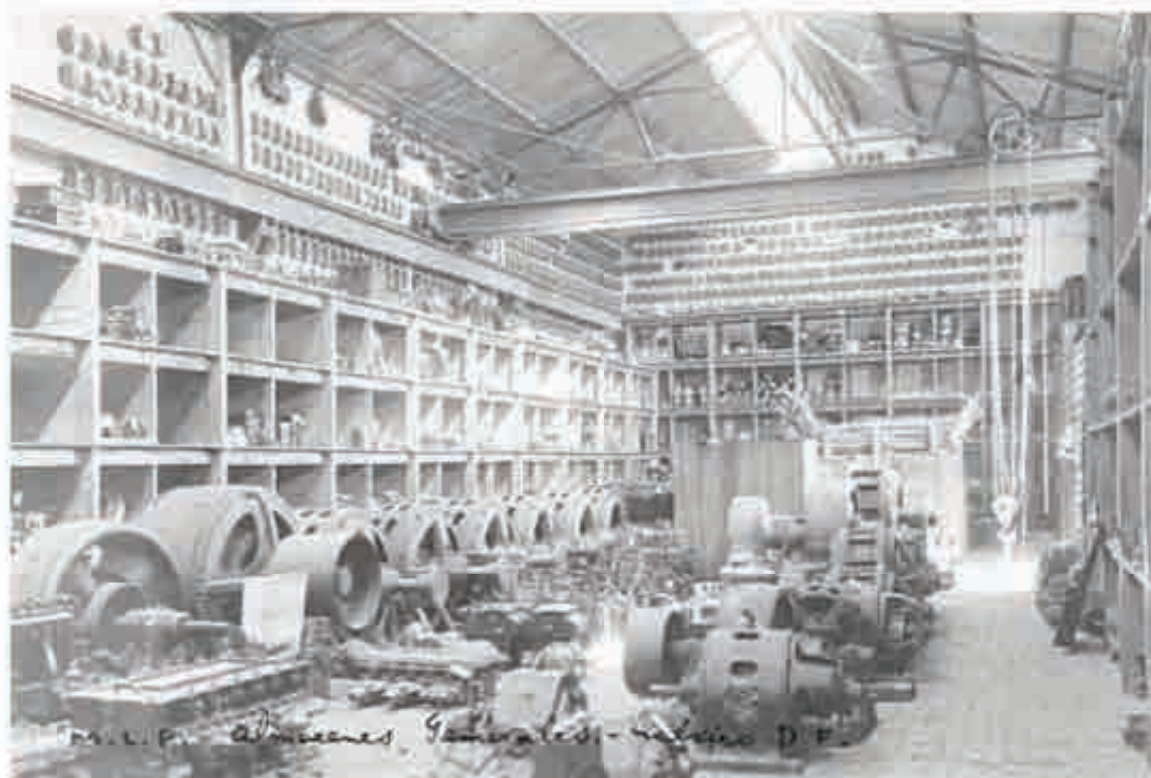
Interior de los almacenes, propiedad de la Mexican Light & Power Company Limited, Ca., 1920.

En esta ocasión nos concentraremos solamente en la cuestión del concepto salud-enfermedad y su trasfondo cultural , al respecto y con una perspectiva muy general, encontramos en nuestro país al menos dos realidades enfrentadas: por un lado la visión impuesta por el sistema de salud occidental caracterizado por ser de tipo curativo, 7 fragmentario 8 y especiali-