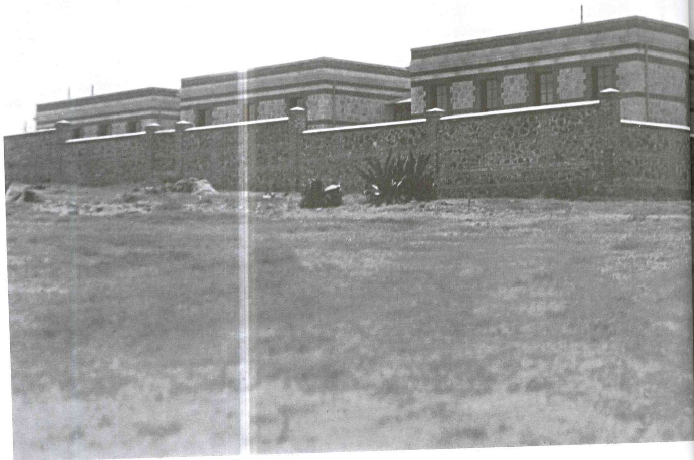
Muro que rodeaba al Manicomio General