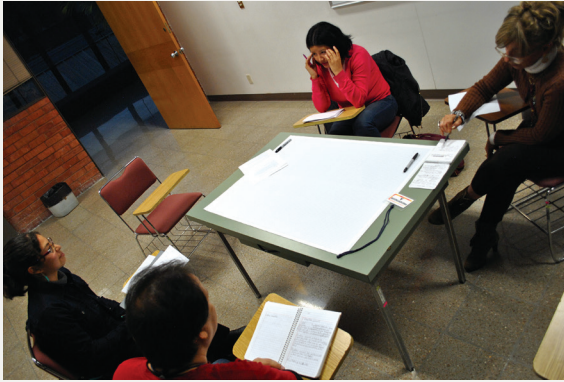
► Figura 1. Proceso de diseño del estudio