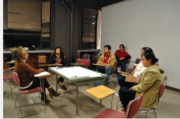
► Figura 2. Aplicación del estudio. Los integrantes del equipo ejercitan la aplicación con sus compañeros de curso.