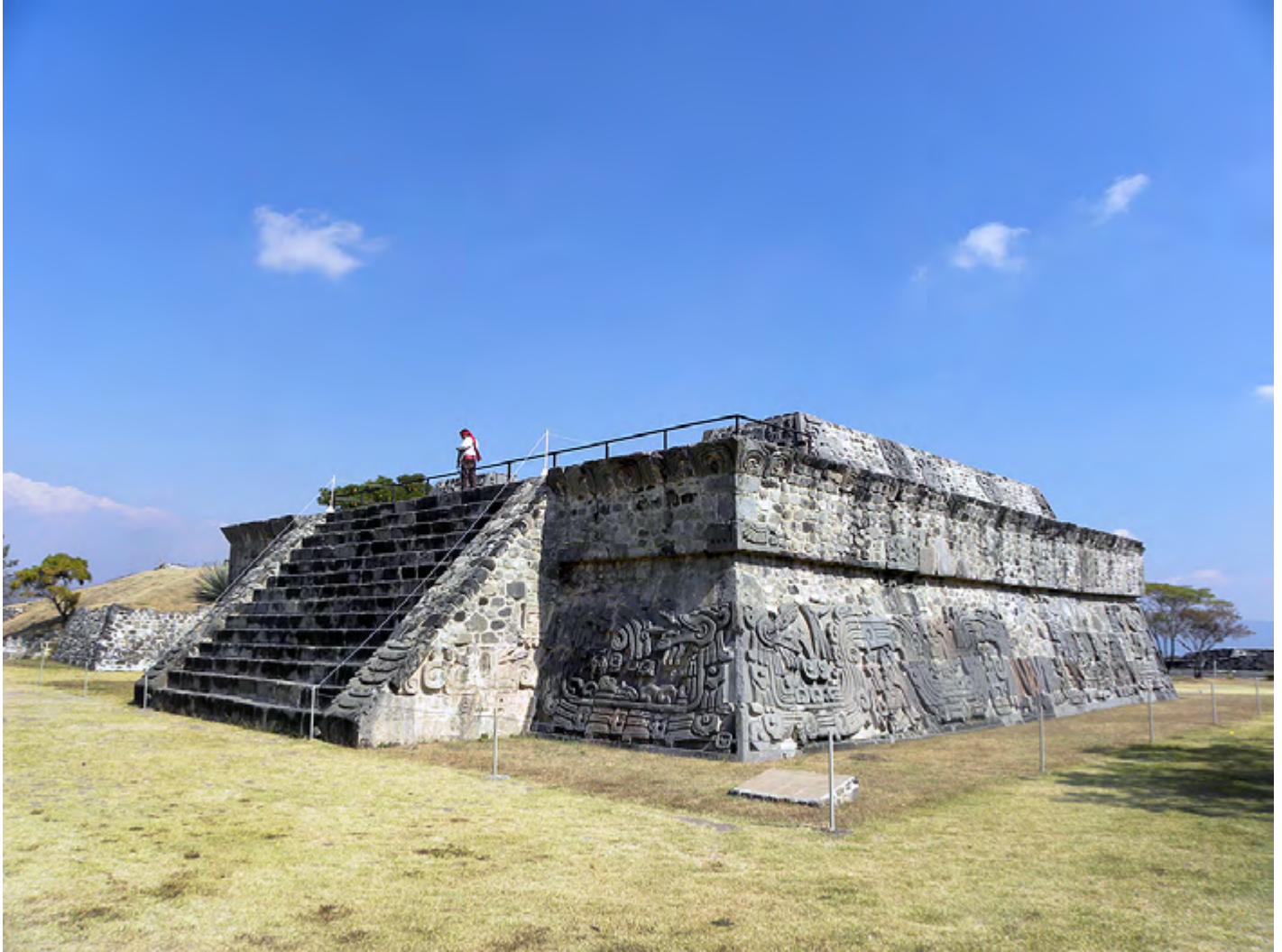
Figura 1. Pirámide de las Serpientes Emplumadas, zona arqueológica de Xochicalco, Morelos (Fotografía: Isabel Medina-González).