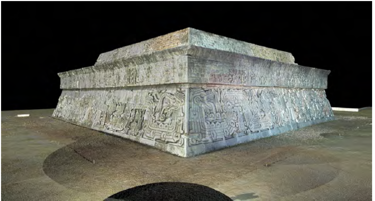
Figura 5b. Modelos tridimensionales de las fachadas este y sur de la Pirámide de las Serpientes Emplumadas, Xochicalco, Morelos.