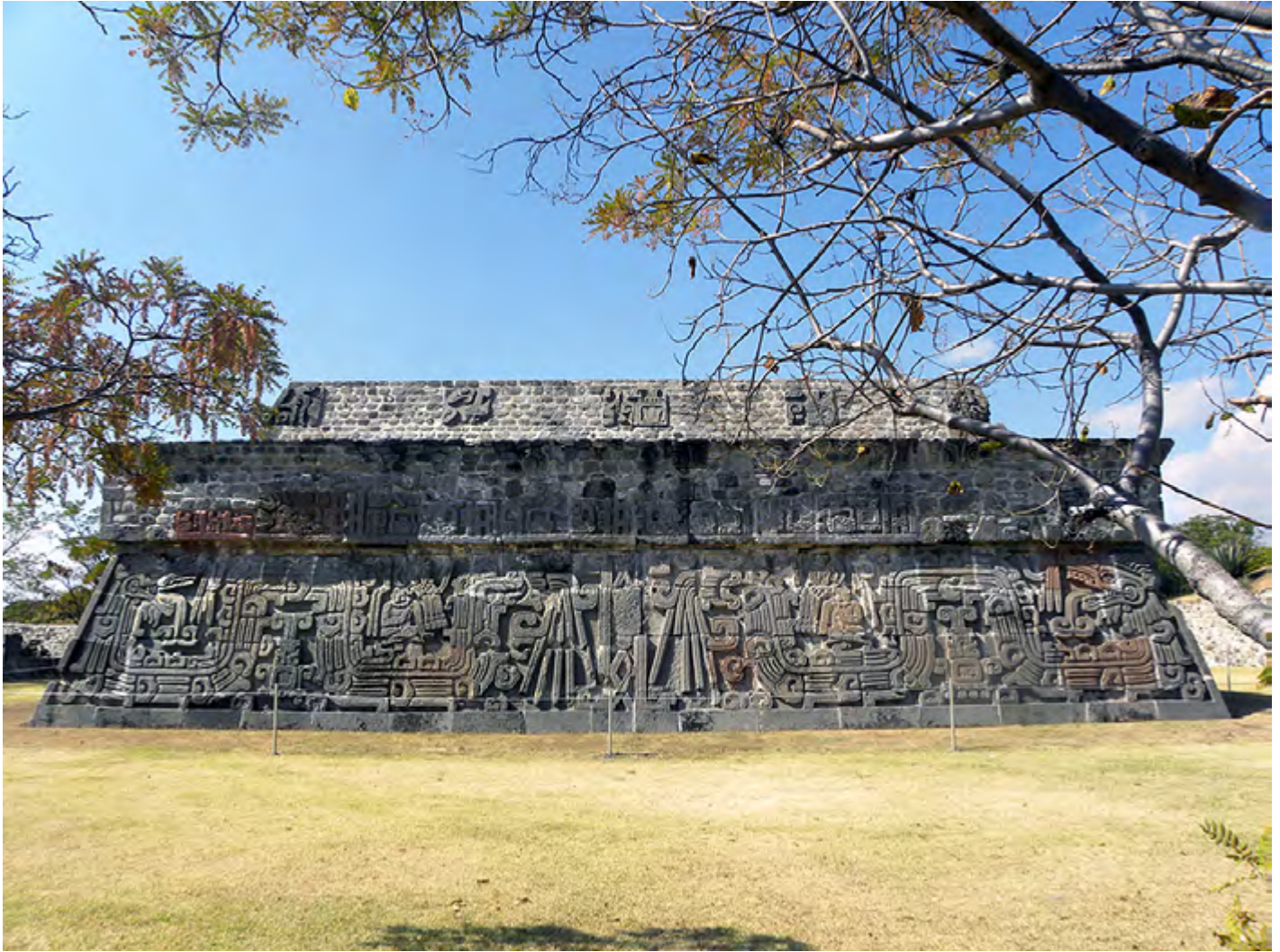
Figura 3. Fachada este de la Pirámide de las Serpientes Emplumadas, Xochicalco, Morelos.