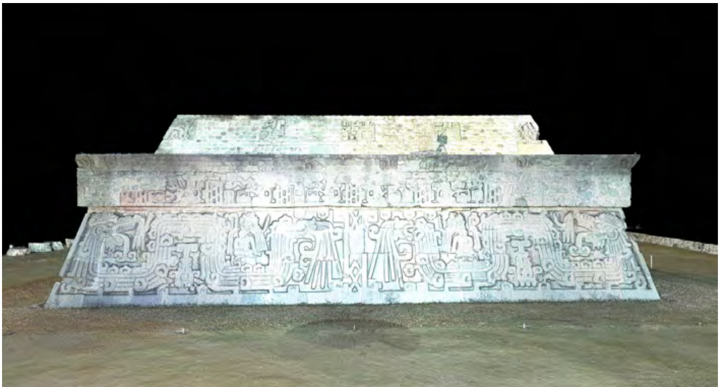
Figura 5a. Modelos tridimensionales de las fachadas este y sur de la Pirámide de las Serpientes Emplumadas, Xochicalco, Morelos.