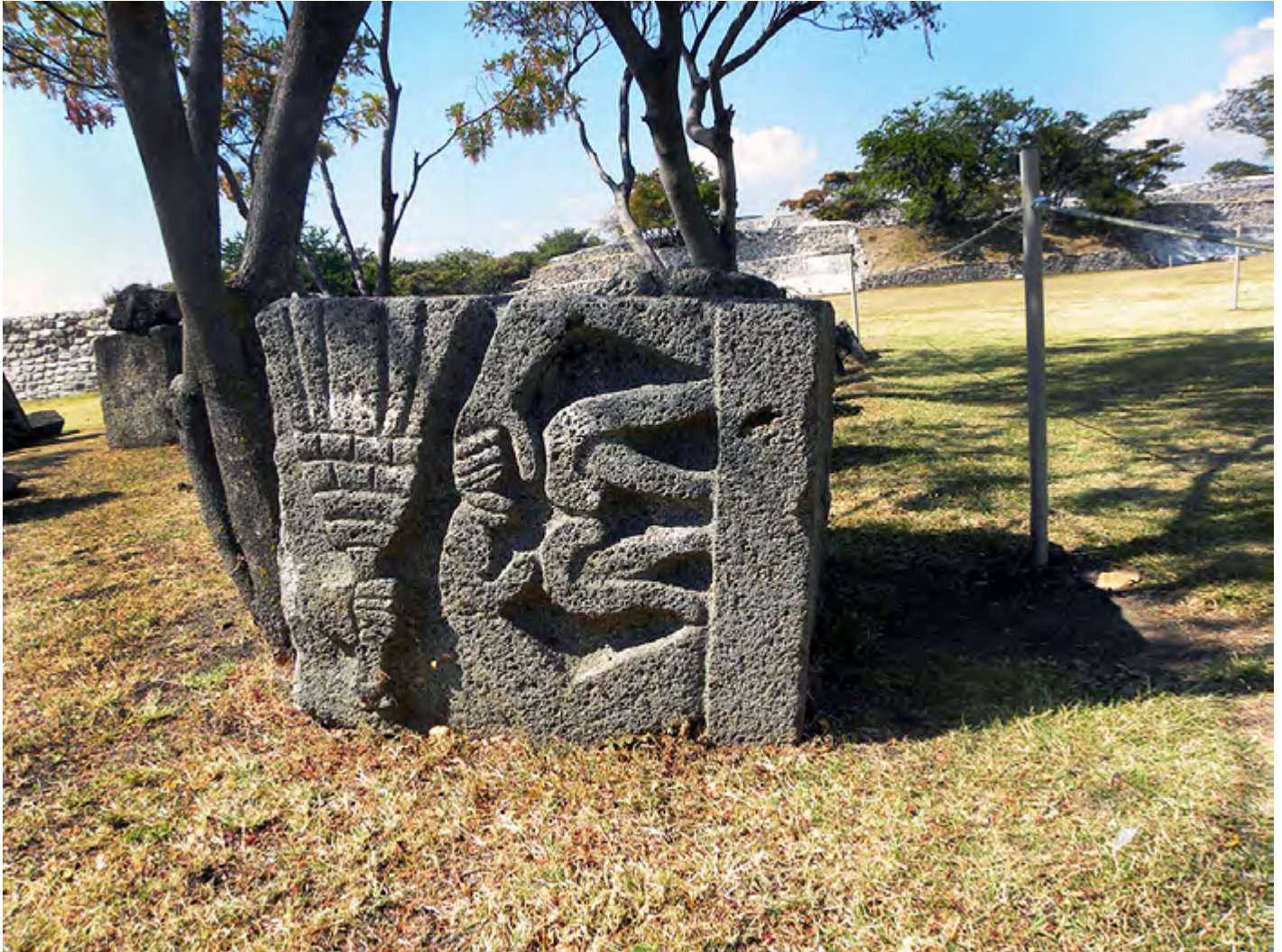
Figura 4. Fragmentos de relieve exentos ubicados en el sector sur de la Pirámide de las Serpientes Emplumadas.