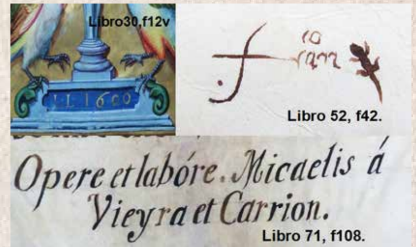
Imagen 1. Libro.30, f12v; Libro 52, f42; Libro 71, f108

Los inventarios catedralicios han sido un recurso mediante el cual se ha ejercido control y memoria de los bienes que constituyen el ajuar, en este caso de la Catedral de Puebla. Es decir, saber qué hay en existencia, y cómo se encuentran los objetos inventariados. Durante el periodo del obispo Francisco Fabián y Fuero 8 (1765-1773) promotor de las artes y de la Biblioteca Palafoxiana, se realizó el Inventario de 1771, donde encontramos una breve referencia a los cantorales existentes en la Catedral de Angelopolitana. Para entonces se consignaron un total de 125 libros, dispuestos en “[...] diez y medio armarios de madera de ayacahuite y cedro, con bisagras y chapas”. 9 En la cita anterior, se hace mención, tanto del número de libros, como al mobiliario que los contiene y que aún cumple con su función.