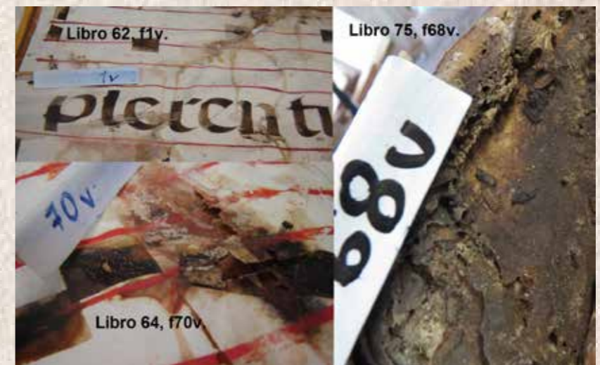
Imagen 5. Libro 62, f1v; Libro 64, f70v; Libro 75, f68

Respecto a la HR y temperatura, hemos consignado daños que van desde pequeñas manchas de humedad, manchas que pasan de foja a foja (imagen 5: L.62, f1v); pérdida de la elasticidad y de la resistencia, hasta un avanzado proceso de degradación (pudrición) del soporte (imagen 5: L.64, f70v). Que ha producido la adhesión de folios en bloques, en casos frecuentes la pérdida de material, así como el desarrollo de hongos y la proliferación de insectos que se alimentan de piel, como posiblemente el Thylophorus contractus de la familia dermestidae “ Odd Beetle ” de los que encontramos fragmentos adheridos al soporte 20 (imagen 5: L. 75, f68).