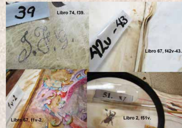
Imagen 8. Libro 74, f39; Libro 67, f42v-43; Libro 67, f1v-2; Libro.2, f51v.

Las craqueladuras y pequeños desprendimientos manifiestos en la capa pictórica de las letras capitulares (imagen 9: L.52, f10), nos han permitido deducir que, posiblemente el miniaturista hacía los detalles de las obras, como se puede observar en los desprendimientos de la letra ubicada en el Libro 52. En otros libros se aprecian letras poco detalladas, sin perfilar, sin