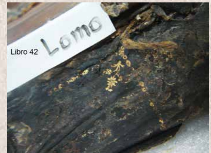
Imagen 2. Libro 42, lomo