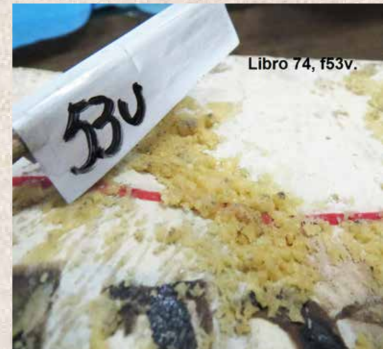
Imagen 6. Libro 74, f53v.

Hemos identificado señas de vandalismo producido, posiblemente a partir del siglo XIX, manifiestas mediante la escritura de notas (imagen