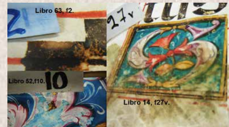
Imagen 9. Libro 63, f2; Libro 52, f10; Libro 14, f27v.