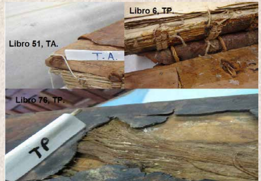
Imagen 3. Libro 51, TA; Libro.6 TP; Libro 76, TP

En casos puntuales como el Libro 16 entre el forro y los cuadernillos se colocó una cama de fibra vegetal, posiblemente para dar cuerpo al lomo. En el Libro 76 se aplicó a las tapas el mismo procedimiento (imagen 3: L.76, TP).