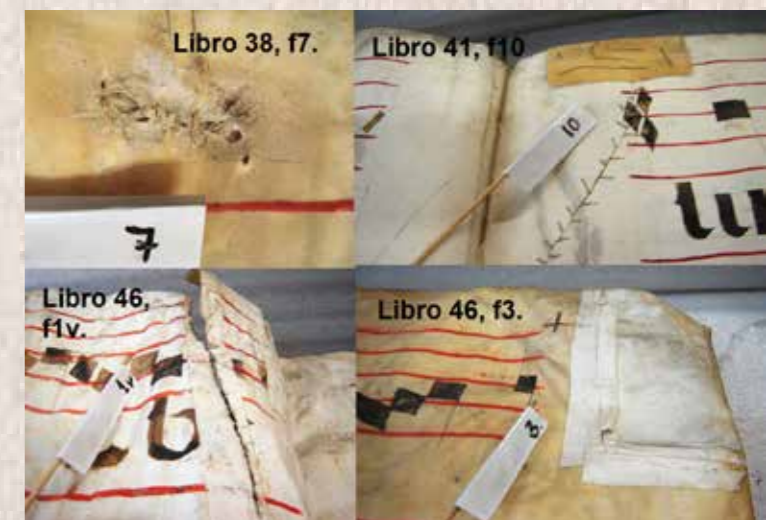
Imagen 7. Libro 38, f7; Libro 41, f10; Libro 46, f1v; Libro 46, f3