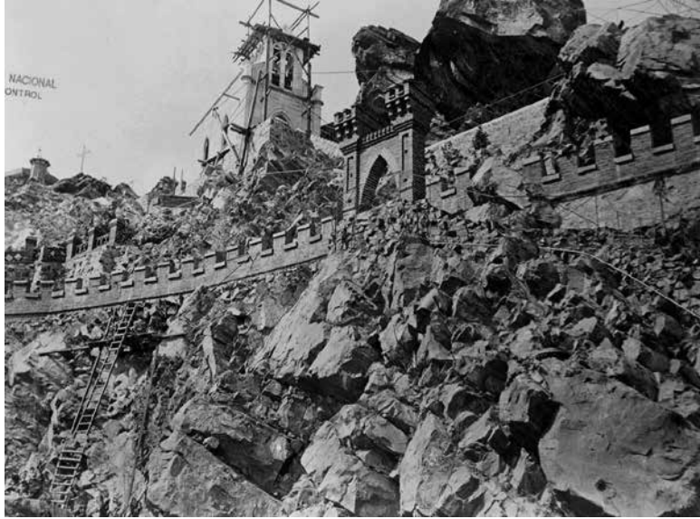
Figura 13. XXIII. Las rocas de la Ermita.