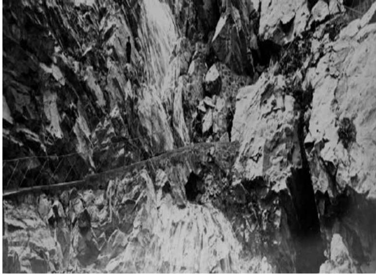
Figura 9. XII. La gran cascada.