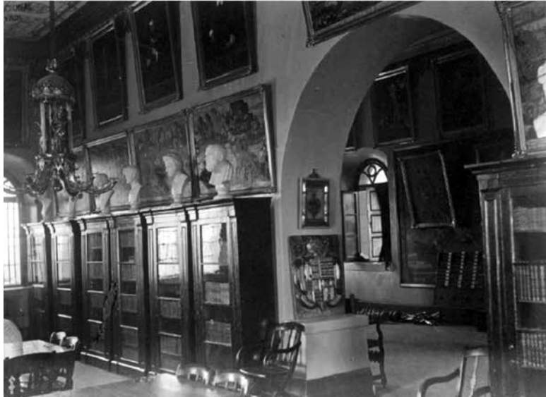
Figura 17. XXXIII. La biblioteca Carrasco-Albano.