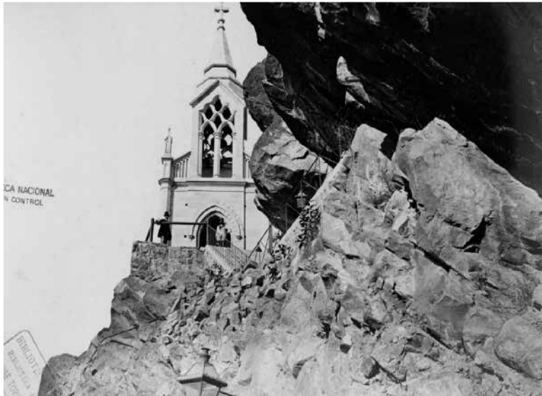
Figura 14. XXIV. La Ermita.