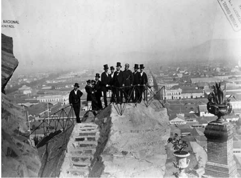
Figura 15. XXVIII. La roca Tarpeya.