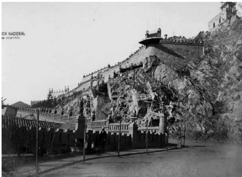
Figura 20. XLV. El camino de los jardines i el parque del Santa Lucía.