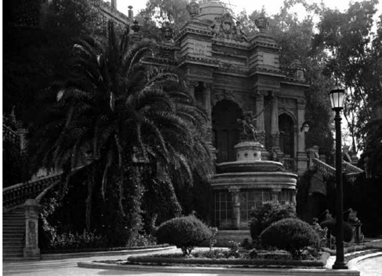
Figura 21. Jardines del cerro Santa Lucía, 12 de enero de 1928, en Luces de modernidad , archivo fotográfico CHILECTRA, Santiago, Larrea, 2001, p. 23.