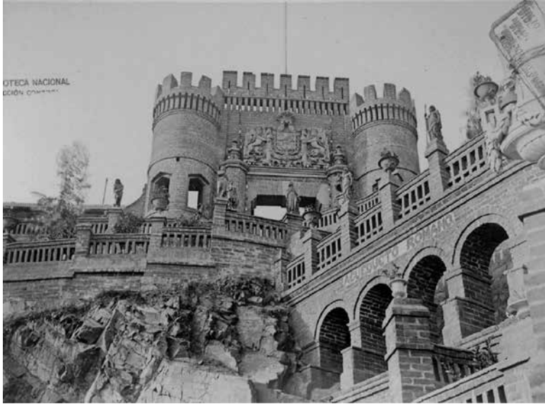
Figura 11. XVI. La portada del escudo español.