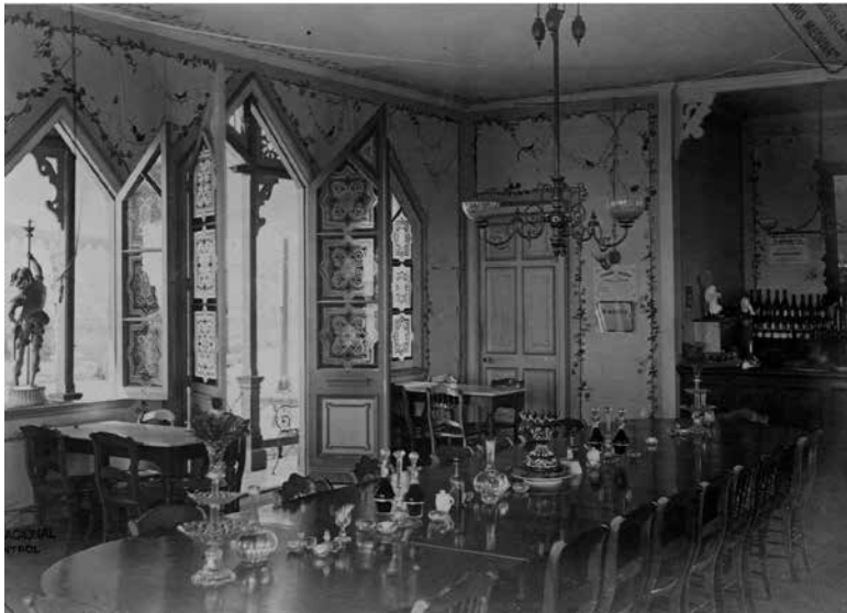
Figura 12. XVIII. Interior del restaurant.