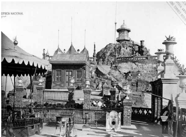
Figura 18. XXXVII. Chalet del superintendente.