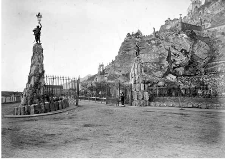
Figura 5. IX. La portada.