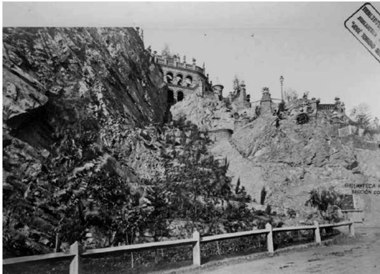
Figura 10. XV. La quebrada del Pinal.