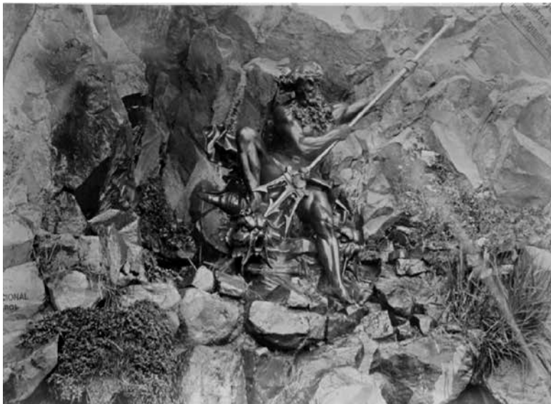
Figura 8. XII. Gruta de Neptuno.