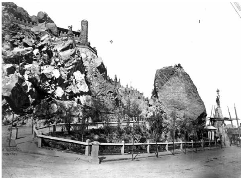
Figura 6. X. El jardín elíptico i el Peñón de Huelén.