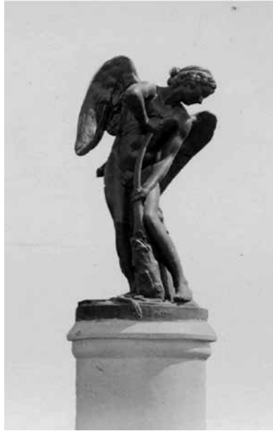
Figura 19. XLIII. El cupido de Bouchardon.