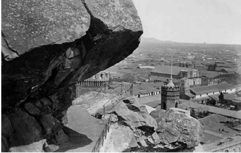
Figura 3. VIII. Vista del llano de Maipo.