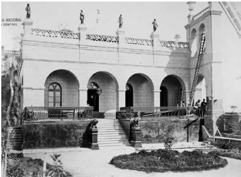
Figura 16. XXXII. Galería del Museo Histórico.