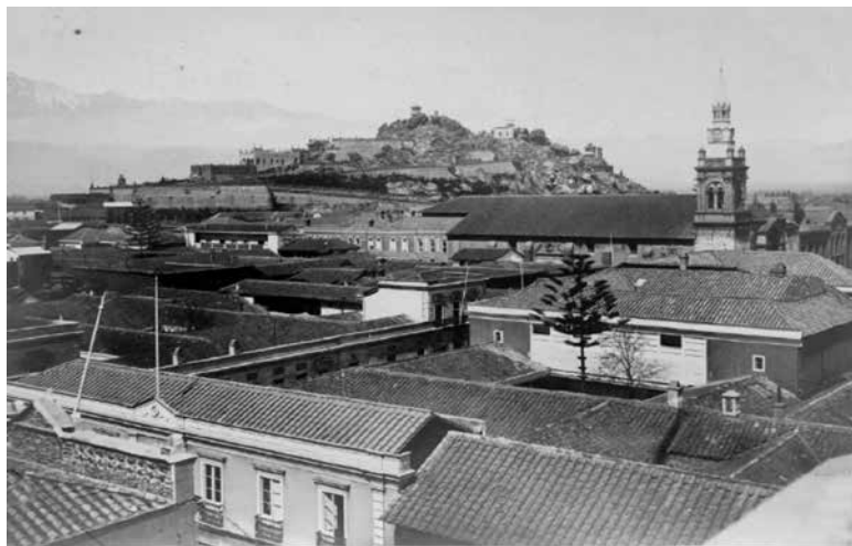
Figura 2. Vista general del Santa Lucía.