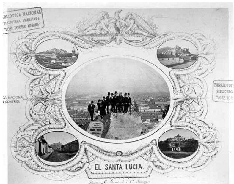
Figura 1. Portada del Álbum del Santa Lucía .