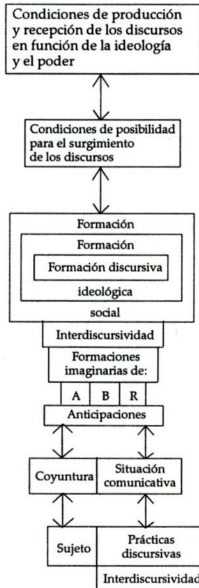
Cuadro 2. Condiciones de producción y recepción de los discursos*

* las flechas bidireccionales indican un movimiento dialéctico