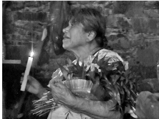
Foto 3. Madrina de costumbre "canta" al altar mientras lleva en sus brazos las figuras de papel recortado del Antigua, la Madre Tierra y la Sirena.