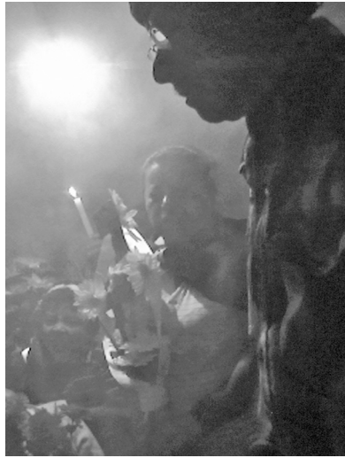
Foto 2. Rezandero lleva la acción ritual mientras la Madrina de Cruz sostiene la cruz de madera del difunto.