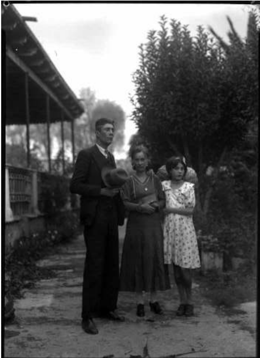
14. Finca de G. Hernández y familia. Inv. 150273, Fondo Casasola, Sinafo-INAH.