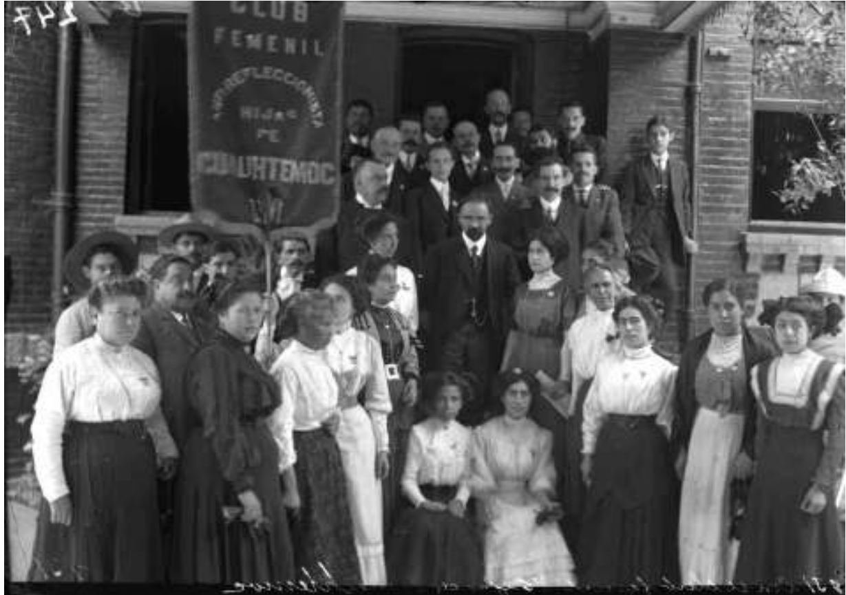
2. Club femenil antirreeleccionista con Francisco I. Madero. Inv. 5966, Fondo Casasola, Sinafo-INAH.