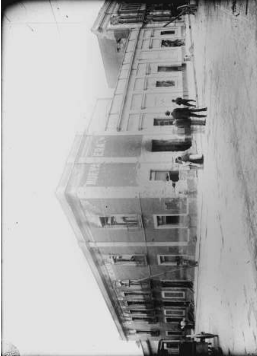
18. Edificio Nueva Era. Inv. 351853, Fondo Casasola, Sinafo-INAH.