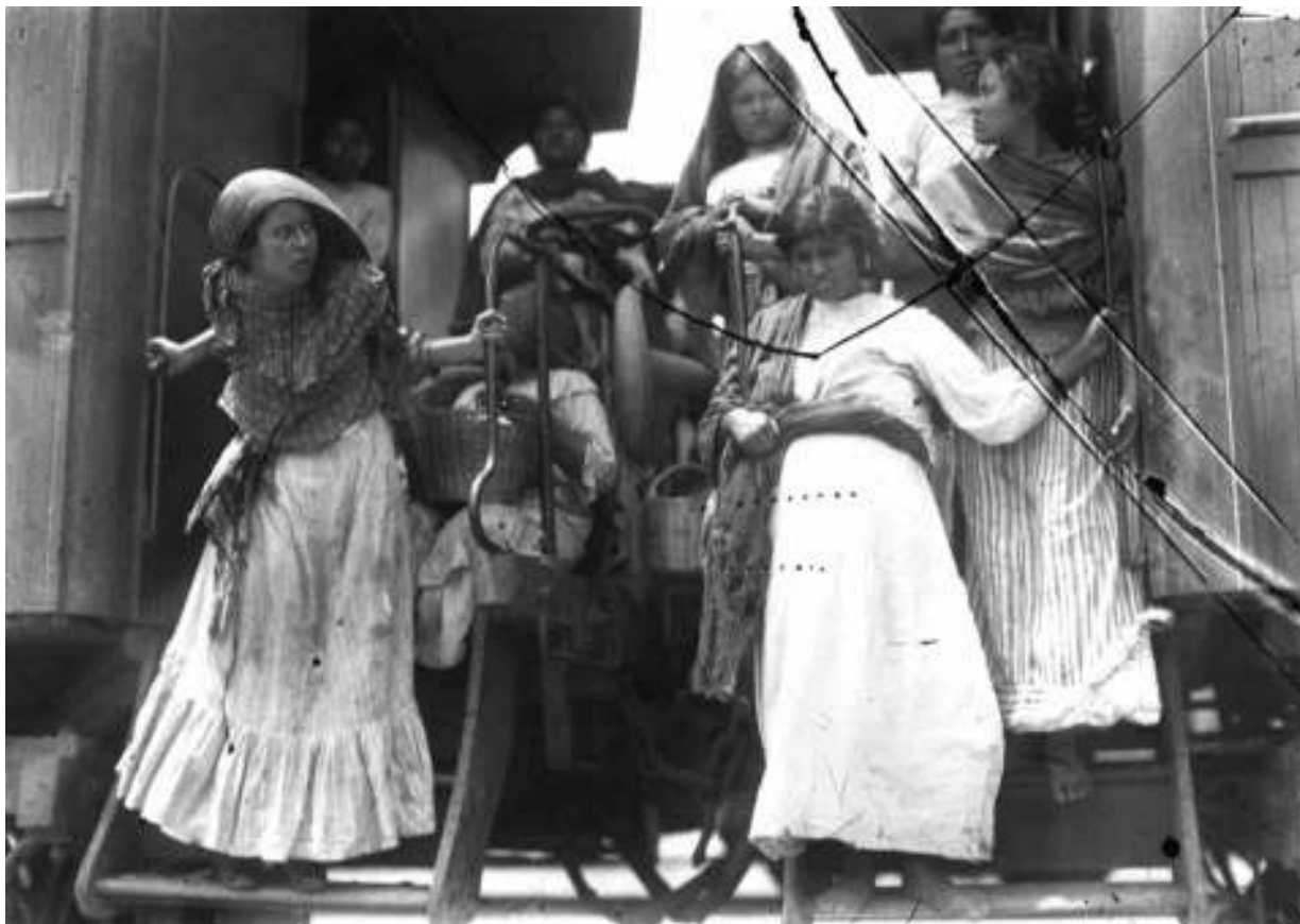
1. Soldaderas en estribo de tren, 1912. Inv. 5670, Fondo Casasola, Sinafo-INAH.