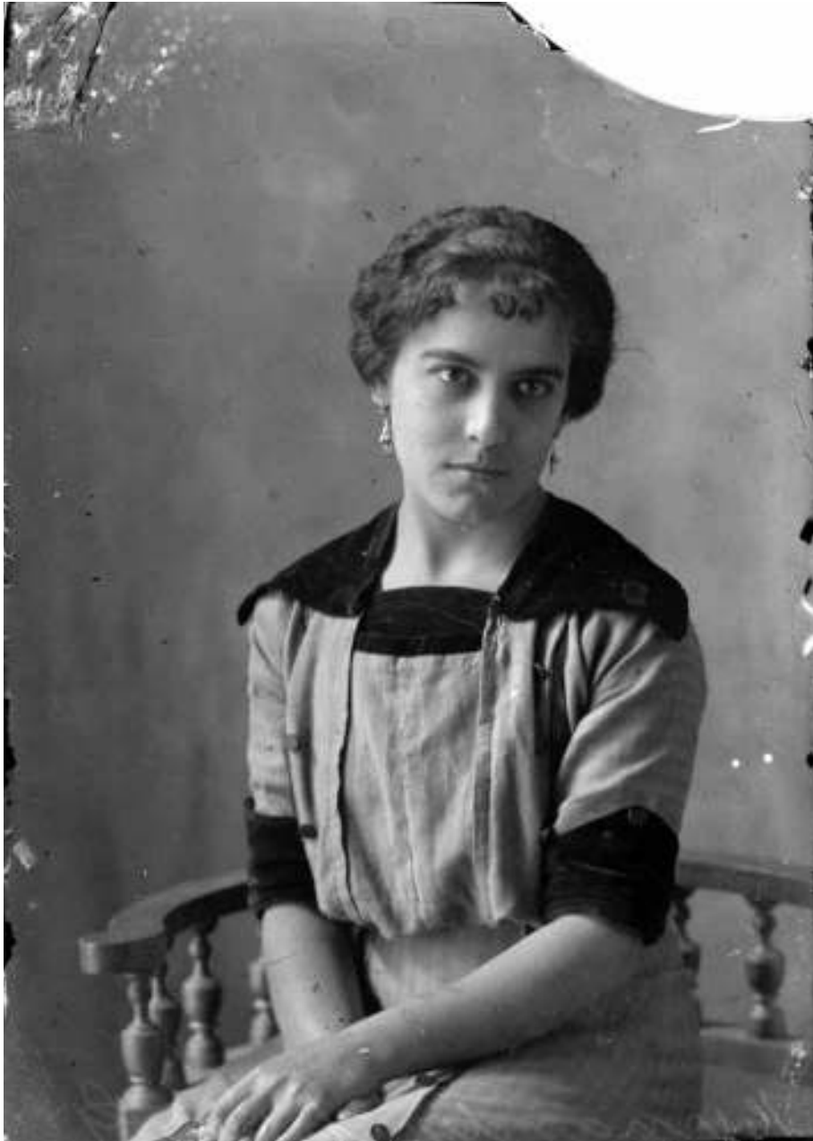
5. Esposa de G. Hernández. Inv. 18116.