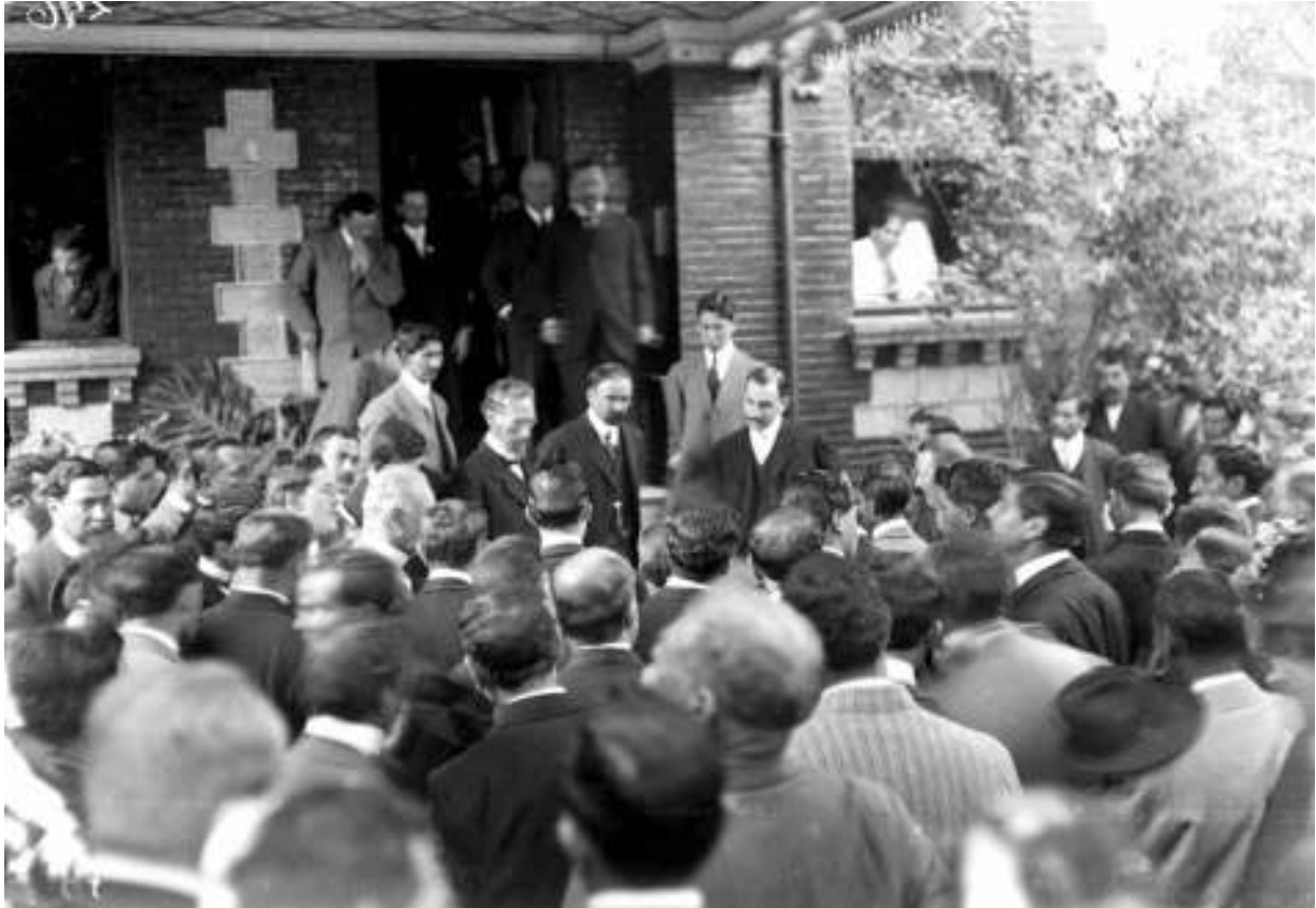
7. Francisco I. Madero recibe la adhesión de empleados, 12 de agosto de 1911. Inv. 36381, Fondo Casasola, Sinafo-inah.