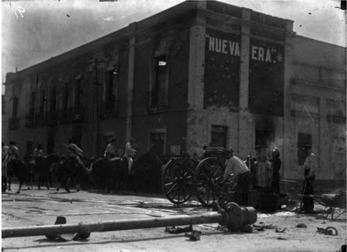
8. Edificio incendiado del diario Nueva Era . Inv. 37346, Fondo Casasola, Sinafo-INAH.