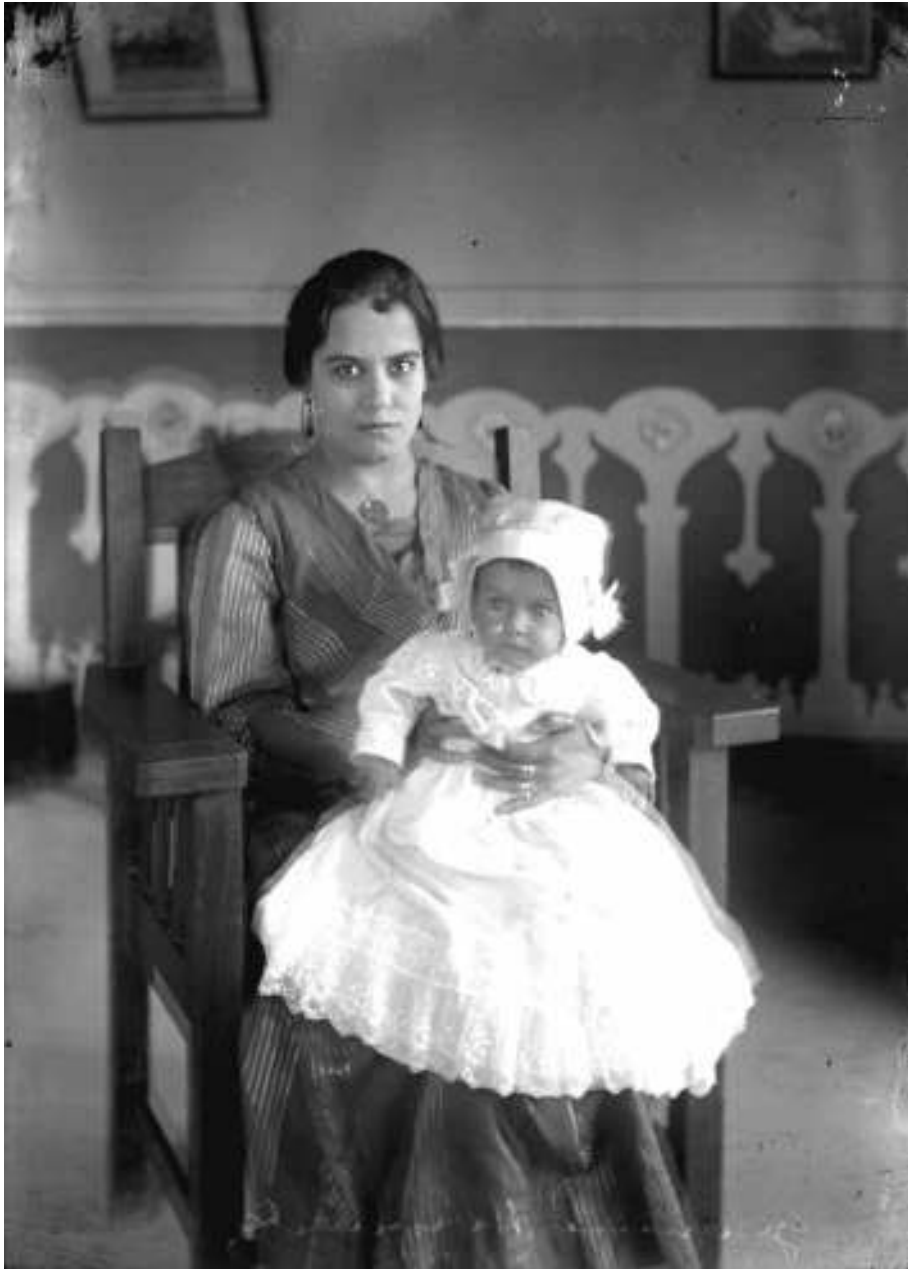
17. Esposa e hija de G. Hernández. Inv. 150282, Fondo Casasola, Sinafo-INAH.