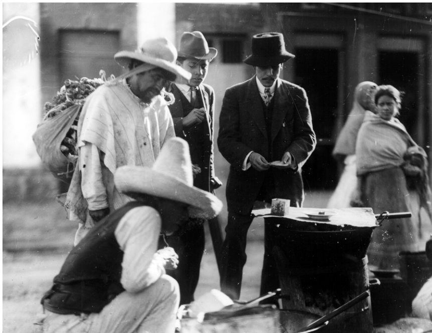
Fig. 4. Hombres en expendio de fritangas. Col. Sinafo-INAH, núm. de inv. 160763.

dispersos a lo largo y ancho de la ciudad, pero concentrados en buena medida en el Centro histórico. (Fig. 3.) Mientras que los restaurantes lujosos y exclusivos del Porfiriato se agrupaban de forma compacta a lo largo de la franja que trazaba la elegante calle de San Francisco, entre el Zócalo y la Alameda, los puestos de tacos no discriminaban a nadie y atendían por igual a los elegantes dandies ciudadanos de la calle de Palma y a los andrajosos pelados de Tepito. (Fig. 4.) No obstante, las taquerías se agrupaban en torno a lo que podría denominarse como “eje del chile”, y que iba de los barrios populares ubicados al sudeste del Zócalo, a los teatros de carpa de Santa María la Redonda, al norte de Bellas Artes.