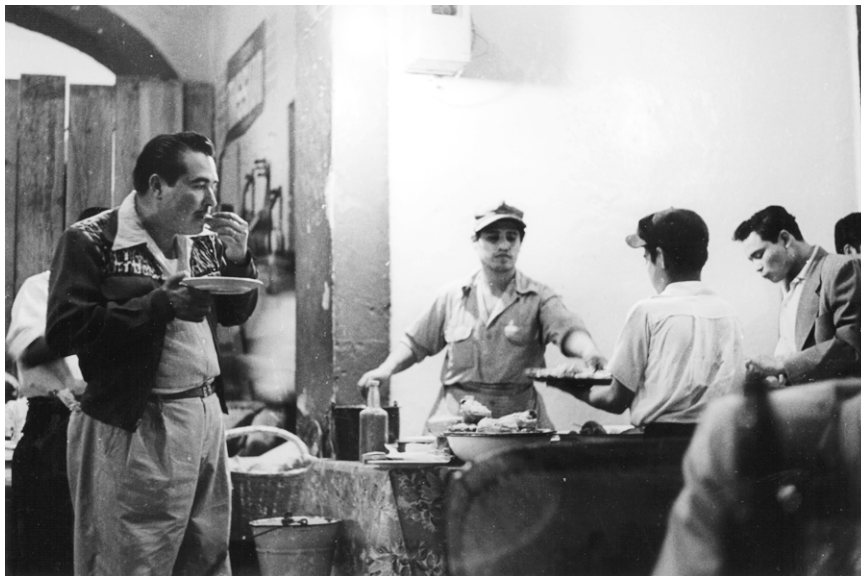
Fig. 6. Hombre que come tacos en un puesto. Col. Sinafo-INAH, núm. de inv. 382144.

de carbón había sido remplazado por una resistente parrilla, incorporándose otros elementos para mejorar las condiciones de venta (como las tablas de madera para picar la carne y los ingredientes y recipientes de cristal para almacenar los condimentos). Finalmente, los tacos les fueron servidos a los clientes en platos, eliminando la práctica de ofrecerlos en la mano.