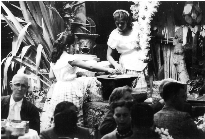
Fig. 8. Mujeres que elaboran tortillas en un restaurante.

las mujeres campesinas se habían liberado de esta antigua carga. Cuando el grupo Maseca monopolizó el mercado del maíz en un periodo ya cercano al cambio de milenio, las mujeres indígenas mazatecas se encontraron asimismo con un nicho de mercado de tortillas elaboradas de grano fresco de nixtamal para el consumo de la clase media de la Ciudad de México. 68