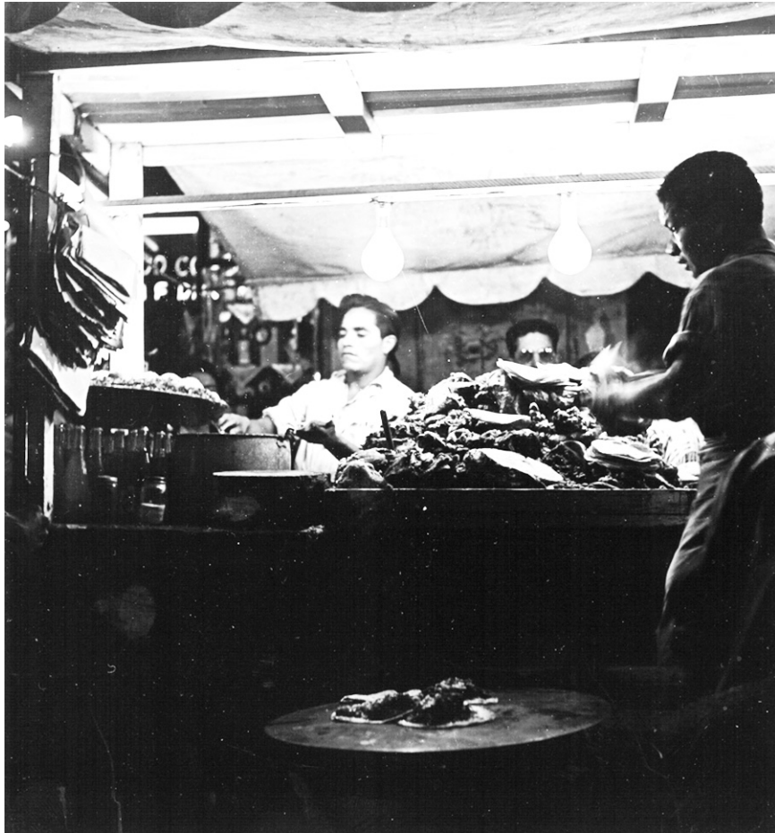
Fig. 7. Vendedores de tacos en su puesto. Col. Sinafo-INAH, núm. de inv. 382183.

querías de la Ciudad de México. En torno a estos negocios se había formado una numerosa y diversa concurrencia, integrada por comensales lo suficientemente jóvenes para apreciar la novedosa cocina regional. La construcción de la red de ferrocarriles durante el Porfiriato e integrada al sistema de transporte aseguró la disponibilidad de otrora raros ingredientes. Finalmente, una considerable legión de expertas culinarias convergieron en la capital, mujeres migrantes que traían consigo una amplia variedad de recetas de platillos regionales. Aun así, queda la pregunta si las clases trabajadoras atribuyen a su repertorio de platillos algún significado político. ¿Acaso ellos sencillamente se topan con un puesto que sirve comida