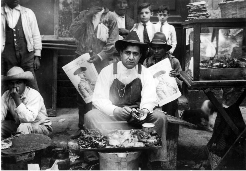
Fig. 5. Hombres en un puesto de tacos y fritangas. Col. Sinafo-INAH, núm. de inv. 163239.

Por otra parte, un incremento del consumo de tacos de carne puede también haber influido en el aumento de la presencia masculina en la actividad. La enchiladera del siglo XIX, tuvo su contraparte masculina en el vendedor de barbacoa, quien cargaba un pequeño anafre por las calles de la capital. Esta forma de comercio ambulante fue prohibida hacia finales de siglo por las autoridades sanitarias del Consejo Superior de Salubridad, con lo cual el vendedor frecuentemente se apostaba en puestos o fritangas. Hacia 1920, para satisfacer las regulaciones sanitarias, estos vendedores utilizaron recipientes de cristal que ponían sobre un sencillo bracero con el fin de mantener caliente la carne y las tortillas, las cuales eran simplemente apiladas sobre la base del recipiente. (Fig. 5.)