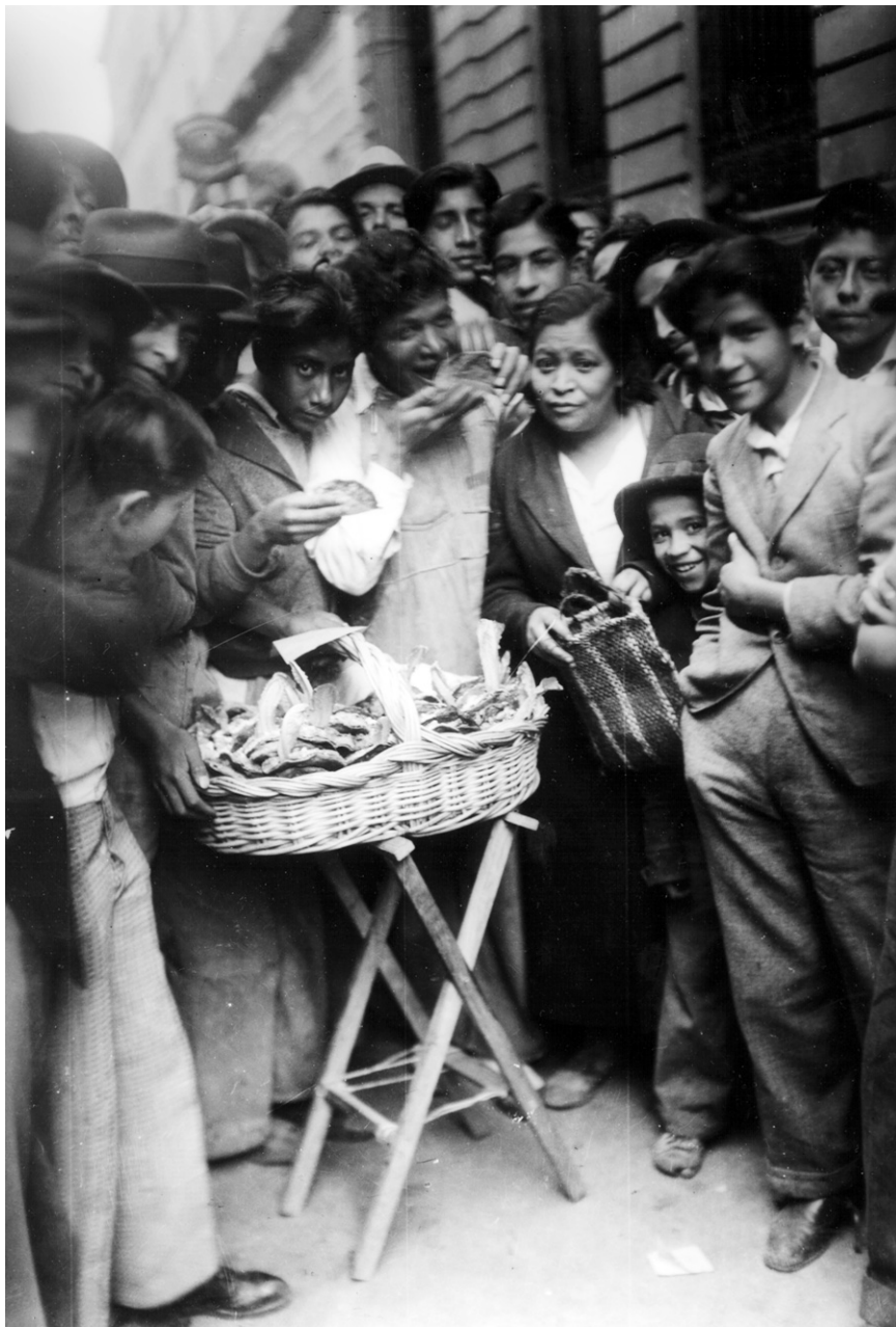
Fig. 2. Voceadores almuerzan tacos. Col. Sinafo-INAH, núm. de inv. 155025.