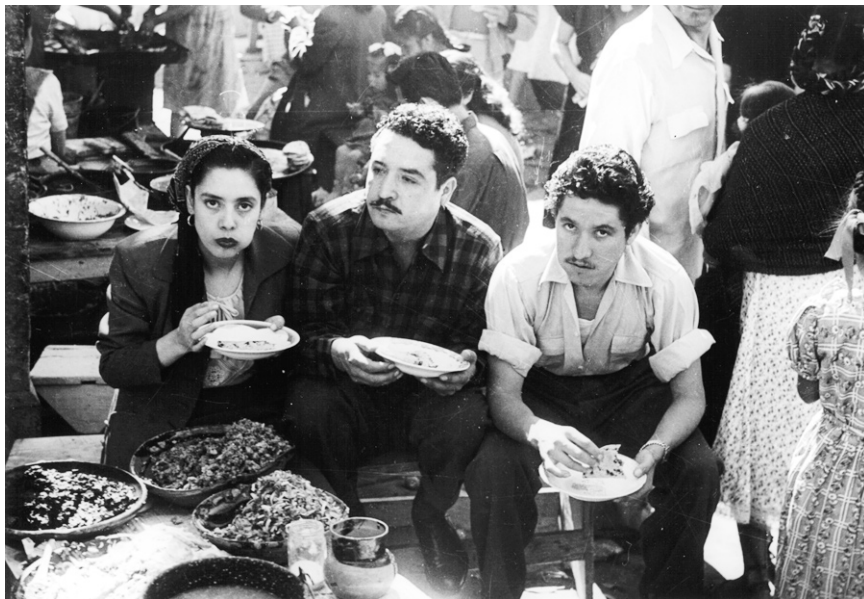
Fig. 1 Comedores de tacos en la fiesta de la Guadalupeana. Col. Sinafo-INAH, núm. de inv. 374177.

Ramos siguió en este caso la definición genérica que recopiló la Real Academia: “bocadillo que se toma fuera de las horas de comida”, pero proporcionó, a su vez, los orígenes geográficos de la expresión, en este caso el Distrito Federal, lo cual por otra parte ayuda a circunscribir la palabra en términos de su significado mexicano. Además, Ramos agrega una interesante definición de “tacón” como “echador de tacos, comelón”, sugiriendo con ello que el uso popular del término estuvo en cambio constante. 30